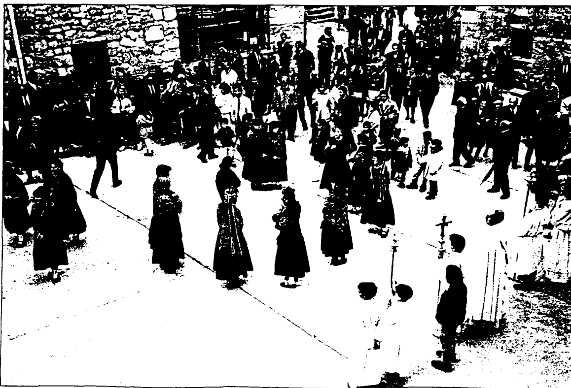
Baile de "El Pollo". San Pascual 1996.