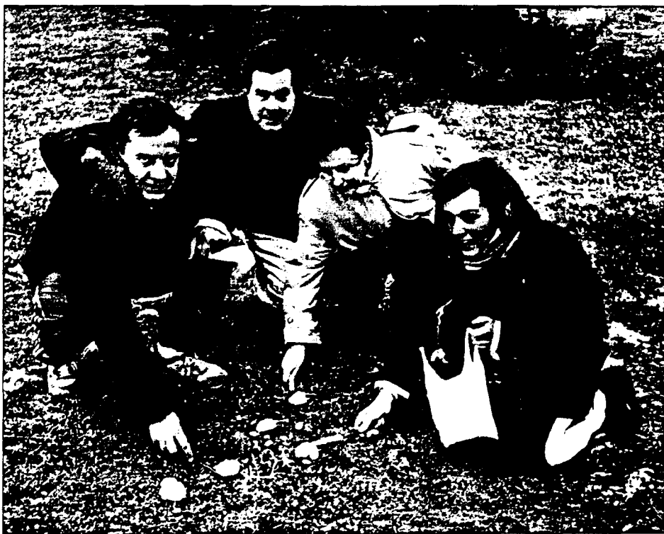
Setas en el sabinar. Mayo de 1996.

El día 17 de mayo, auténtico día de San Pascual, nos reunimos unas 40 personas a merendar en el centro social de la plaza; la armonía reinó en todo momento. San Pascual