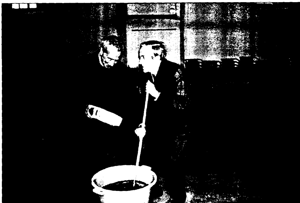
Preparando la Limonada

Yo, como Presidente, debo dejar el cargo. Llevo 5 años de vicepresidente y director del boletín. Este verano será el tercero que ejerzo como Presidente, además de "Echar manos" en las actividades que me necesitan. En total, 8 años de dedicación (sobretudo al boletín).