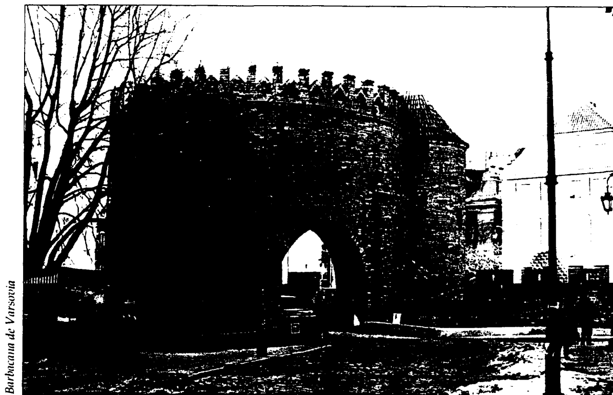
Barbacana de Varsovia

En Cracovia, igualmente la visita a la Barbacana forma parte de cualquier trayecto, ya que es uno de los puntos de entrada a la ciudad antigua, prácticamente peatonal. En ésta no quedan restos de la muralla que indudablemente cercaba la ciudad, uniendo otras varias puertas de entrada a la misma;