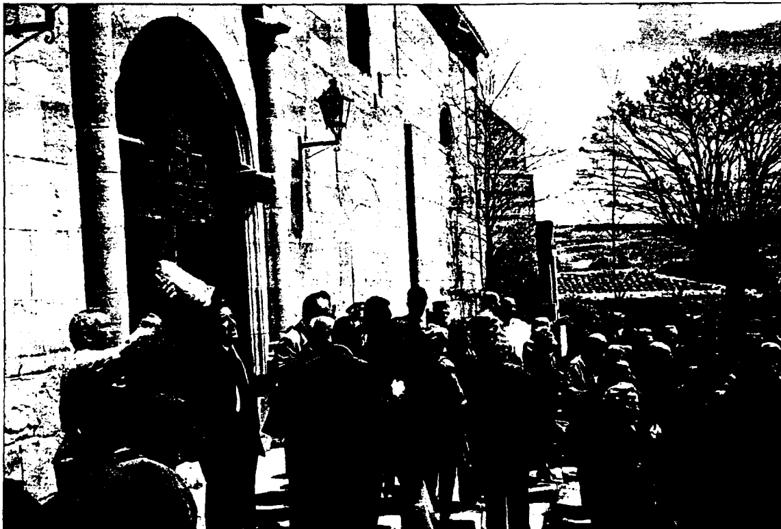
Subasta de los rollos de San Pascual