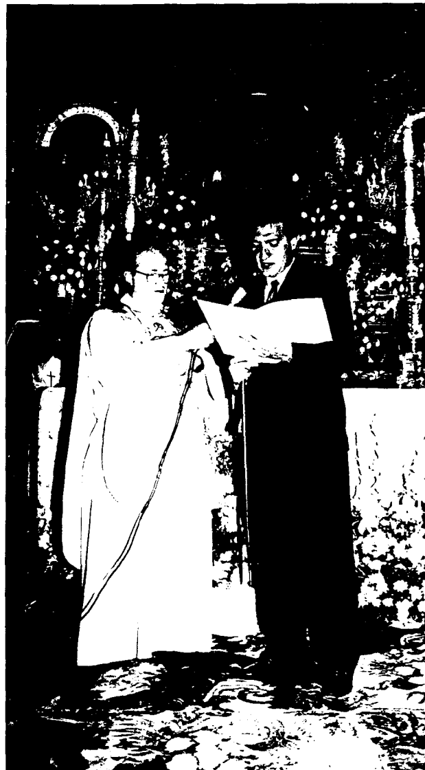
Nombramiento Alcaldesa honor a la Virgen de los Olmos

Fallaron los tres primeros toros por mansear y colarse donde no querían los toreros; los tres segundos cumplieron. Los toreros, matadores de alternativa, no confir-