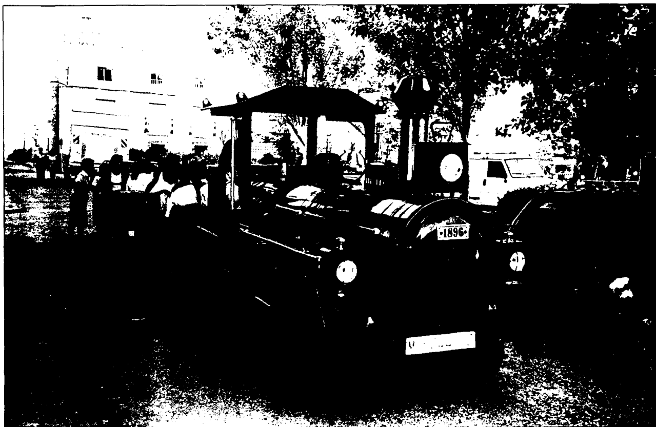
Las Fiestas. Crónica del verano

PROGRAMA (de Fiestas): Conjunto de papelotes muy bien puestos unos detrás de otros donde se indica al crédulo lector las horas a las que son los festejos, e incluso las horas a las que no son (para los que no quieren ir, los demás se enteran igualmente).