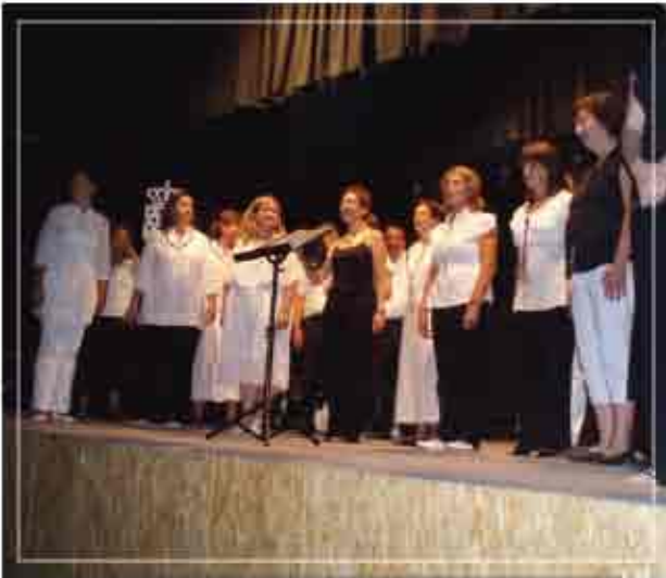
CONCIERTO de la CORAL "LA ESPERANZA" de GUADALAJARA