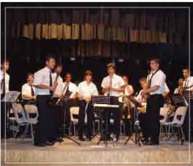
BANDA de MÚSICA de CIFUENTES