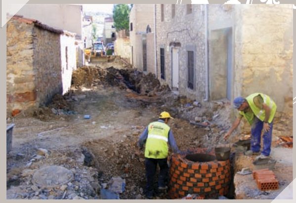
Estación Depuradora de Aguas Residuales

Empadronados en el núcleo urbano de Maranchón (sin incluir barrios) a fecha 11 de octubre: 251 personas