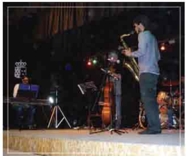
FESTIVAL de JAZZ