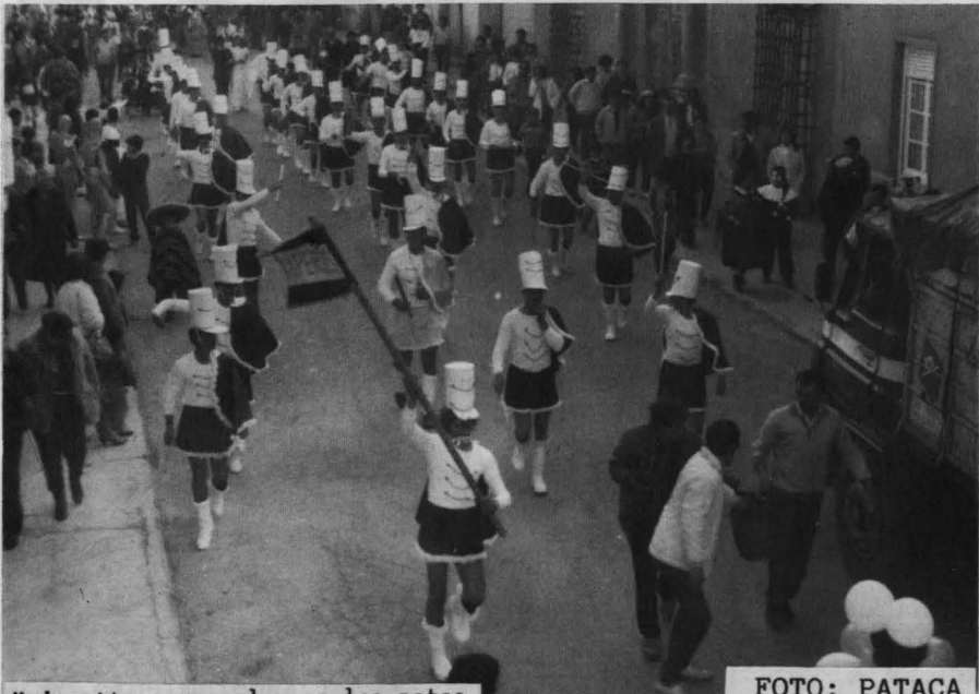
Majorettes con pelos en las patas.