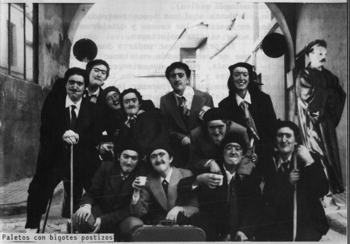
Paletos con bigotes postizos