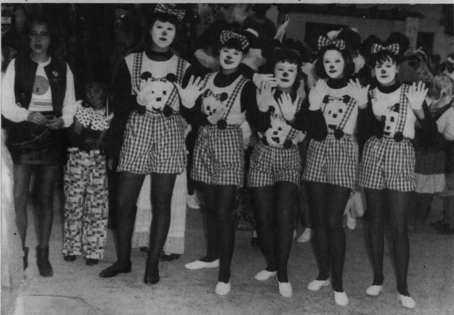
Ratitas sin escoba para barrer su casita.