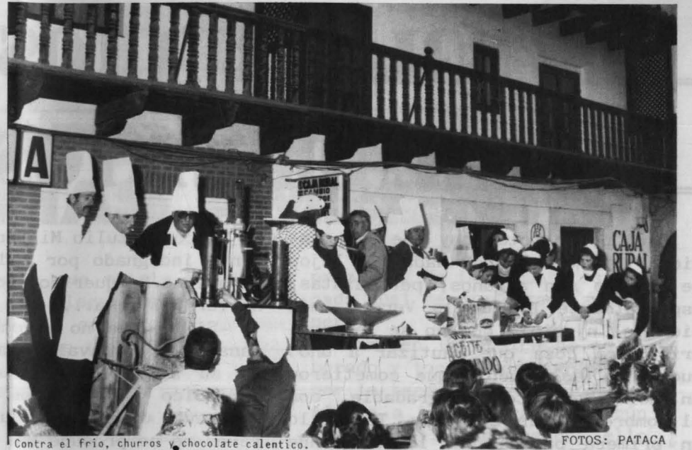
Contra el frío, churros y chocolate calentico.