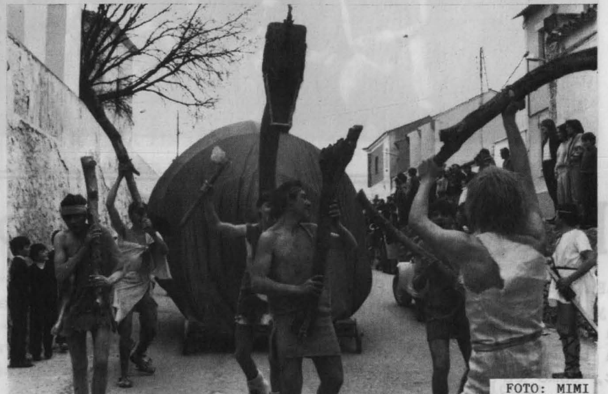
Crecidos los muchachos. ¿Es que habrán tomado colacao?