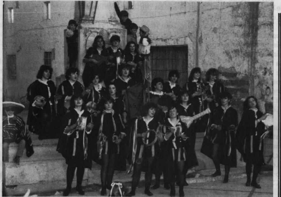
Tunas, que no tunos

Hay que exceptuar a radio Cadena que por primera vez retransmitía en directo la fiesta. No podemos decir lo mismo