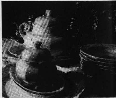
Vajilla Santa Clara de 43 piezas modelo Aranjuez.

Cristal sonoro superior cuya esmerada elaboración garantiza una gran transparencia. Su elegante diseño italiano proporcionará un toque de distinción a cualquier mesa.