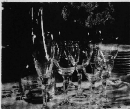
Cristalería Donatello de Bormioli, 49 piezas.

Si la imposición es de 150.000 pesetas, el regalo es una sensacional vajilla de porcelana "Santa Clara" de 43 piezas.