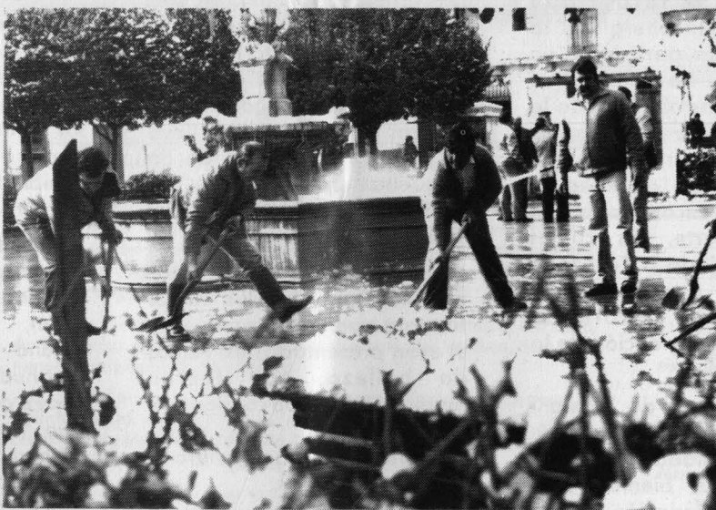
Insólita estampa del Carnaval: Para poder bailar, había que quitar primero, desinteresadamente, el hielo y la nieve.