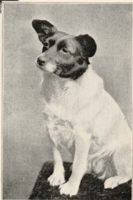
FOTOGRAFÍA HECHA CON LENTE KODAK PARA RETRATO.