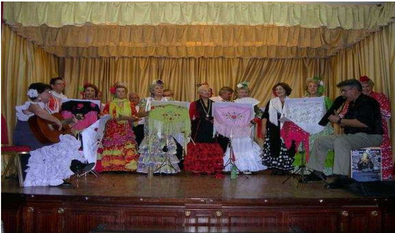
También el Grupo Rociero “Oro Viejo”, trajo aires de Andalucía para alegrar los días invernales de diciembre.