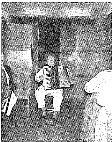
Lourdes, la joven y consagrada acordeonista de Yunquera de Henares, puso broche musical a la LI Tertulia.