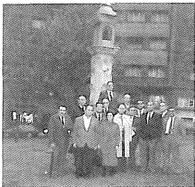
Un año más, los miembros de la nueva Junta Directiva tomaron posesión de sus cargos al pie del Pairón Molinés, erigido en la madrileña calle de María de Molina. El compromiso de trabajar por la Casa y por Guadalajara es firme.