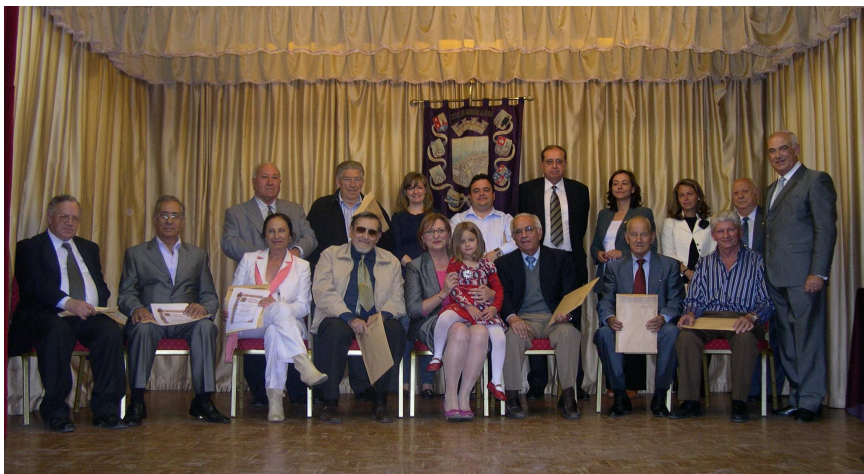
Foto de familia de los socios que en el presente, cumplieron 25 años de fidelidad con la Casa.