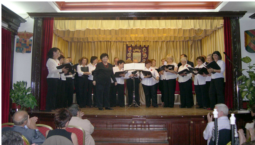
La Coral “Ciudad de Los Periodistas”, puso la nota final a la jornada del 2 de junio, inicio de nuestra conmemoración.