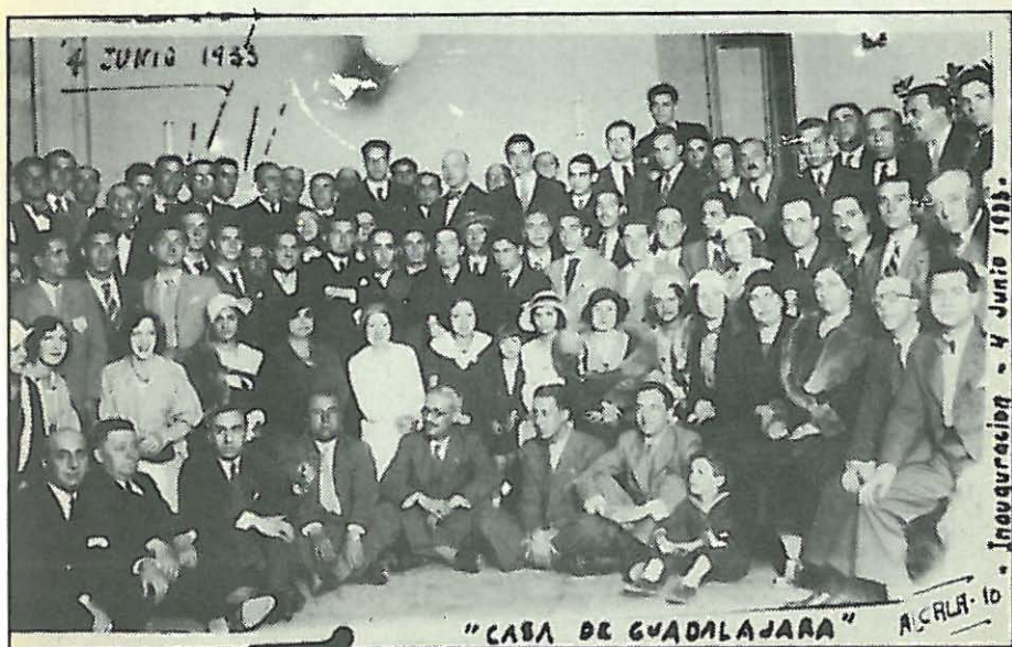
Vino de honor a su Cuadro Artístico, el 29 de junio de 1936.