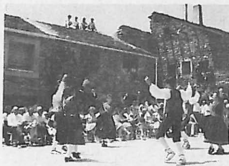
La excursión, pese a momentos de lluvia inoportuna, fue un éxito.