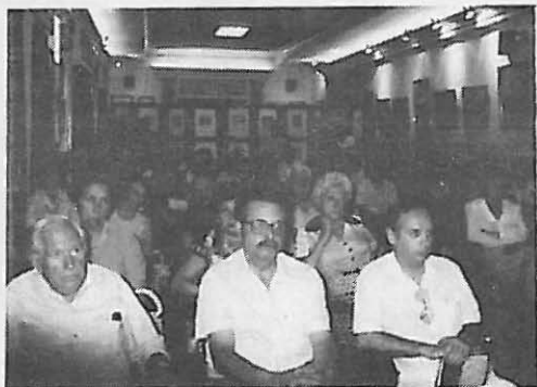
Aspecto del Salón de Actos.

La Asociación "San Ildefonso" presentó en nuestra Casa la obra "Autos, Loas y Sainetes de Valverde de los Arroyos". Con tal motivo, su Presidente recibió el "Melero Alcarreño", que también sería impuesto al Alcalde del pueblo en la excursión de hermanamiento realizada por la Casa a enclave tan singular de la Sierra del Ocejón.