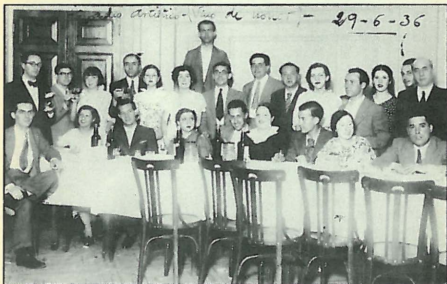
Inauguración de nuestra Casa, en Alcalá, 10, el 4 de junio de 1933.