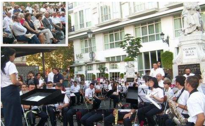
La Banda de Música de Brihuega –hoy en plena juventud y- en honor de nuestros socios, hizo un amplio recorrido por su repertorio musical, con el agrado de los madrileños que llenaron el aforo de la plaza de Santa Ana.