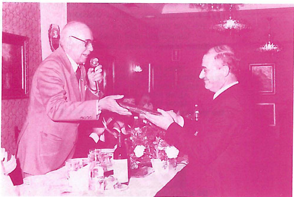
ASVAT con la Casa de Guadalajara en Madrid