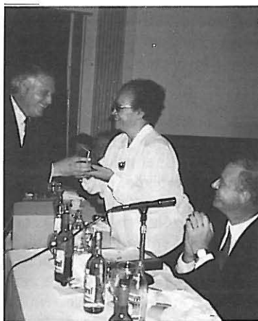
El Presidente de la Fundación “Villa y Corte” y socio de nuestra Casa, asistente a la XLIII Tertulia, entregó a nuestra invitada la Medalla de Plata de dicha Entidad madrileñista.