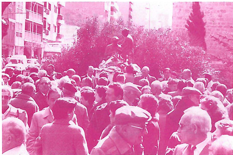
ASVAT con la tercera edad de Guadalajara