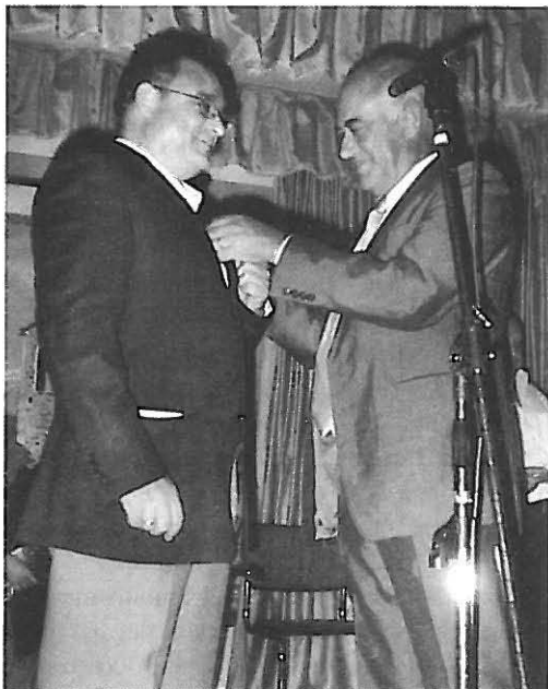
El periodista y amigo recibe el “Melero Alcarreño”

Buero Vallejo o Rodríguez Sahagún, entre tantos otros, cabe destacar que también lo han hecho gentes de Cubillejo, o de