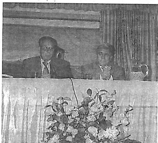
Momento de uno de los múltiples actos que celebra la Casa de Guadalajara.