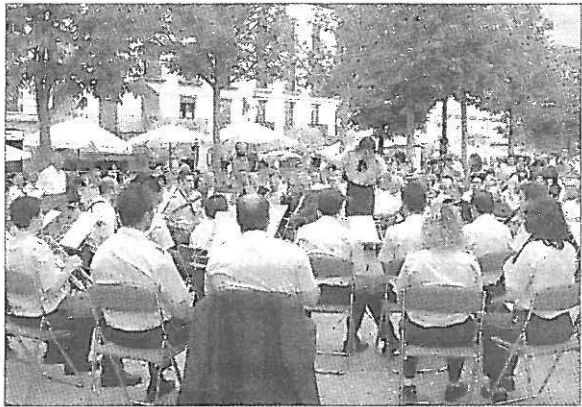
La Banda de Música sigue cosechando éxitos fuera de su feudo. A.G.

La Banda de Música de Brihuega es un colofón de lujo para poner