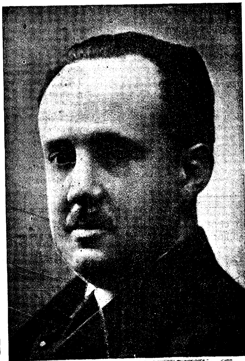
ILMO. SR. D. HIPOLITO JIMENEZ Ex Director General de Prisiones, que presentará su candidatura, en las próximas elecciones a Diputados a Cortes por la provincia de Ciudad Real,

De momento nada tenemos que objetar a referida candidatura, como no sea nuestro sincero y particular aplauso a aquellos que pensando en la provincia, tuvieron la valentía de iniciar la magna cruzada que supone elegir nuestros representantes en Cortes, sin tolerar, más allá de lo que permite la ética política, ingerencias e imposiciones de Comités nacionales, que dentro de la mejor buena fe, no podemos dudarlos, producen a veces fracasos inevitables.