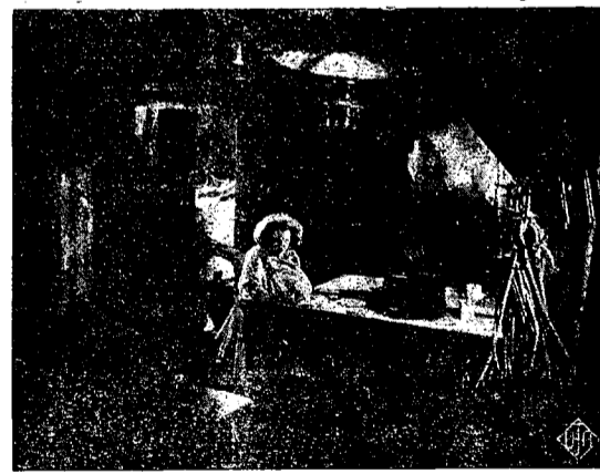
Una escena de la grandiosa superproducción U. F. A.

Esta carrera se organiza bajo los reglamentos de la Unión Velocipédica Española a la cual está adherido el Club organizador. Por lo tanto los corredores participantes deben poseer la licencia correspondiente al año actual.