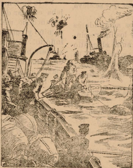
Marinos ingleses quitando minas en aguas de los Dardanelos.