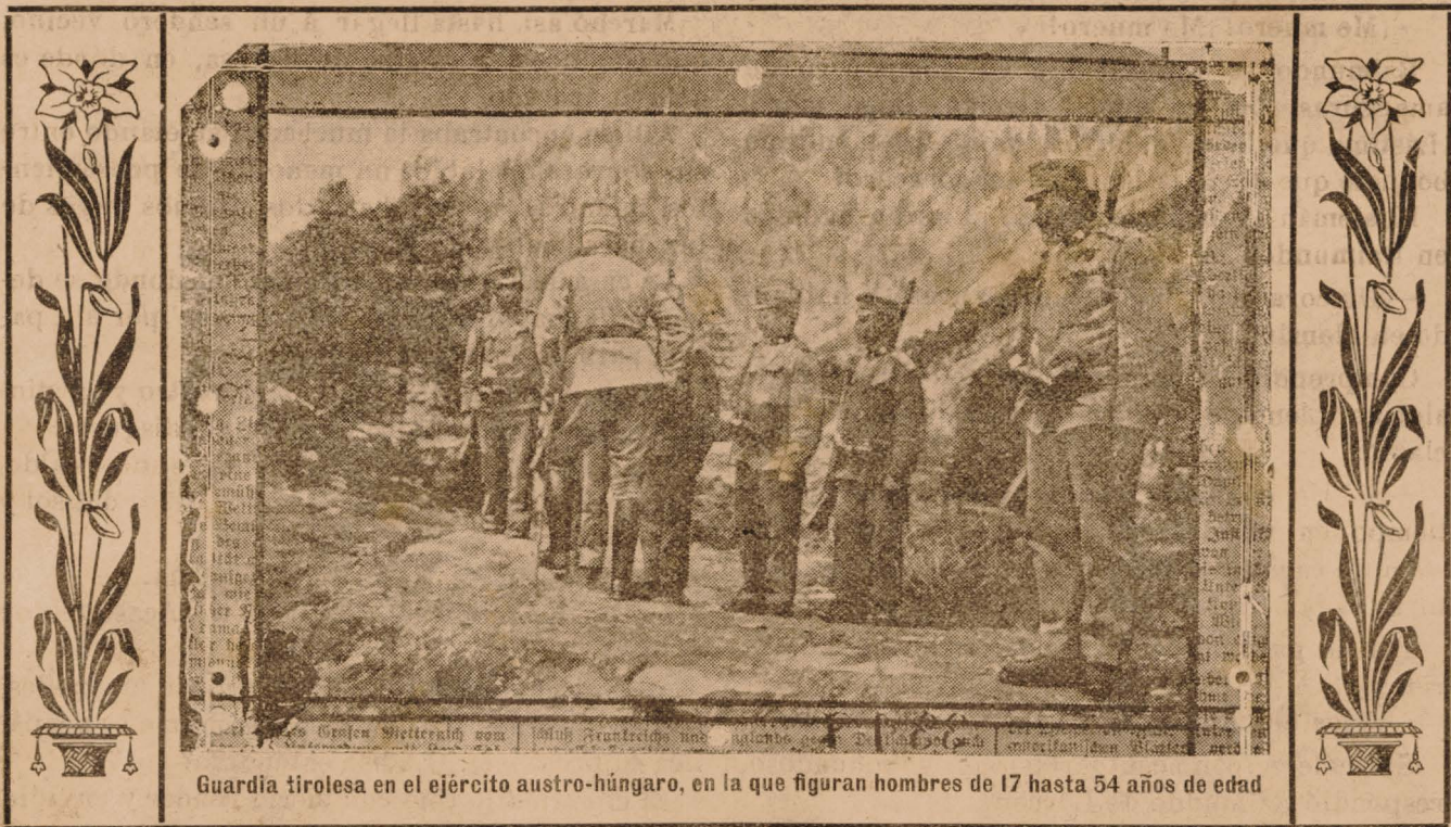
Guardia tirolesa en el ejército austro-húngaro, en la que figuran hombres de 17 hasta 54 años de edad

cuerpo, consiguió abandonar la hondura donde cayó. Miró, febril, en torno suyo. Ni una luz, ni una patrulla salvadora. Continuó arrastrándose y avanzando con angustiosa lentitud entre