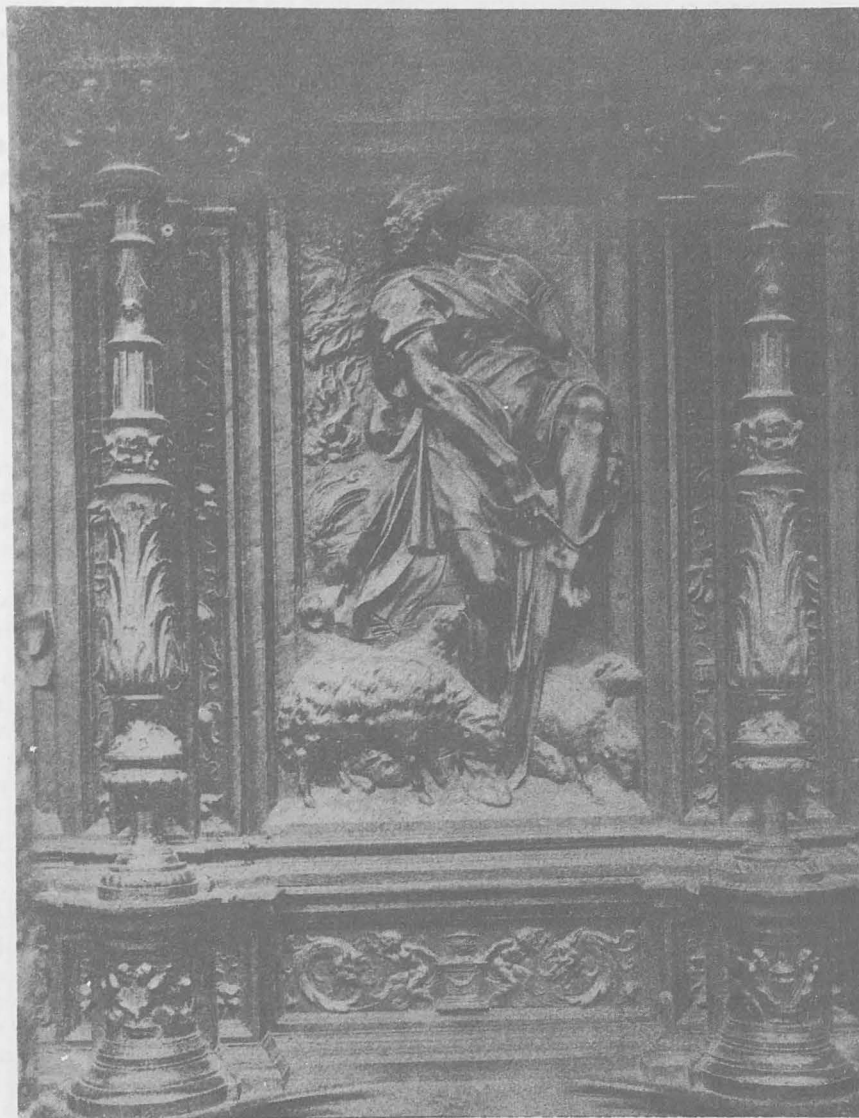
Detalle de la sillería alta del Coro de la Catedral

viloso secreto, en virtud del cual se nota en aquéllas la dureza combinada con la elasticidad, la fortaleza con la finura, la suavidad con la resistencia, el temple sin igual con el pulido ó acicalado más brillante, la tenacidad y duración, por último, con las más delicadas formas.