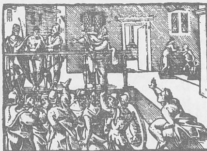
AL ECCE HOMO