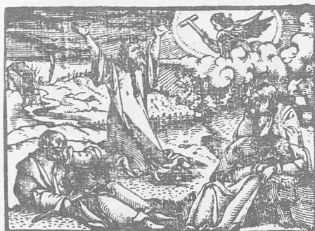
A LA ORACION DEL HUERTO (1)