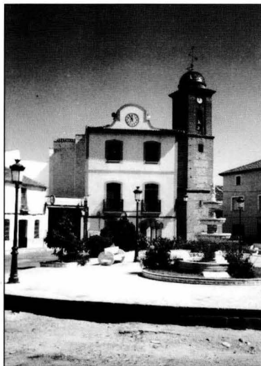
Plaza de Belvís de La Jara, con la fachada renovada del Ayuntamiento, en segundo término la torre de campanas con la media naranja de azulejos (Foto de Martín Recio).