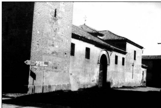
Fachada meridional de la iglesia, antes de la restauración.