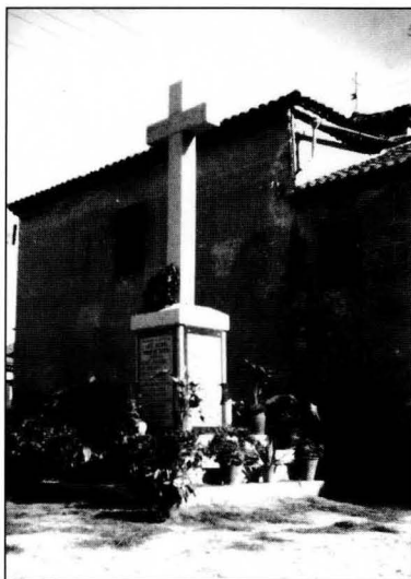
Cruz de los Caídos y en segundo término la fachada nortiza de la iglesia.