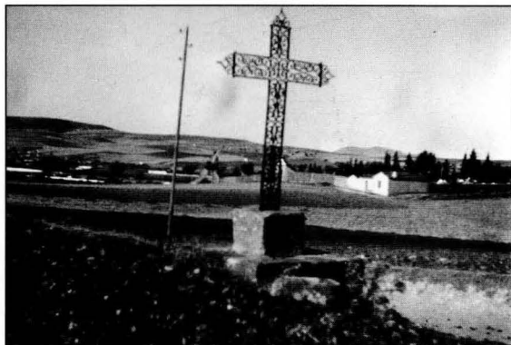
Moderna Cruz de Hierro. En segundo plano el cementerio.