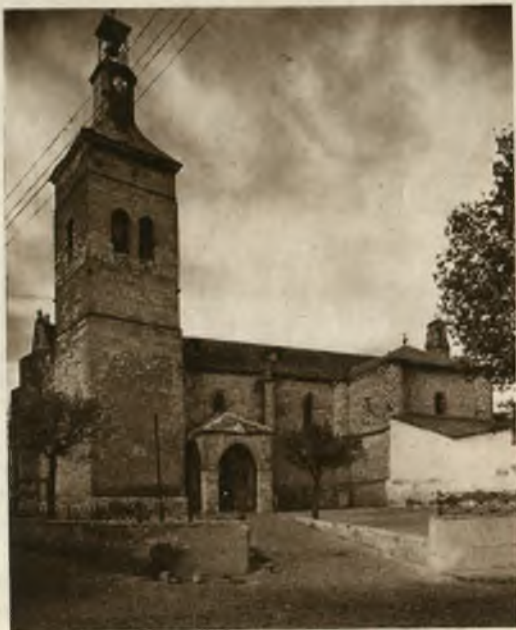
Iglesia de San Pedro

Uno de los monumentos más interesantes de la población es la Puerta de Toledo , precioso resto de la arquitectura militar del siglo XIV, emplazada al final de la calle de Toledo, que es el principio del antiguo camino que conduce a la imperial ciudad. Está declarada monumento nacional, y se compone de seis arcos de variada forma, flanqueados por dos fuertes torreones de planta rectangular; debió estar coronada de almenas con sus correspondientes parapetos, aunque hoy se encuentra ruinosa en la parte superior. Los dos arcos extremos son de estilo ojival, los medianeros de los llamados de herradura, del primer periodo de la