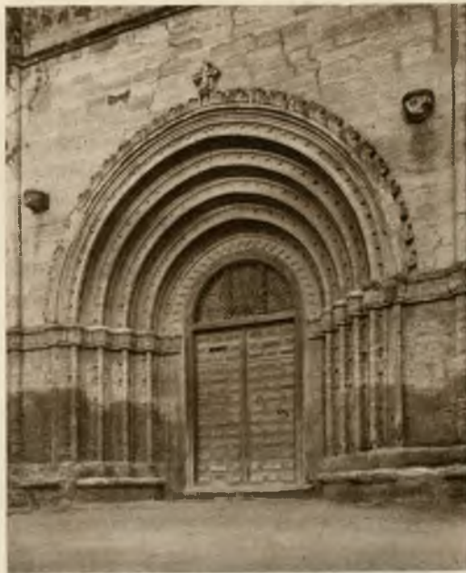
San Pedro. Puerta lateral