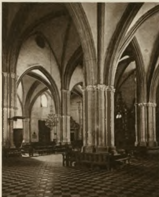
Interior de San Pedro

La Diputación, instalada en el mejor edificio de la ciudad, posee una biblioteca y pinacoteca provinciales,