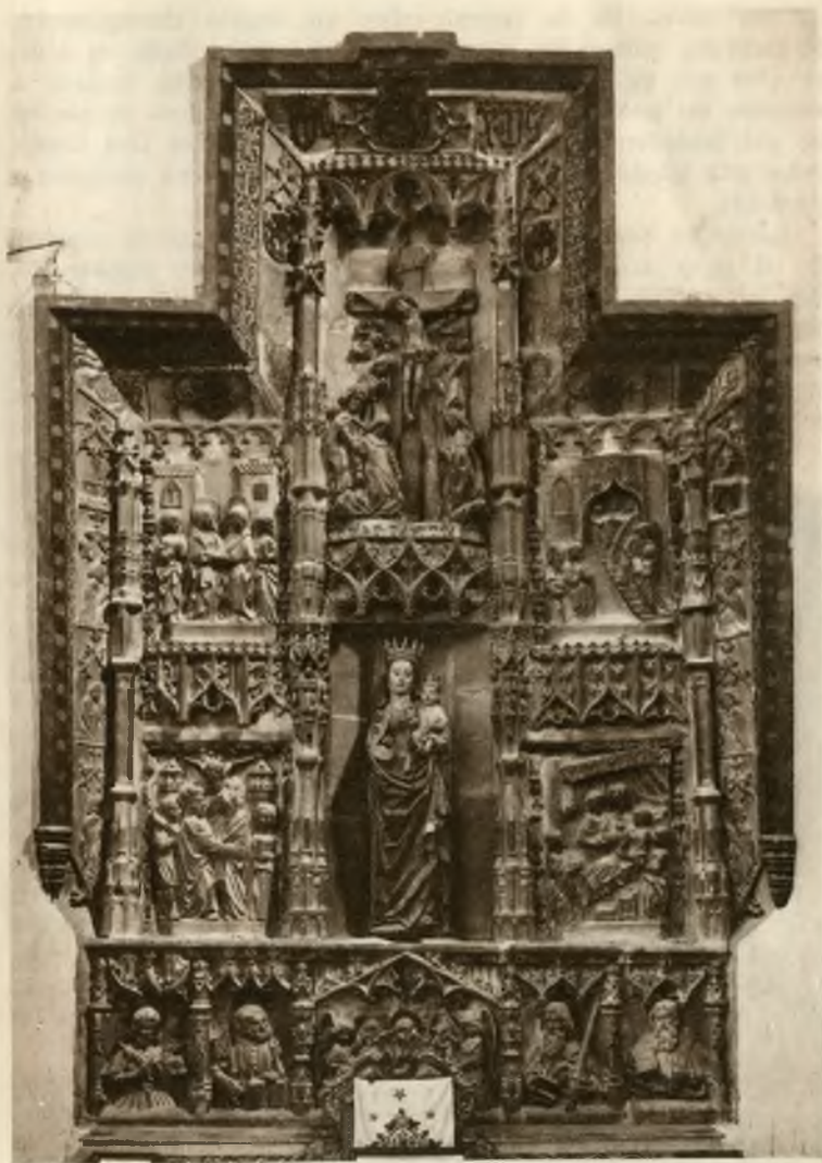
Retablo gótico de San Pedro