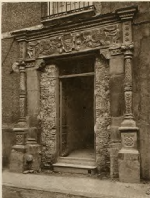
Una casa renaciente

A Calatrava la Nueva (43 kms.), donde se encuentra el famoso Sacro Convento y vestigios del Castillo de Salvatierra; a Alarcos (8 kms.), lugar de la famosa batalla, donde sobre un montículo se eleva el histórico Santuario; a Almagro (26 kms.), una de las ciudades más interesantes de la provincia, rica en casas solariegas, adornadas con magníficos escudos, una plaza típicamente española, de las más bellas de la península, y el Convento de los Dominicos, notable por su claustro e interiores.