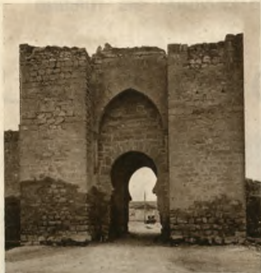
Puerta de Toledo