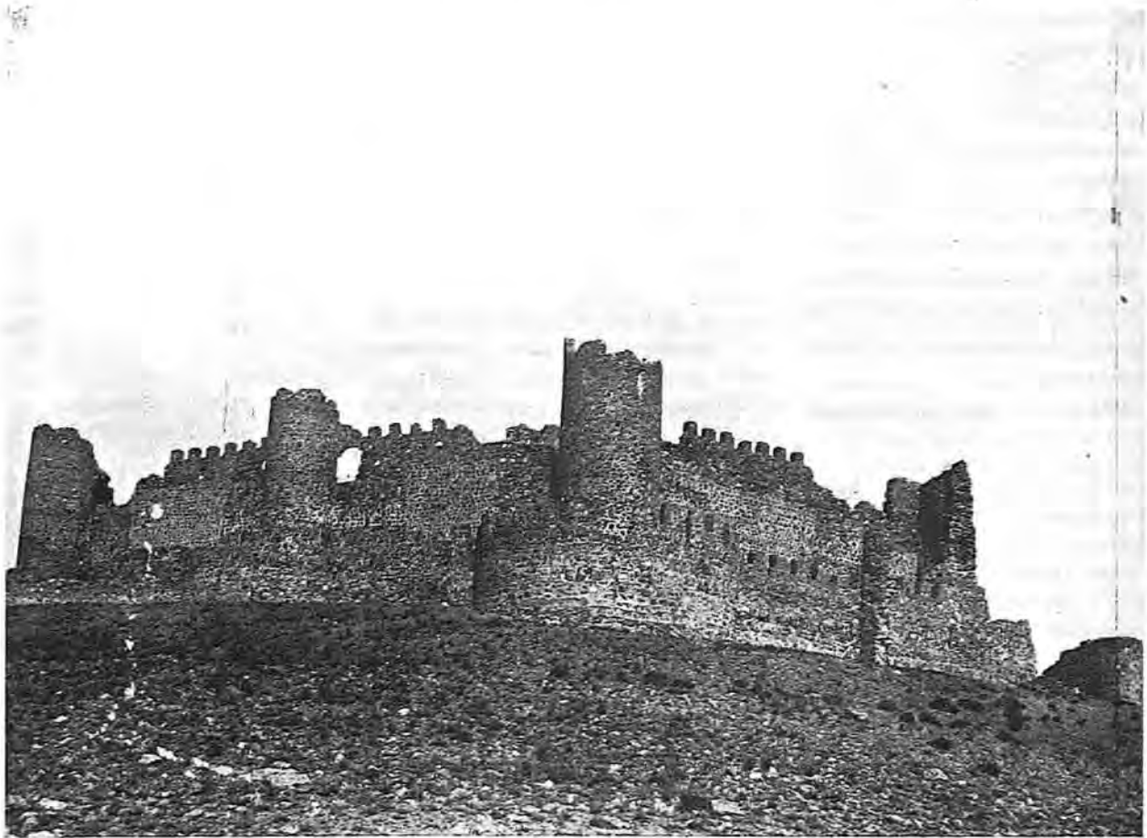
Castiilo de Almonacid

monarca. Como éste aspiraba a la corona lusitana, por haber muerto sin sucesión, en 1383, el rey Fernando I, quiso evitar que el infante de referencia pudiera pro-