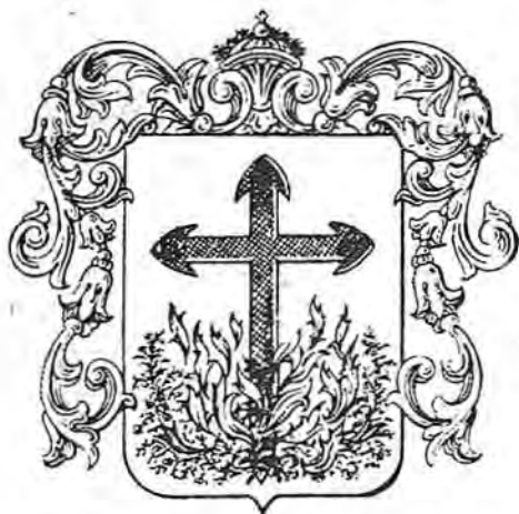
SANTA CRUZ DE LA ZARZA