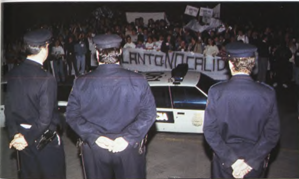
Las fuerzas de la Policía Nacional estuvieron dispuestas, aunque afortunadamente no tuvieron que intervenir en ningún momento.