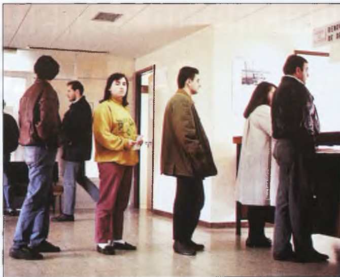
Ciudad Real y Puertollano son las comarcas con mayor paro. El sector servicios e industria arrojan numerosos desempleados

esquilarlas... "Nunca he podido estar de brazos cruzados".