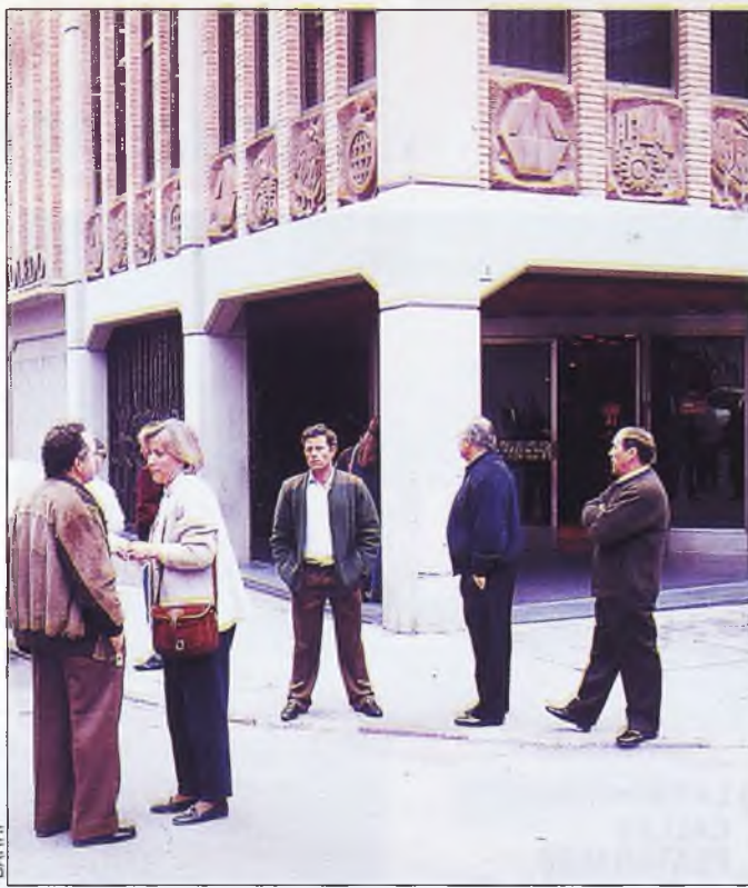
La candidatura socialista y la popular estuvieron muy reñidas en la provincia de Toledo. En la imagen, varios votantes a la puerta de la sede de la calle Ocaña.

"Lo mejor de estos resultados es que la Caja deja de ser un grupo homogéneo y monocolor y ahora se introduce gente con un halo de inde-