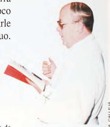
El párroco de Bolaños opina que la historia es intrascendente