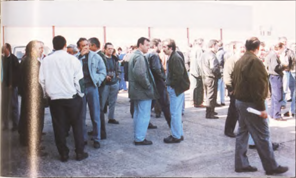
De los 284 trabajadores de Manzanares Suzuki plantea una reducción del 40 por ciento.

La administración central y las autonómicas de Andalucía y Castilla La Mancha deberán aportar una cantidad económica aún sin determinar.