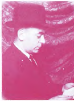
La Bañeza, Enero de 1994

CONVOCATORIA SEXTA EDICIÓN PREMIO NACIONAL DE POESÍA « Conrado Blanco León »