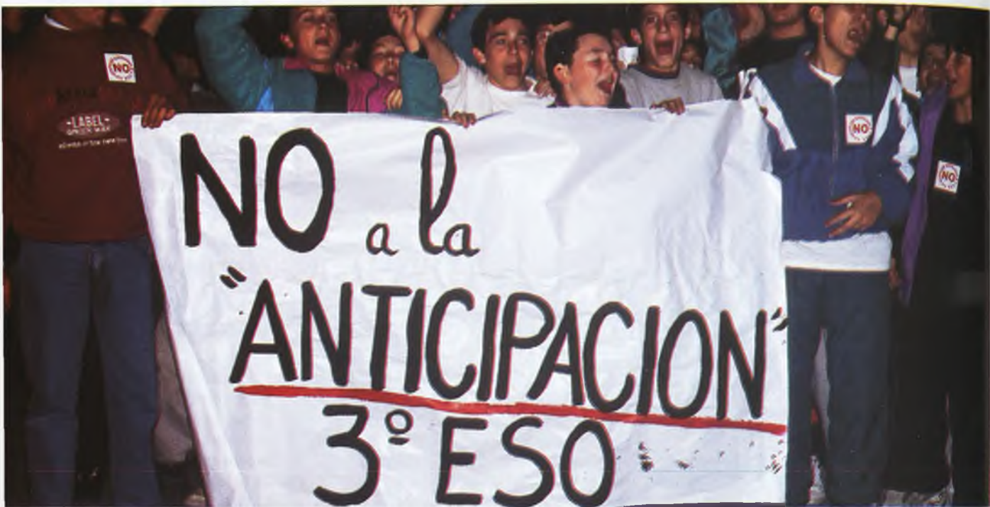
A los jóvenes, la protesta les permitió exteriorizar ruidosamente su oposición

E n medio de una absoluta normalidad, pero también de una inquebrantable contundencia, cerca de cuatro mil personas se echaron a la calle en Ciudad Real , para pedir la paralización de la aplicación anticipada de la Enseñanza Secundaria Obligatoria -ESO- . Entre los manifestantes, padres de familia, profesores, niños, amas de casa, jóvenes estudiantes y políticos de la oposición,