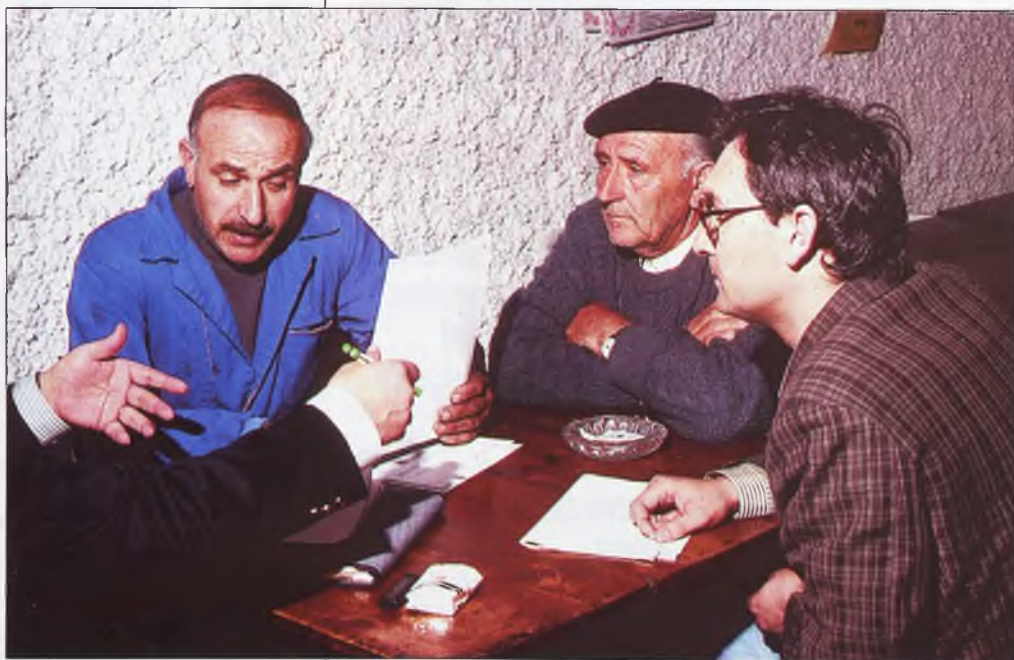
La junta directiva de los nazarenos están que trinan contra el párroco