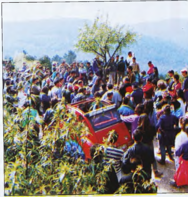
A la marcha acudieron 400 personas de toda la provincia, Córdoba y Madrid. Algunos acamparon todo el fin de semana.

fuerte presión sobre la vegetación, "impidiendo en determinadas zonas una regeneración adecuada de la misma". "Se persigue, aseguran, la total extinción de cualquier especie que se alimente en mayor o menor grado de especies cinegéticas", algunas de ellas en peligro de extinción, como el lince, el lobo, el meloncillo, el águila imperial, el buitre negro o el halcón peregrino que entre otras especies amenazadas pueden encontrarse en la finca, a la que por cierto el Rey ha acudido más de una vez a cazar.