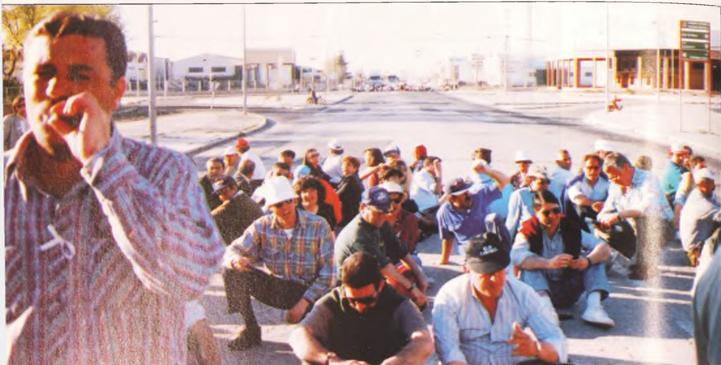
Suzuki ha anunciado la rescisión de 93 contratos en Manzanares. Los trabajadores han protestado. En la fotografía un momento del corte de la N-IV

S uzuki se ha mostrado inflexible en sus exigencias para lograr la viabilidad de la empresa en sus factorías españolas, entre ellas la de Manzanares. Quiere reducir la plantilla en cerca de tres mil empleados en todo el país, de ellos casi cien de Manzanares. Además exigen congelación salarial y aumento de la productividad. Los trabajadores también se muestran inflexibles.