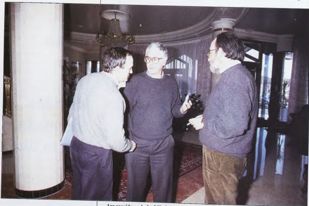
Los seguidores de José María Barreda triunfaron en las Asambleas de las mayores poblaciones de la provincia