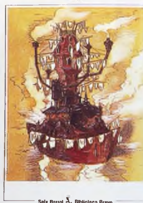
Portada de la obra, editada por Seix Barral, por cortesía de Librería LITEC de Ciudad Real

fácil de ver en cada valdepeñero, es perfectamente compatible con la expectación que cada uno de sus actos, cada una de sus obras, despierta.