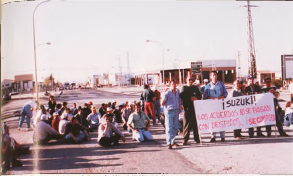
Los trabajadores de Manzanares aceptaron el año pasado el Plan de Viabilidad de la empresa y las regulaciones de empleo. Ya no aceptan más.