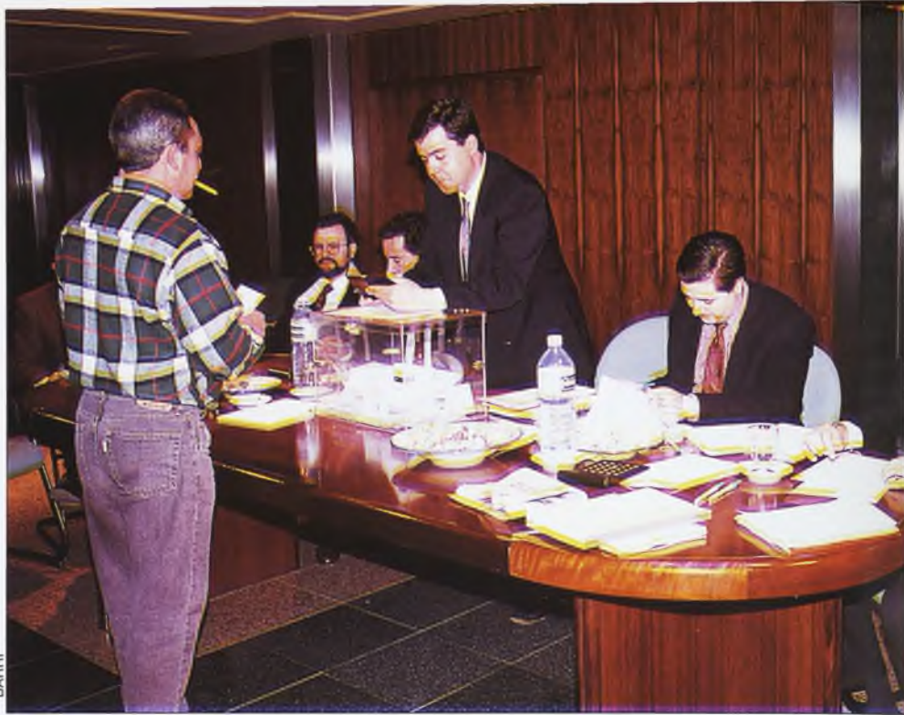
En Toledo la participación llegó al sesenta y siete por ciento. Votaron 202 de los 300 impositores.

E l PP tiene ya asegurados treinta y nueve miembros en la asamblea general de la Caja de Castilla La Mancha y cuatro en el Consejo de Administración. Las elecciones de impositores del pasado fin de semana arrojaron unos resultados igualados. Los sindicatos se frotan las manos pensando en su potencial papel de bisagra.