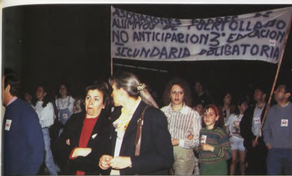
El acto de repulsa contra el adelanto de la ESO, transcurrió con toda normalidad