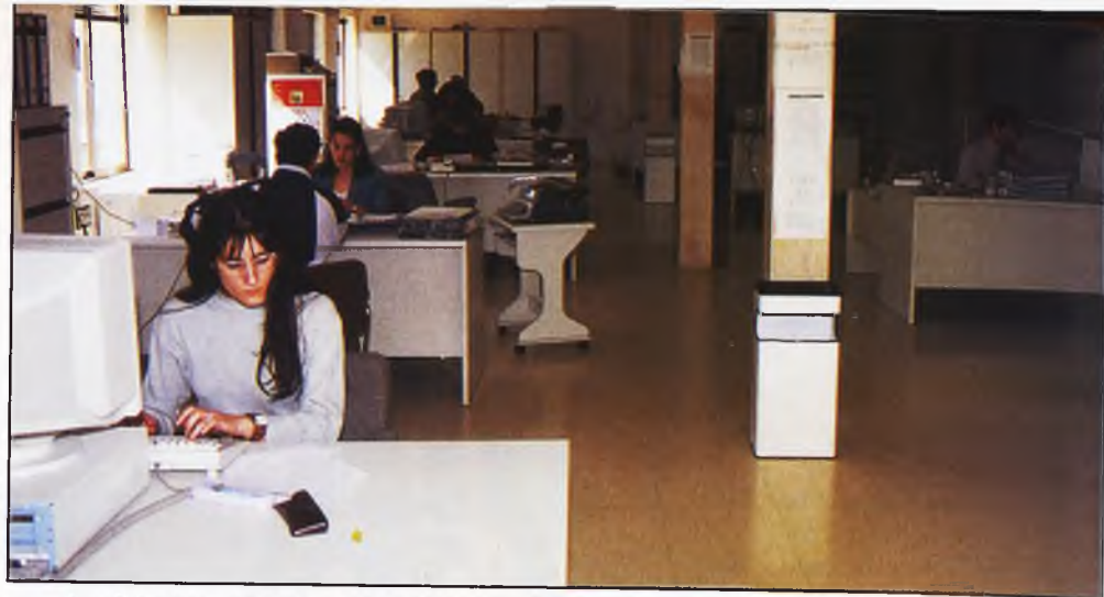
Los más de trescientos trabajadores del Consistorio alcazareño llevan varios meses sufriendo retrasos en el cobro de sus nóminas.

ALMADEN, ALCAZAR, PEDRO MUÑOZ Y SOCUÉLLAMOS PAGAN CON RETRASO