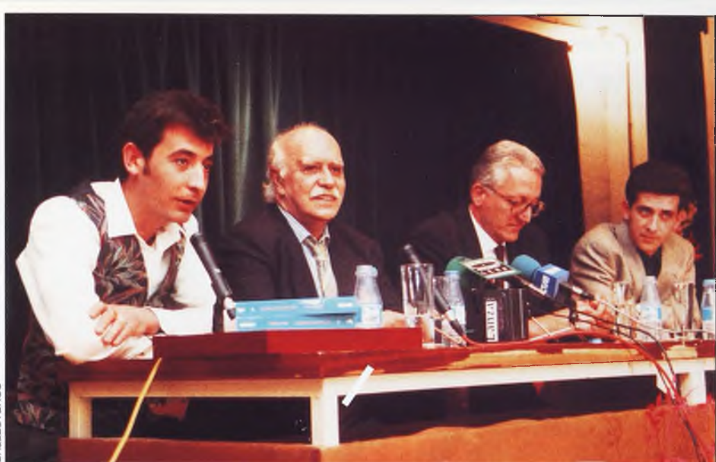
El acto de presentación de la novela en Valdepeñas, constituyó todo un récord de asistencia de público

EL AUTOR PRESENTO LA OBRA EN VALDEPEÑAS, SU PUEBLO NATAL