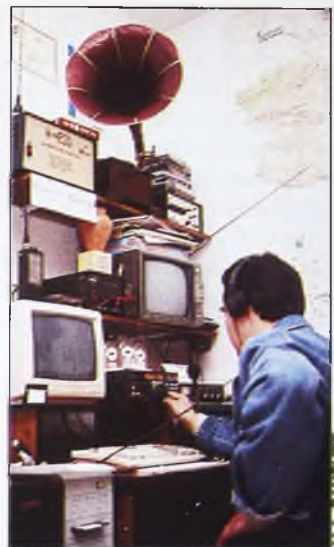
Un radioaficionado en su "cuarto de Chispas" donde pasa gran parte del tiempo libre.

Este afán, esta búsqueda interminable de nuevos canales de comunicaciones alrededor de todo el planeta hace que los radioaficionados tengan, necesariamente, una peculiar personalidad. Son inquietos, dinámicos,