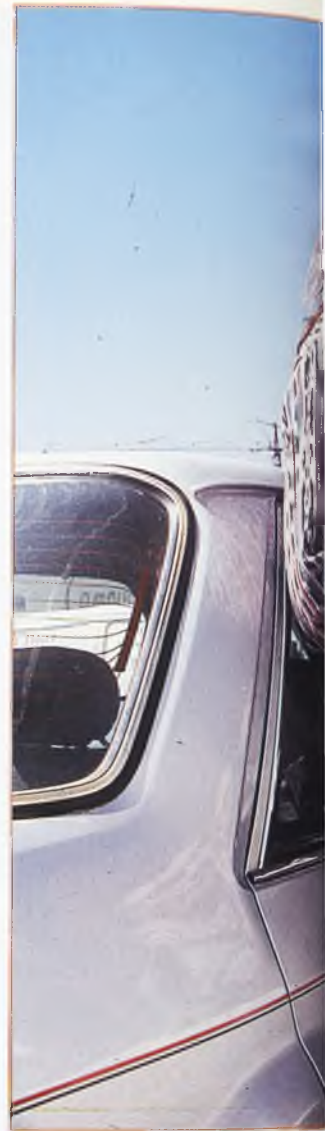
El "plumas", un tipo de Calzada de Calatrava

estilo de vida de una juventud tolerante con hábitos, modos y modas que empiezan a ser aceptados con naturalidad por el resto de la ciudadanía. Hoy ya son pocos los que vuelven la cabeza cuando ven pasar a un joven con el pelo extremadamente largo. Pero no siempre ha sido así. La aversión de buena parte de la sociedad hacia las tendencias estéticas más heterodoxas ha sido uno de los estímulos que les ha impulsado a los jóvenes más inconformistas a romper esquemas, transformar su imagen y arriesgarse al cambio. En estos términos se explica Paco Alba conocido en su círculo de amigos por "pacote" quien reconoce que "no es lógico, en principio que los chicos nos dejemos el pelo lar-