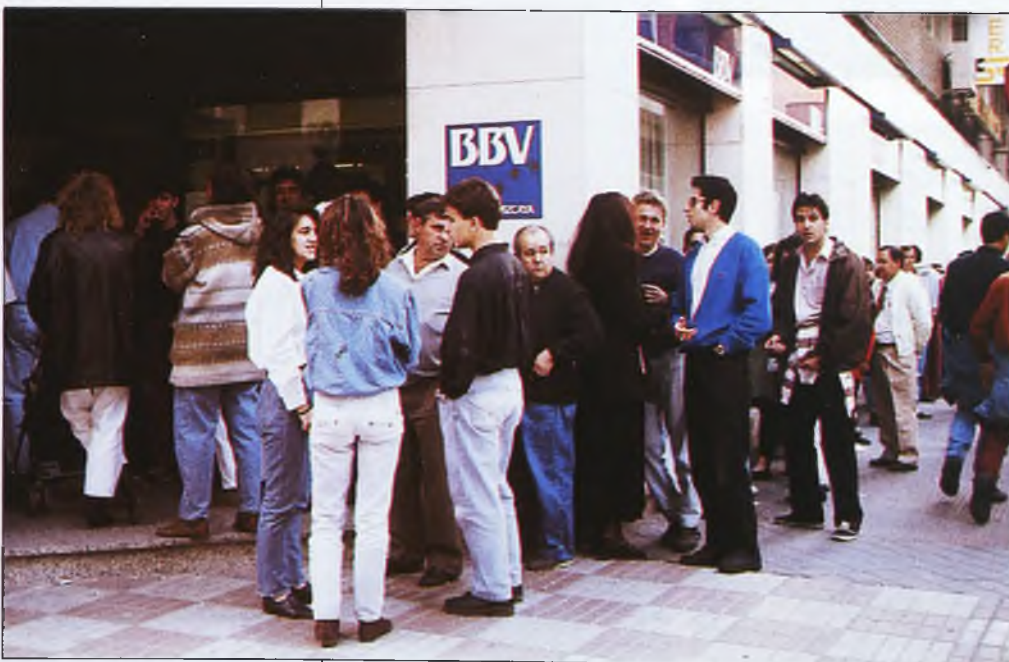
Algo más de 29.000 personas son perceptores del subsidio del desempleo. En la fotografía un grupo de parados aguardan para cobrar

Para agravar aún más la situación económica Cecilio aún