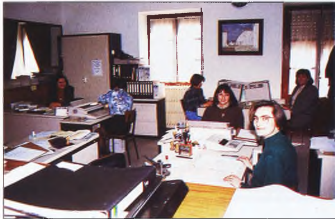
Los trabajadores del ayuntamiento de Pedro Muñoz cobran a mediados de mes.