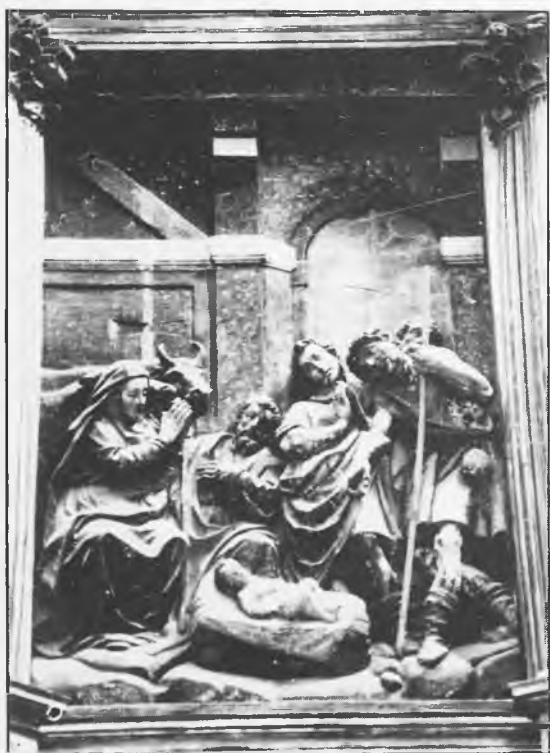
Adoración de los pastores. (Siglo XVII), obra de Giraldo de Merlo

El retablo del Altar Mayor de la Catedral de Sigüenza está exornado con tallas policromas perfectamente trabajadas, obra renacentista de Giraldo de Merlo (1609), de quien dice Cean Bermúdez: "...que sus obras le acreditan por uno de los mejores profesores que había en España en su tiempo".