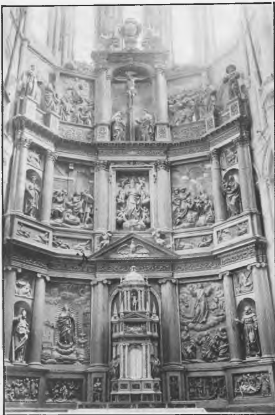
Vista general del retablo

En el número 2 de “Abside” y en su portada, aparece el retablo del Altar Mayor de nuestra Catedral. Se divisa tras la gran reja que Domingo Zalceta construyó pocos años después de que Giraldo de Merlo terminara el nuevo retablo. Esta fotografía, tan sugerente y tan lograda por Domech, nos ha inducido a traer hoy a esta página de divulgación nuestro retablo mayor con el fin de destacar su grandiosidad y perfección artística y, sobre todo, para manifestar lo reconfortante que resultan sus imágenes a los ojos del pueblo creyente: