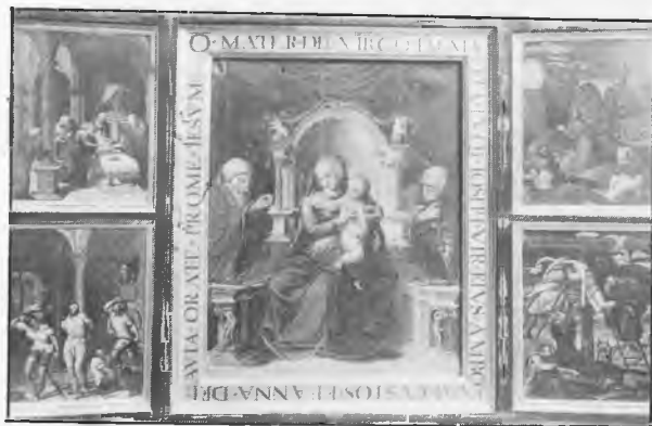
Sagrada Familia y Santa Ana. Siglo XVI

¿Qué pintor realista de la escuela moderna hubiera acertado a copiar la tierna figurita de un infante con tanta exactitud fisiológica como la venerable escuela flamenca lo hizo allá por la primera mitad del siglo XVI? En este admirable cuadro, todo sencillez y candor, María aparece como una doncella italiana. Hay en todo ello grandiosidad ingenua a la vez que simplicidad infantil y una conciencia artística que pasman.