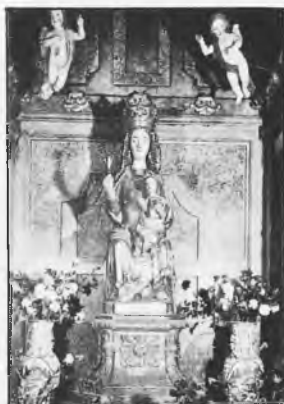
Ntra. Sra. la Virgen de la Mayor Patrona de Sigüenza