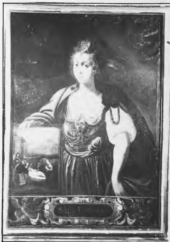
Sibila Erithrea; El Nacimiento del Salvador. Siglo XIX

Aun cuando el cuadro no tenga sino cincuenta o sesenta años menos que el anterior, ¿qué lejos nos hayamos ya de éste, de su alma de azucena, de su infantil imaginación?