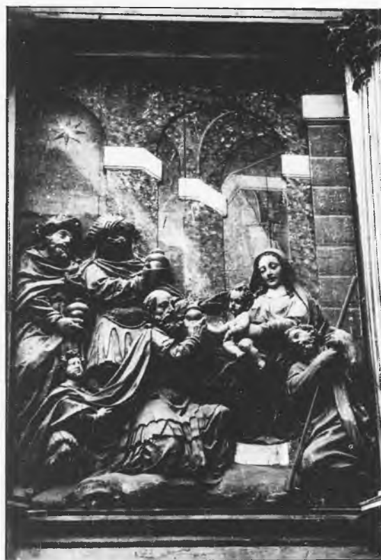
Adoración de los Reyes Magos. (S. XVII), obra de Giraldo de Merlo

En el segundo cuerpo del retablo se destacan los altos relieves policromados (estofado y encarnado) que representan la Adoración de los Pastores y de los Reyes Magos , a izquierda y derecha, respectivamente.