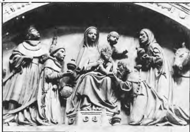
Adoración de los Reyes Magos (Siglo XVI)

“A LA GLORIA DE DIOS Y DE LA PURISIMA VIRGEN SU MADRE Y DE LOS REYES MAGOS,