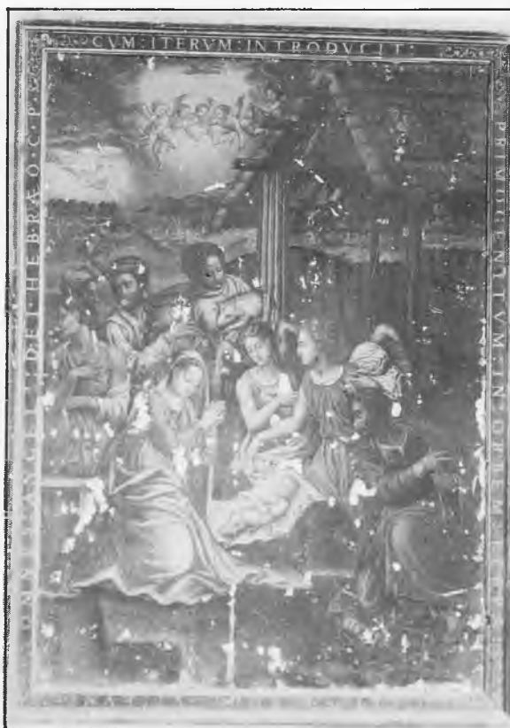
Adoración de los pastores. Siglo XVI

1.— Veamos, primeramente, el Niño Jesús que figura en el cuadro del altar, que ocupa el lado izquierdo del muro frontero a la puerta de entrada, en la Capilla llamada de Santiago el Zebedeo , o de los Mora o de los Gamboa .