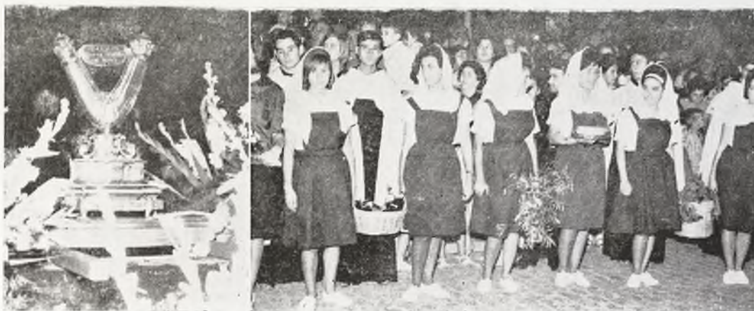
La reliquia de Santa Teresa en su urna, y la Sección Femenina haciendo la ofrenda