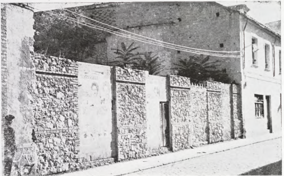
En la calle de Postas, y también con mucha veteranía, se halla este solar sobre el que podría edificarse un inmueble moderno y bien céntrico. Animo, constructores.

blemas como el que comentamos, la situación económica de las mismas hace que no siempre pueda atacarse a fondo y haya que contentarse con soluciones parciales, que no pueden ir al ritmo deseado y que por tanto, hace que la urbanización de calles en el aspecto de edificaciones modernas vaya despacio, en contraste con lo que hemos podido comprobar en otras capitales.