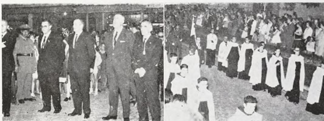
La Junta del Colegio de Abogados, y novicios de la orden carmelitana