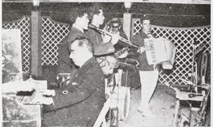
Un momento del desfile de modelos celebrado en el recinto de la fuente talaverana durante una de las verbenas. Abajo, el Presidente de la Comisión de Festejos, al piano, colaborando con la orquesta.