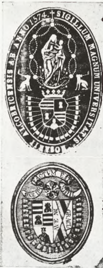
Sellos de la antigua Universidad de la ciudad de Almagro.

cidad para 50 lectores, estando distribuidos los fondos para niños mayores y para los más pequeños en distintos tamaños y coloridos. La Biblioteca está suscrita a treinta revistas.