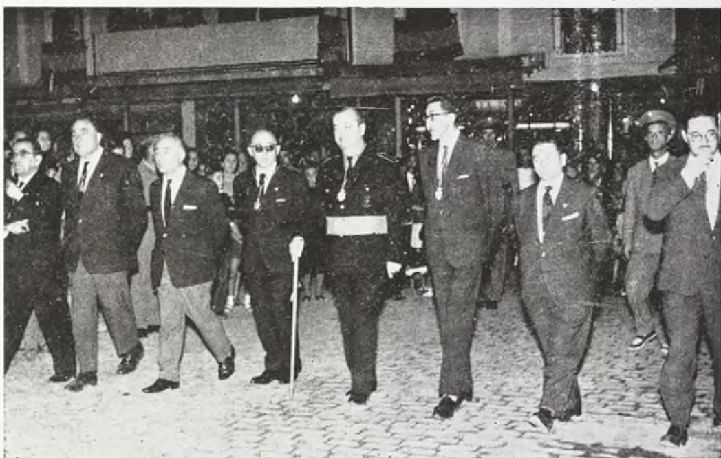
La Corporación municipal presidiendo la procesión a la Catedral