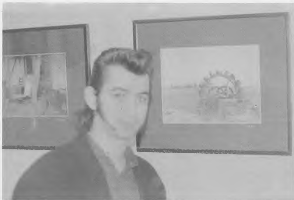
Río Rojo junto a las fotografías