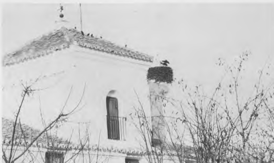
Las cigüeñas mucho antes que otros años, desde navidad que llegó el macho y luego a los pocos días la hembra han asentado en su nido