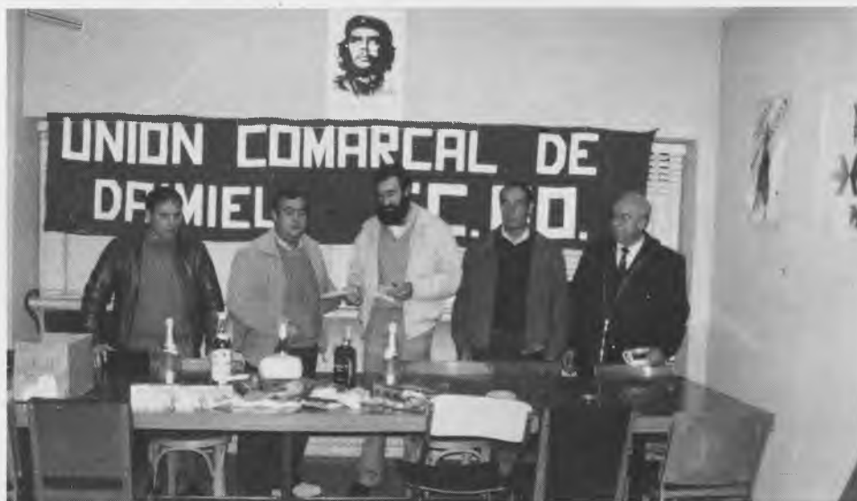
En el centro el Presidente de la Unión Comarcal de CC.OO junto a otros compañeros.