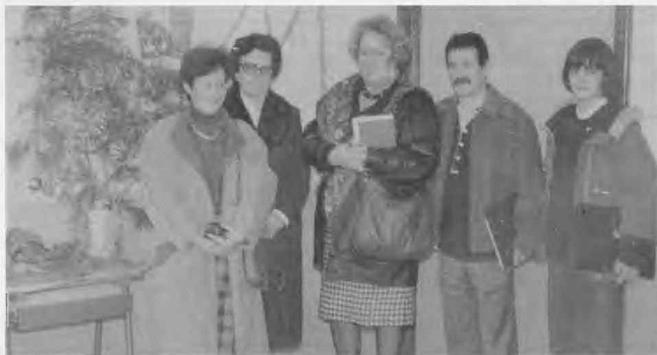
Jurado Calificador de los Belenes