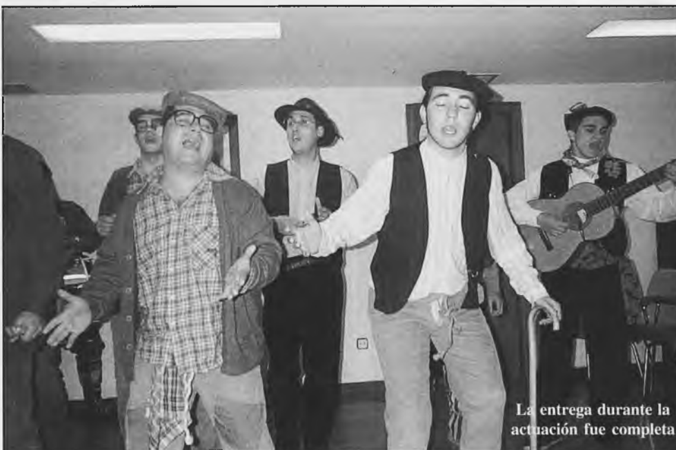
La entrega durante la actuación fue completa