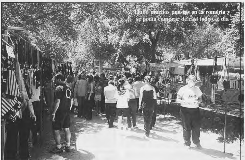
Hubo muchos puestos en la romería y se podía comprar de casi todo ese día