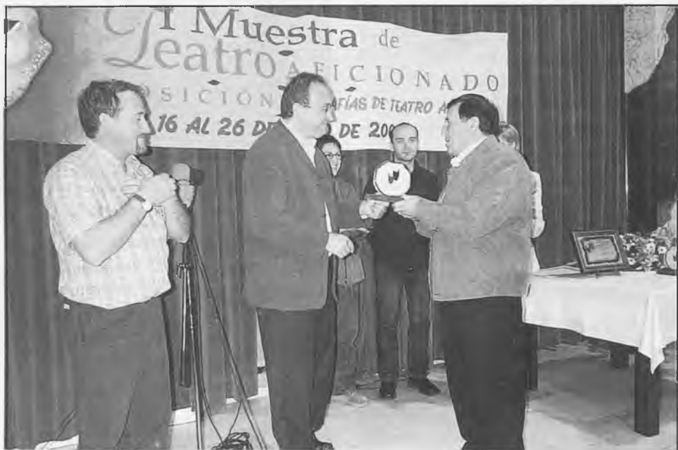
Se ha celebrado la I Muestra de Teatro Aficionado en Daimiel