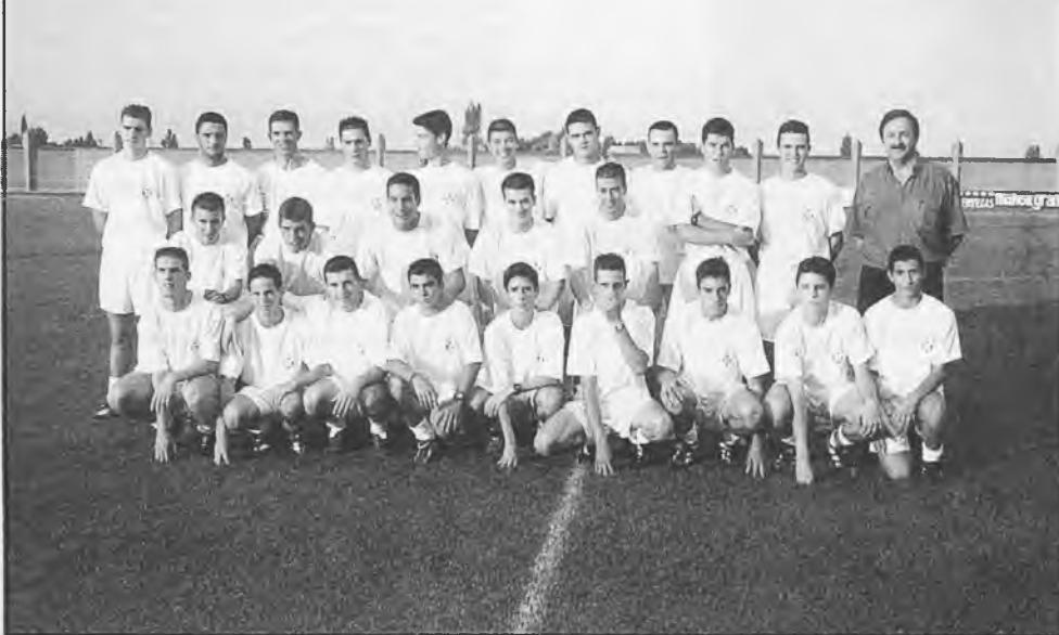
El Daimiel Juvenil, logra subir de categoría al derrotar a su rival en la liguilla de ascenso