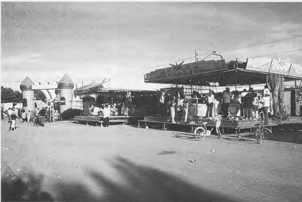
En la verbena de San Isidro, se instaló una miniferia para el disfrute de los más pequeños