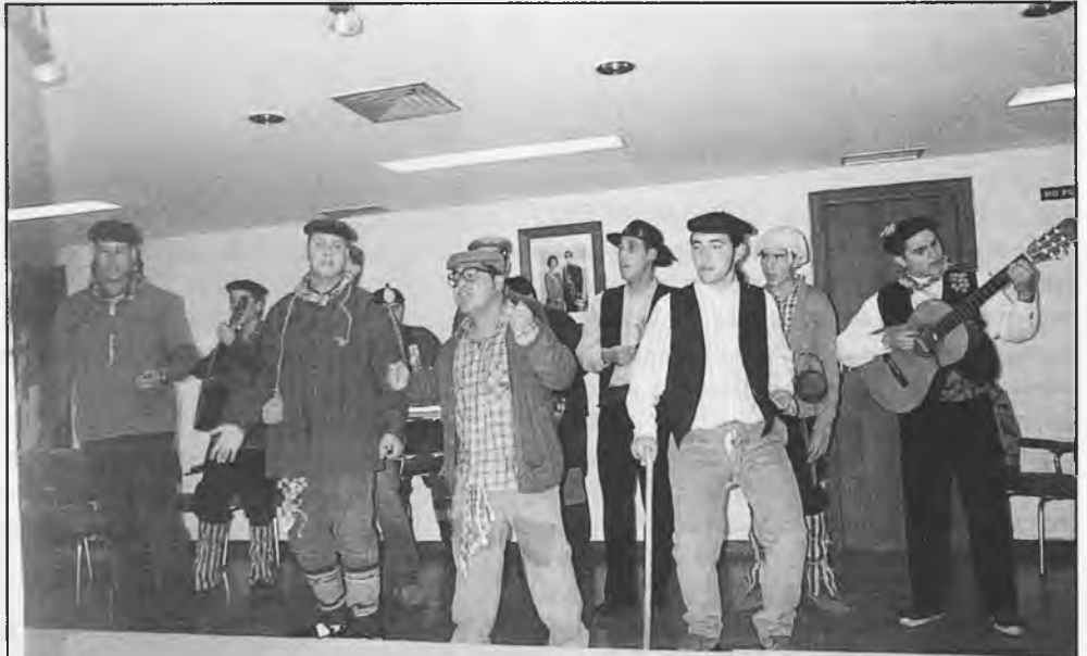
En "El Culo de la Manola" llevan desde 1994 desarrollando una gran actividad cultural

Unas pocas letrillas, ilusión y amistad, hicieron que los primeros componentes se unieran y participaran en la Muestra de Murgas y Chirigotas del año 1994 en Daimiel. Aquella muestra, celebrada en la Carpa de Carnaval instalada en lo que hoy es el Centro de Mayores de la Plaza María Cristina, supuso el comienzo de innumerables actuaciones en concursos, actos culturales y organización de otros eventos como excursiones, presencia y participación en Ferias, Fiestas, Festival Infantil Pequeños Artistas, etc. Todo ello, un poco sin darnos cuenta, nos ha hecho crecer musical y culturalmente. También todos estos años, han servido para madurar nuestro objetivo primordial que no es otro que la amistad entre nosotros y las personas que nos rodean. Objetivo que consideramos esencial para los