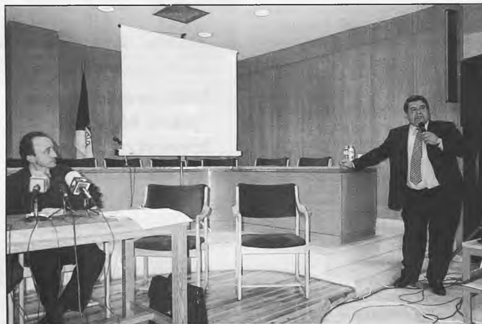
Un momento de la cuidada presentación del CDET.