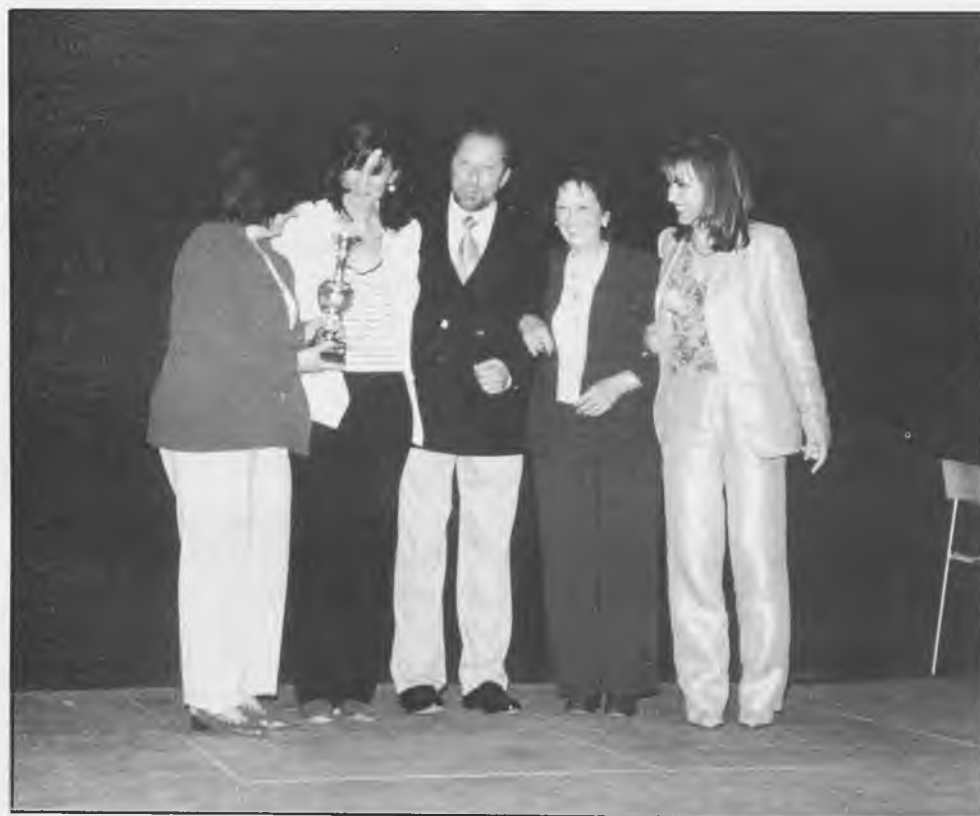
Grupo de teatro Anade

en esta I Muestra: El día 16 de mayo fue el Grupo Epidauro, Colegio Divina Pastora que representaba "Cuatro corazones con freno y marcha atrás", continuando el día 18 con el grupo Bolote que representó "La Quintería"; el día 24 es el grupo Anade con "La boda de los pequeños burgueses"; el día 25 la Compañía El Telón participó con "El botón de Benavides" y "El marido de mi mujer", el día 26 fue en horario matinal la Compañía Cábala