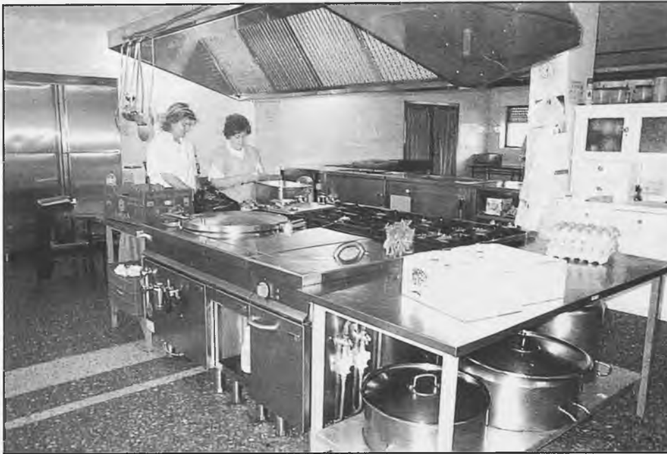
Las instalaciones de cocina, residencia y comedor son únicas en muchos kilómetros a la redonda.

alumnos internos, con cocina-comedor, plancha-lavandería, sala T.V., sala de ordenadores, despachos educadores y habitaciones para tres alumnos con aseos y servicios propios en cada habitación.