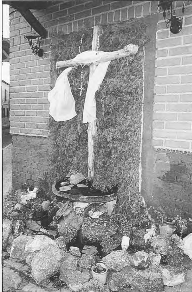
Cruz de Mayo del barrio El Quijote

- La Concejalía de Bienestar Social, ha preparado actividades para niños y jóvenes durante la época de vacaciones. Entre estas actividades, está la de la resi-