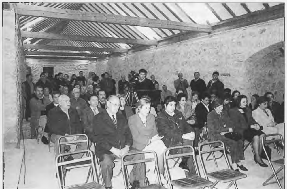
Numerooso público se congregó en el restaurado molino de Molemocho, para la presentación de las rutas de la Peña Equina Rocinante.

Desde aquí, felicitamos a los componentes de la Peña, para que no desmayen en este hermoso quehacer que redunda en la promoción de Daimiel.