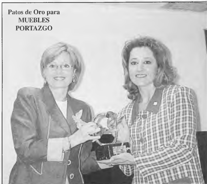
Patos de Oro para MUEBLES PORTAZGO