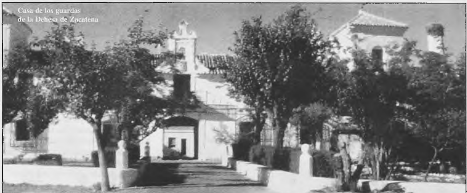
Casa de los guardas de la Dehesa de Zacateña

- Sangre por la boca ni mucha ni poca. - Mas da Dios que picaros quitar. - El mal, mal hijo cría. - Mas vale ser cabeza de ratón que cola de león. - Estudia más un hambriento que los abogados. - Según te veo el hato así se trato. - Agua y consejos a quien los pida. - Agua en enero todo el año tiene tempero. - Abriles y caballeros pocos hay buenos. -Si no hubiera abril no hubieran año vil. JESUALDO SANCHEZ BUSTOS