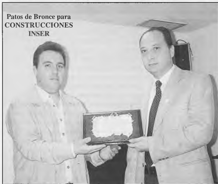
Patos de Bronce para CONSTRUCCIONES INSER