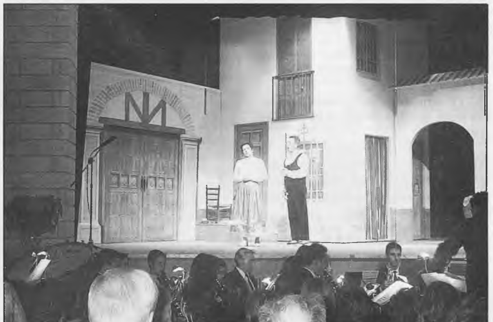
Se cuentan como éxito todas las actuaciones de la Zarzuela "La Rosa del Azafrán"

La representación, fue organizada por la Concejalía de Cultura del Ayuntamiento de Malagón y patrocinada por Obra Social de Caja Madrid.