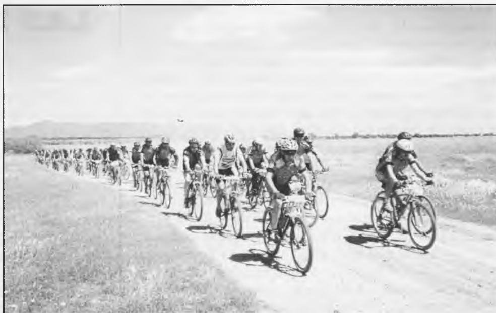
Los ciclistas en pleno esfuerzo

de las típicas quemaduras por caídas, erosiones, pinchazos y roturas de cadenas no es digno de reseñar incidente alguno.