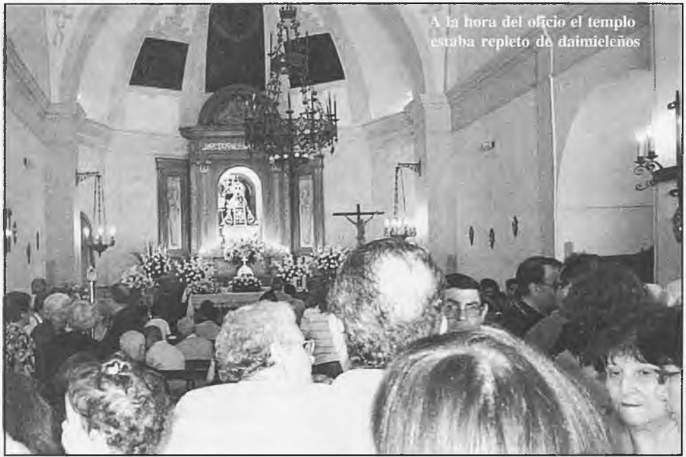
A la hora del oficio el templo estaba repleto de daimieleños

Se ha acordado entre el Ayuntamiento y las parroquias, que la presencia de actos religiosos, no se considere obligatoria para las autoridades municipales, sino como presencia voluntaria. No obstante, se les seguirá informando e invitando. Continuará como antes, el día primero de septiembre.