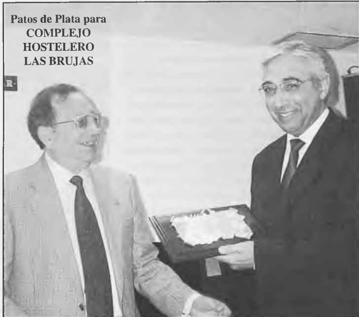
Patos de Plata para COMPLEJO HOSTELERO LAS BRUJAS