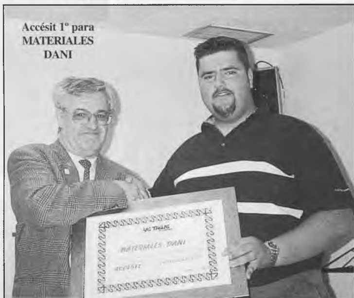
Accésit 1º para MATERIALES DANI