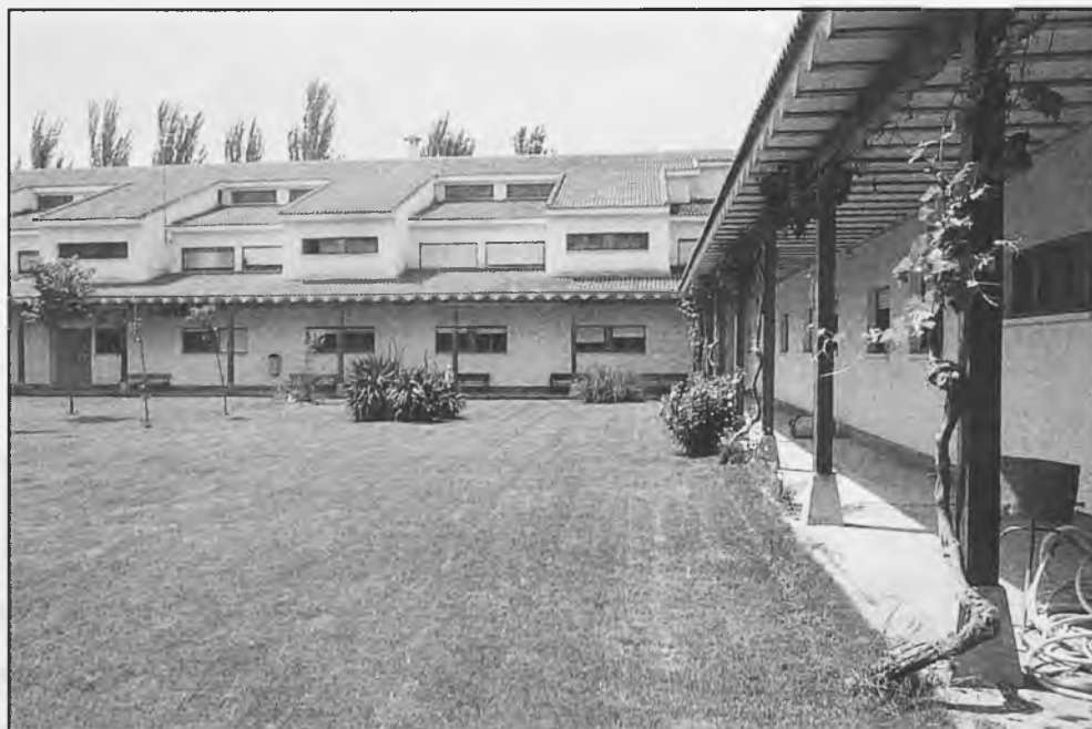
El entorno del IES Virgen de las Cruces, es idóneo para desarrollar actividades estudiantiles

En mi opinión personal y como daimienseño, creo que las dotaciones en medios y equipos es buena o muy buena, pero los recursos están dispersos entre los Centros de Enseñanza de la localidad. Daimiel ha pasado de ser cabeza de comarca educativa a tener alumnos casi exclusivamente de la localidad (con la excepción de nuestro Centro y algún alumno de FP del IES Juan D’Opazo); solo nuestro centro se ha venido nutriendo de alumnos de fuera y esto, si no cambian las normas de admisión de alumnos de ESO en la Residencia, irá en descenso progresivamente hasta desaparecer. También en mi opinión se orienta poco a los alumnos y padres sobre las salidas en F.P. al finalizar la ESO y se busca más la salida hacia el Bach-