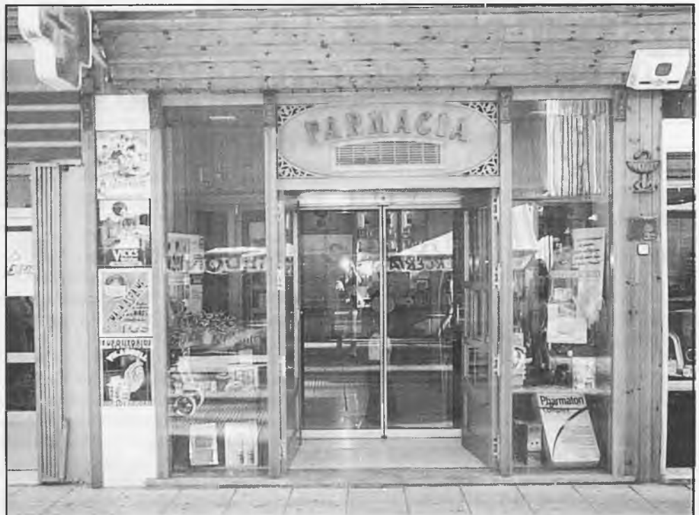
Los farmacéuticos de los pueblos nos prestan una atención más personalizada