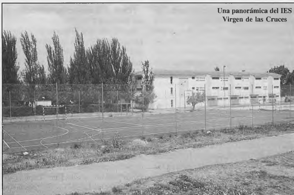
Una panorámica del IES Virgen de las Cruces