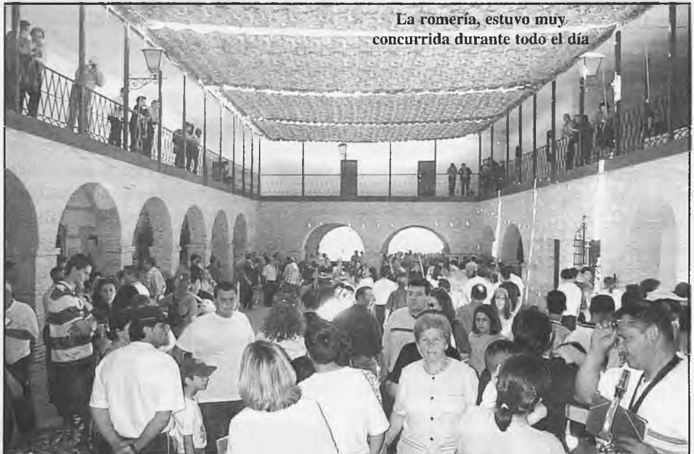
La romería, estuvo muy concurrida durante todo el día