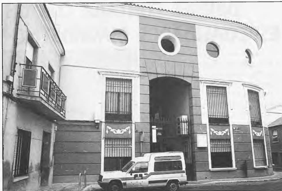
Se han tenido en cuenta los errores que se cometieron al ubicar el actual Centro de Salud, para evitarlos en la construcción del nuevo.

Durante marzo y abril de este año, se ha procedido a la localización del lugar donde se ubicará el CDET; entre mayo y junio, se realizará el proyecto y la contratación; los meses de julio y agosto, se dedicarán a la adjudicación de las obras; en septiembre y octubre, se aprobarán y en noviembre y diciembre se contratará la ejecución. Se espera que las obras se inicien durante el primer trimestre del próximo año y que el Centro de Especialidades, Diagnóstico y Tratamiento, esté funcionando en