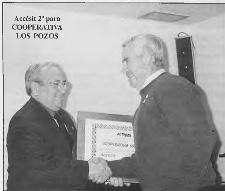
Accésit 2º para COOPERATIVA LOS POZOS