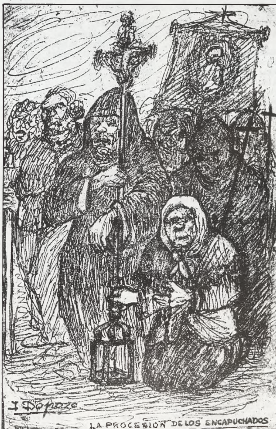
LA PROCESSION DE LOS ENCAPUCHADOS

Encuestas a los Presidentes de las Cofradías de Semana Santa de Daimiel