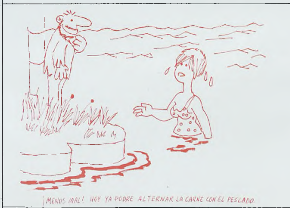
¡MENOS MAL! HOY YA PODRE ALTERNAR LA CARNE CON EL PESCADO.