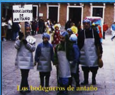
Los bodegueros de antaño