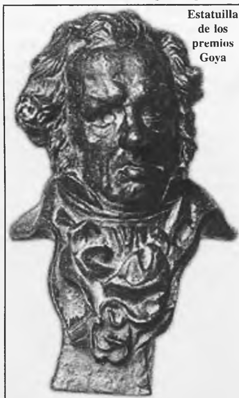
Estatuilla de los premios Goya

El primero, TRABAJO para todos, trabajo de calidad para hacer películas interesantes. El segundo deseo millones de ESPECTADORES para ver nuestro cine, nuestra identidad y nuestra cultura. Y el tercero LIBERTAD DE EXPRESIÓN para crear arte, un país libre sin guerras sin violencia y en paz. En definitiva disfrutar de buenas películas españolas que nos conmuevan, nos emocionen, nos diviertan y nos muestren un compromiso con la realidad y los valores humanos. Por ello y desde mi pequeña y humilde tribuna espero que se cumplan dichos anhelos, y que como el genio de la lámpara de Aladino, podamos conseguir esos deseos, aunque sabemos que son difíciles de conseguir pero lo importante es luchar e intentarlo cada uno desde su lugar en el mundo. Gracias y todos con nuestro CINE.