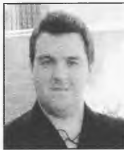
MIGUEL ANGEL FANEGA

El obispo de Ciudad Real, D. Antonio Algora, será el encargado de pronunciar el pregón de la Semana Santa del 2004. El lugar donde se llevará a cabo, aún está por determinar.