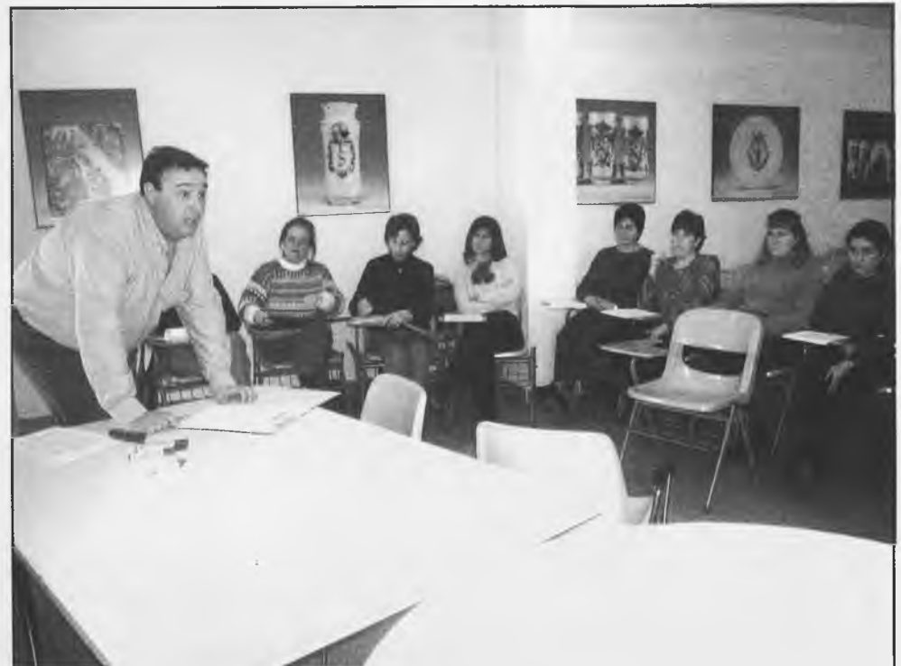
Escuela de Padres y Madres del año 2003

de vida de los padres y madres con hijos con discapacidad, el área psicológica del Centro de la Mujer, tras el éxito obtenido con la escuela de padres y madres, ha creado la “Escuela de padres y madres de chicos y chicas con discapacidad”, surgiendo este proyecto por la gran demanda de familias con hijos e hijas con una problemática determinada ya que en ocasiones se sien-