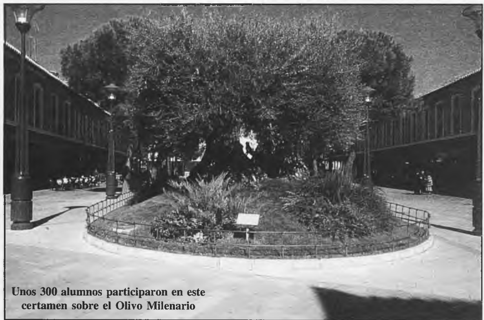
Unos 300 alumnos participaron en este certamen sobre el Olivo Milenario

los artistas protagonistas del acto. Unos 300 alumnos, de los últimos cursos de Educación Primaria, ocuparon los alrededores del olivo; y era curioso ver las posturas originales de los pintores, que habían recibido el material preciso y como premio general, una camiseta alusiva, que fue donada por la Obra Social de la Caja de Castilla La Mancha, que patrocinaba el concurso. Luego una "cata", es decir, pan untado de aceite y azúcar o sal. Al día siguiente, se les hizo un obsequio simbólico.