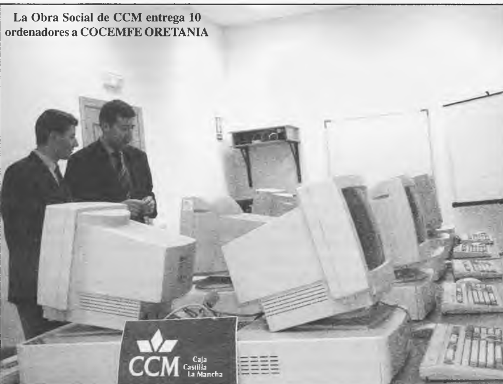
La Obra Social de CCM entrega 10 ordenadores a COCEMFE ORETANIA

También podrían implantarse más contenedores en diferentes zonas. En pasadas ediciones de LAS TABLAS, ya comentamos la necesidad de aumentar el nú-