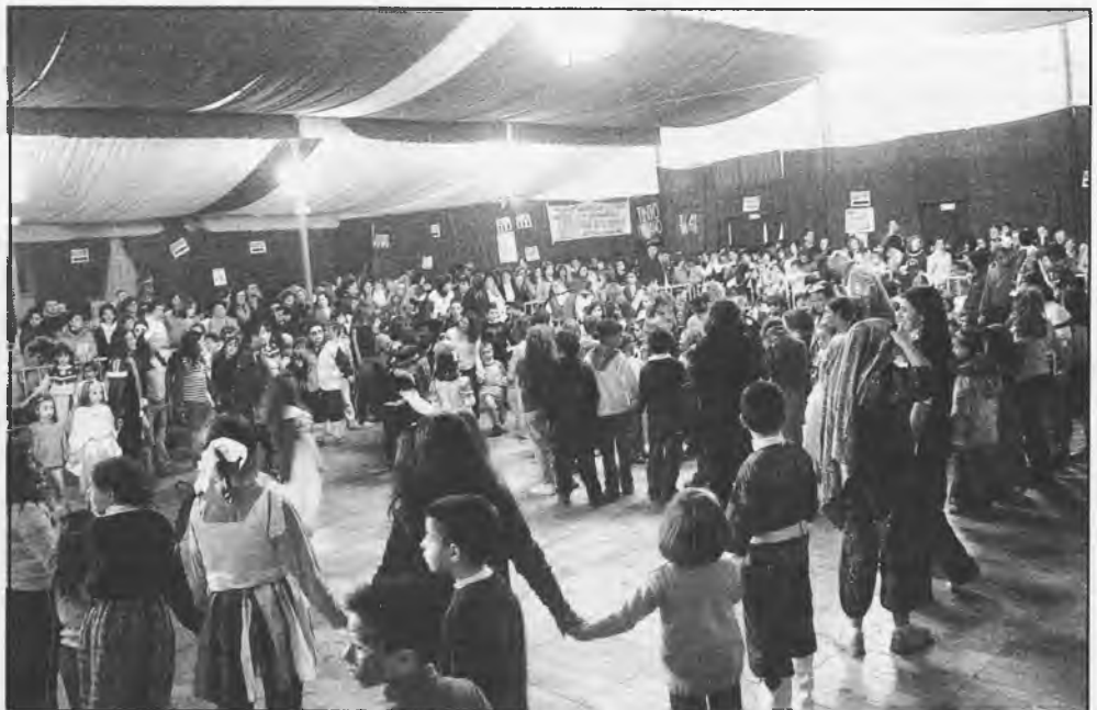
El pasado lunes de Carnaval, muchos niños pudieron disfrutar de bailes y juegos en la Carpa Municipal

La sala permanecerá abierta los miércoles y jueves para niños de 9 a 14 años de 16,00 a 17,30 horas. Los viernes se proyectará una película, cuyo título dependerá de la elección de ellos mismos.