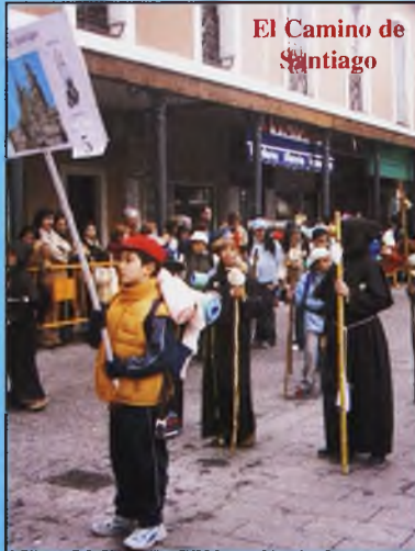
El Camino de Santiago