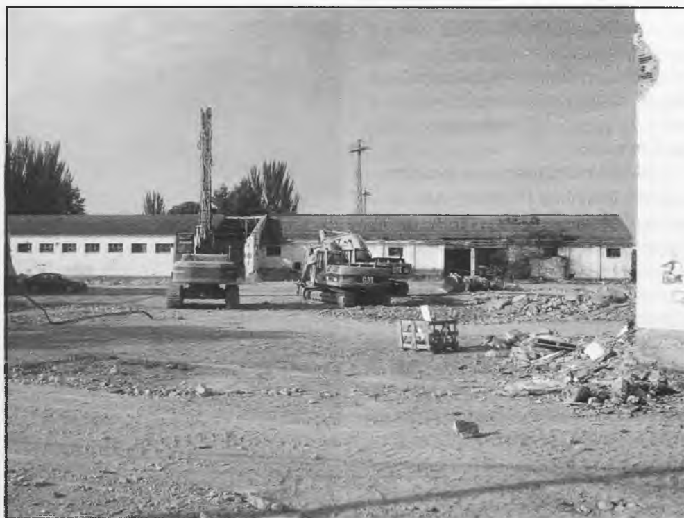
Ya se ha hundido la antigua Cooperativa la Daimieleña

menterio, que brotó hasta 70 centímetros. Y este año hubiera llegado a los 2 metros. Pero RIP. Y eso no es lógico. Un árbol no es tonto. Pues... muy, muy, muy, muy mal.