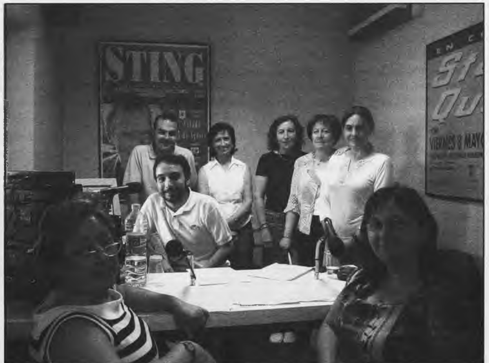
Componentes del Grupo de Teatro Ánade, en las emisoras de Rado Daimiel