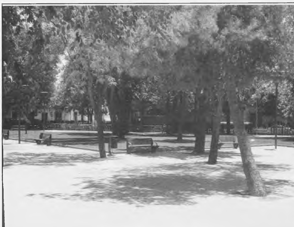
Con la colocación del césped y los rosales en el Parque del Carmen éste, ha ganado en vistosidad