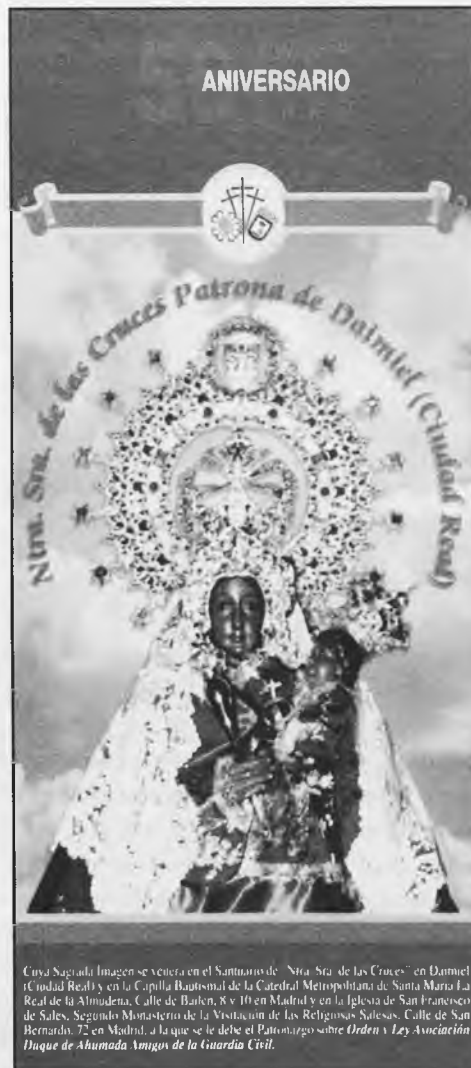
Cuya Sagrada Imagen se venera en el Santuario de "Ntra. Sra. de las Cruces" en Daimiel (Ciudad Real) y en la Capilla Bautismal de la Catedral Metropolitana de Santa María La Real de la Almudena, Calle de Bailón, s/n 10 en Madrid y en la Iglesia de San Francisco de Sales, Segundo Monasterio de la Visitación de las Religiosas Salesas, Calle de San Bernabé, 72 en Madrid, a la que se le debe el Patronazgo sobre Orden y Ley Asociación Duque de Ahumada Amigo de la Guardia Civil.

nido sobre la sociedad de cualquier época, y desde que fuera escrita.