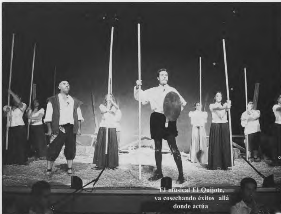
El musical El Quijote, va cosechando éxitos allá donde actúa

D. Quijote partió el día 24 de junio hacia tierras catalanas, concretamente a