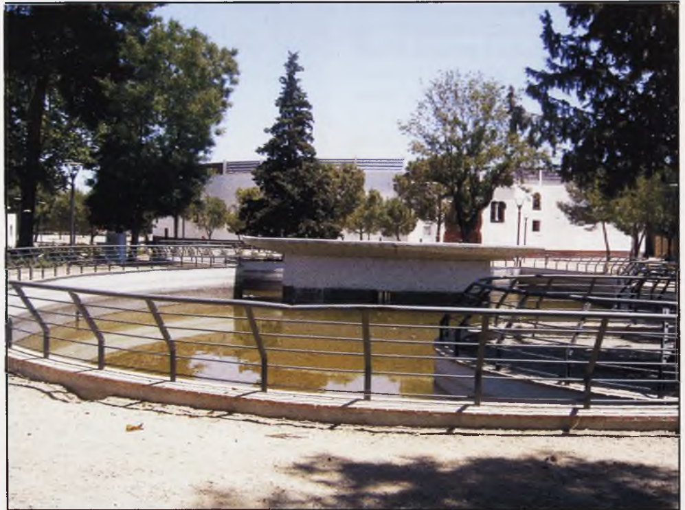
El estanque del Parque del Carmen, se encuentra siempre en un pésimo estado

tre en un lamentable estado que ha llegado a provocar que el agua estancada se corrompa con el consiguiente malestar?