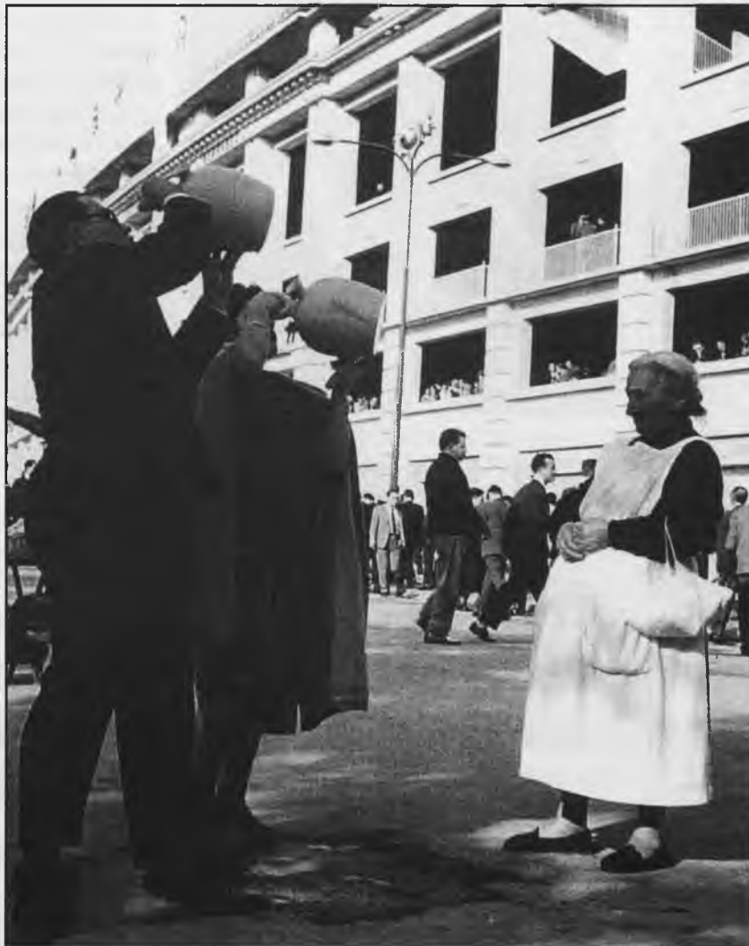
Año 1959, la "aguadora" hace su agosto en la entrada del estadio Santiago Bernabeu

de madera y en el pozo más próximo las llenaban y las llevaban a los trabajadores para cuando llegasen a la punta, desahogarse y refrescarse; aunque había algunos, sobre todo segadores, que no eran muy aficionados al agua, y decían que el agua era para las ranas, y preferían un puchero de vino para que el cuerpo cogiera energías. En la actualidad, el agua corriente es una realidad en pueblos y ciudades. Los frigoríficos la mantienen todo lo fresca que se quiera, y una enorme cantidad de marcas de refrescos invaden los mercados, para satisfacer a aquellos que no son muy aficionados al agua del grifo; si además a todo esto unimos la enorme proliferación de bares, cafeterías, etc., aún en poblaciones pequeñas, vemos que el aguador ya no tiene espacio vital en nuestra sociedad, incluso ni en el campo, porque ya no hay segadores, y en la vendimia, como no hacen quinterías, llevan el agua del pueblo.