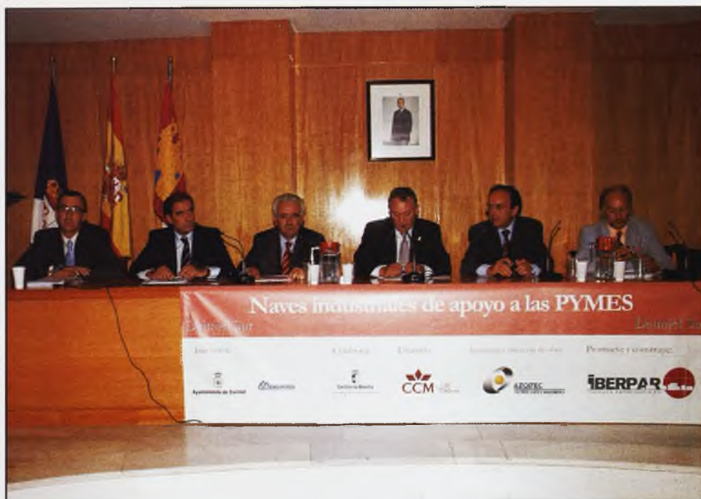
Presidencia de la mesa en la presentación del Conjunto Industrial promocionado por IBERPAR en el polígono industrial "Daimiel Sur"

La progresiva instalación de nuevas empresas en los polígonos, lleva pareja la creación de puestos de trabajo, directos e indirectos, pero también la instalación de muchos trabajadores de forma definitiva en Daimiel, con la compra del piso o casa y el gasto diario que supone mantenerse. Para potenciar la actividad industrial, el pasado 29 de junio, en el salón de Plenos del Ayuntamiento, se presentó el Conjunto Industrial para pymes de "Daimiel Sur", que consistirá en la construcción de 26 naves de 280 metros cuadrados aproximadamente, en una parcela de 20.000 m 2 . Será como el pistoletazo de salida, aunque según hemos podido saber, son varias las empresas que esperan la entrega del terreno, para iniciar las obras de construcción de sus respectivas instalaciones. Las naves podrán financiarse a través del convenio suscrito entre Caja de Castilla La