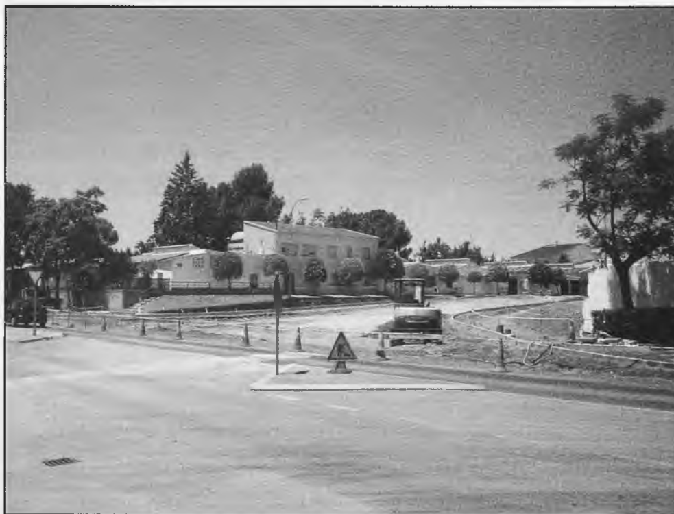
Lugar donde se inicia la avenida de los Deportistas, y ahora se construye la rotonda que unirá ésta con la carretera de salida hacia Madrid.