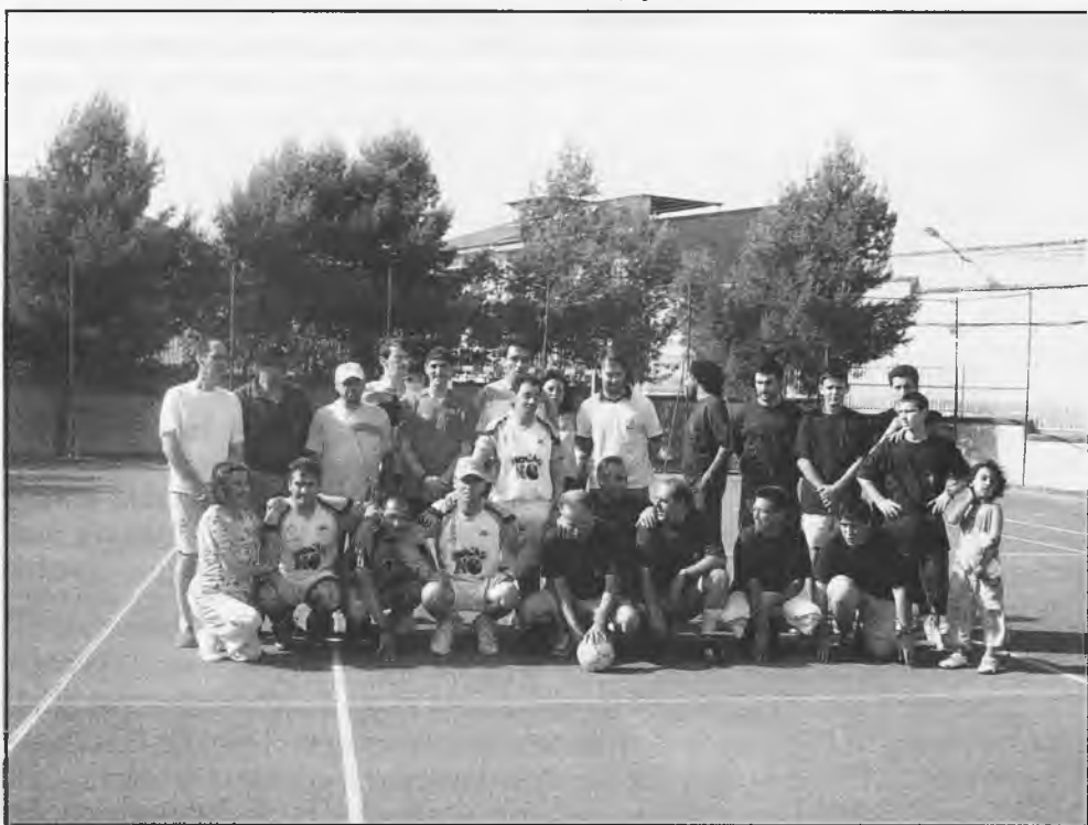
Componentes del barrio de El Quijote y Jóvenes del Proyecto Hombre, jugaron un partido de fútbol donde, sobre todo, primó la deportividad