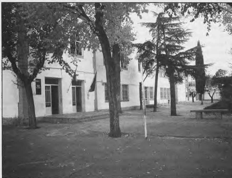
Un nuevo colegio se construirá en el barrio de San Isidro, lo que entendemos llevaría pareja la desaparición del actual, al menos con el destino que tiene ahora.

También en sesión ordinaria, se aprobó por unanimidad en el pleno del Ayuntamiento del pasado mes de junio, solicitar la construcción de un nuevo colegio, que estaría ubicado en el barrio de San Isidro.