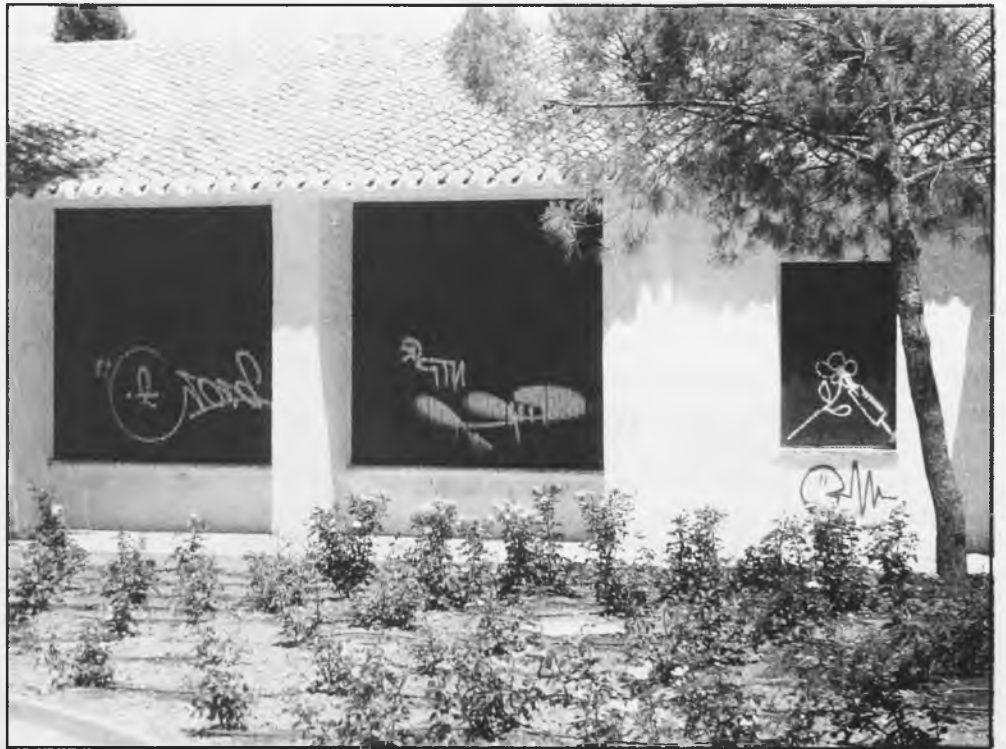
Se ha aprobado una ley que sancionará las gambetas que se producen en los bienes públicos

Aunque las obras del Parque del Carmen están "inicialmente finalizadas" con las recientemente terminadas zonas de césped y rosales, se tiene prevista la colocación de 20 farolas en dicho parque, que complementarán la adecuación de este espacio verde. En lo que respecta al Parque de Covadonga, se prevé la instalación