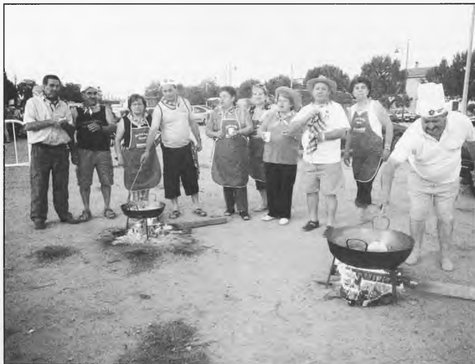
Año tras año, el Día de la Sartén atrae a más participantes y espectadores