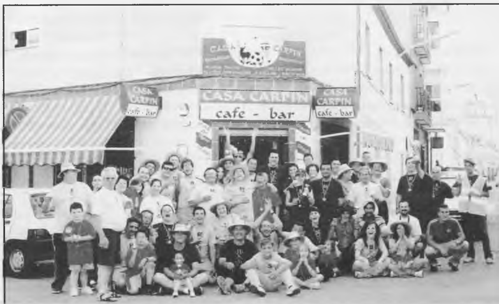
Celebración en el barrio de El Alto, el pasado 11 de junio

Mas de veinte trofeos se repartieron, en todas sus modalidades; al más feo para Pitones; al más guapo para el entrenador Kilalo; al mas Orejon, a Victoriano arbitro; al más sexy a Paparazzi Chele; al más cabezón para Carpin; a las piernas más