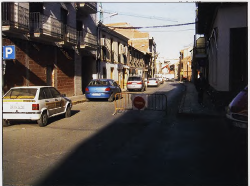
Todos los días podemos ver en Daimiel algunas calles cortadas durante un largo periodo.