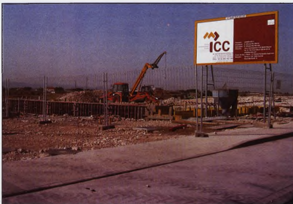
Imagen del estado de las obras del futuro Conjunto Industrial del Polígono "Daimiel Sur"