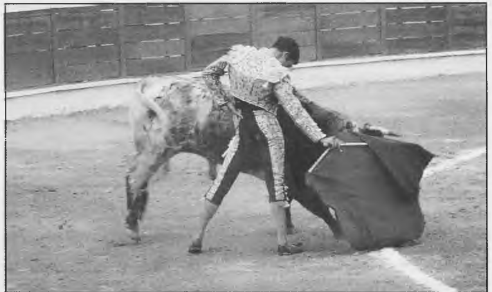
Luis Miguel, volvió a triunfar en la Plaza de Toros de Torralba