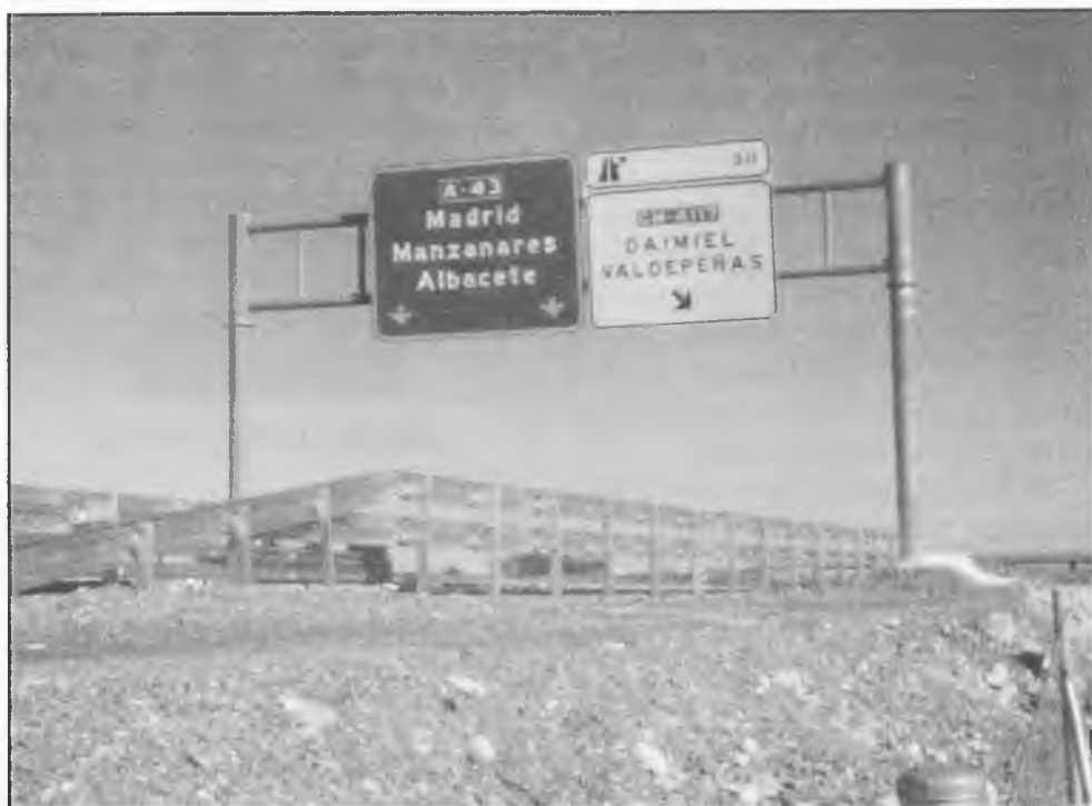
El tramo de autovía que unirá Daimiel con Manzanares, y por tanto con la Autovía de Andalucía se abrirá al tránsito para el último trimestre de este año.