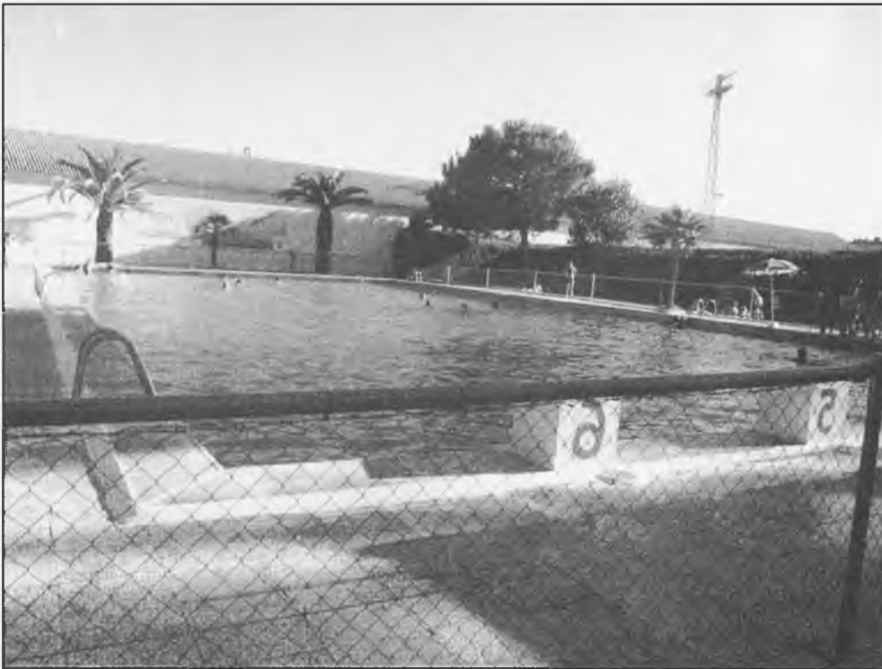
Las piscinas del Polideportivo Municipal, se han abierto para uso y disfrute de los ciudadanos en estos cálidos meses de verano

hacer de las instalaciones, etc. rentes grupos de edad, uso que se vaya a siendo los precios adaptados a los días, excepto los lunes, que se abre a las 12,30,