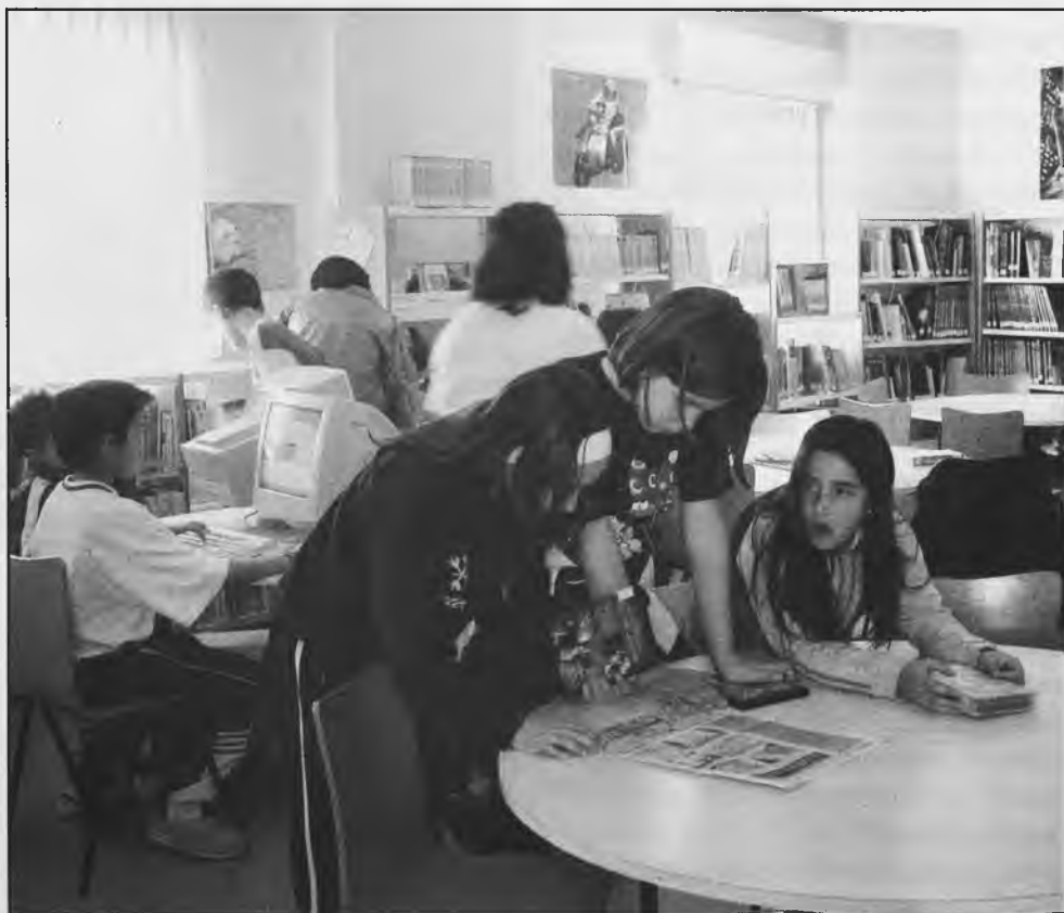
La Biblioteca Municipal, ya tiene el nuevo horario de verano