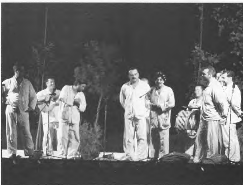
El Culo de la Manola, actuó en las fiestas del barrio de El Quijote