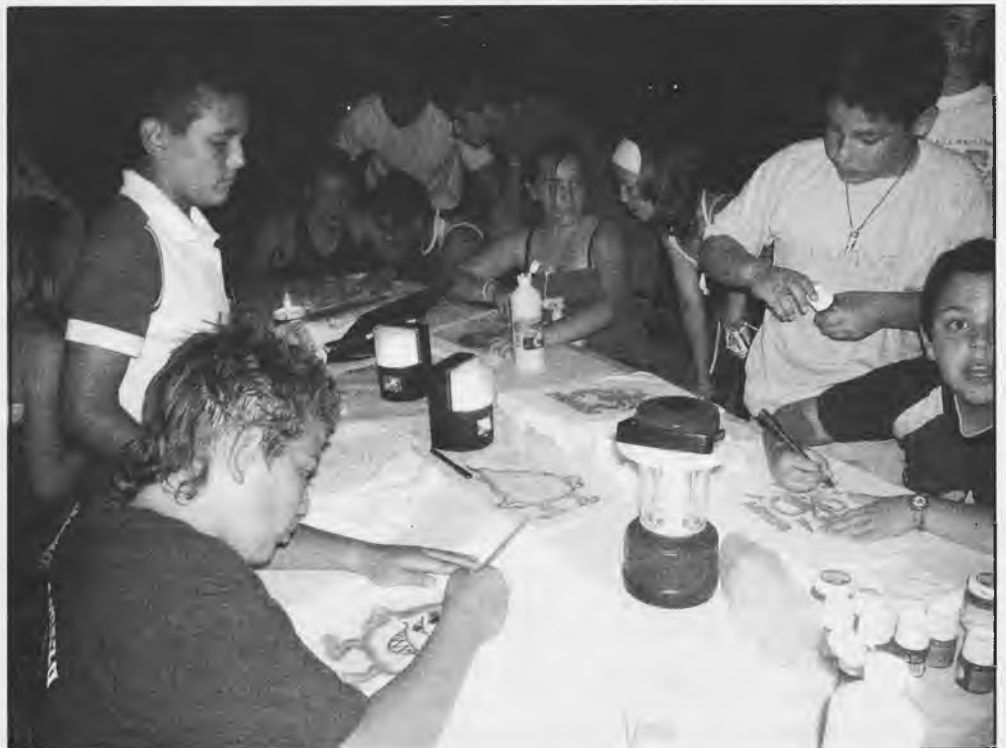
Taller de Camisetas, una de las actividades de Esta Noche Toca

El Grupo de Teatro Ánade de Daimiel, llevará a cabo en Radio Daimiel, durante el mes de julio la puesta en antena del sainete en dos actos "Diálogos entre Roci-