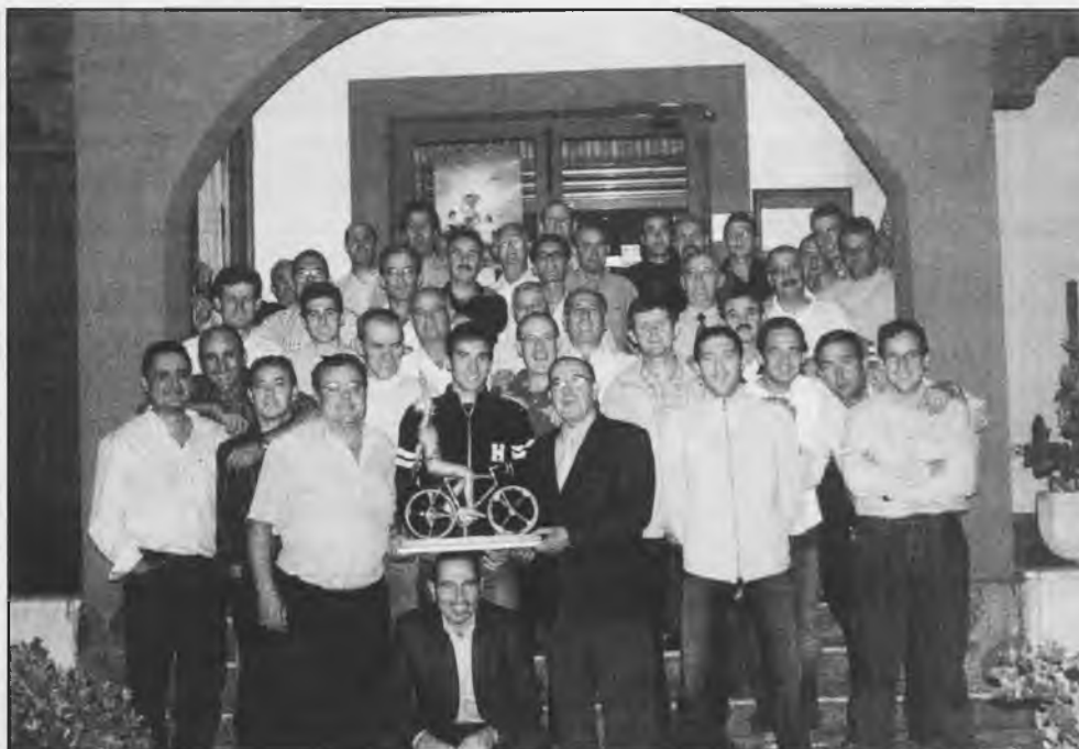
Miembros de la Peña Ciclista "José Antonio Pecharromán"