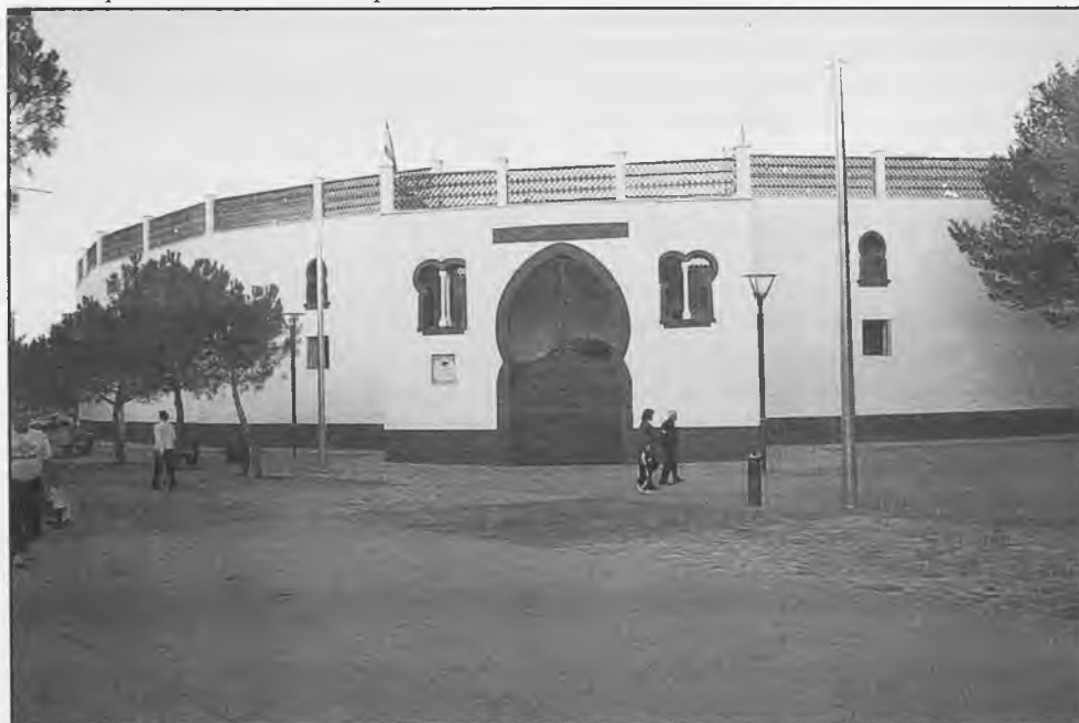
Plaza de Toros de Daimiel

Los municipios de Almagro, Ciudad Real, Villanueva de los Infantes, Daimiel, Villanueva de los Ojos y Valdepeñas, que integran la llamada Mancomunidad Tierra de Caballeros y Tablas de Daimiel siguen desarrollando su plan de Dinamización Turística. Según indicó la presidenta de la Mancomunidad, Ramoní Núñez de Arenas el objetivo es "dinamizar cada una de las poblaciones como territorio único, ofertando al visitante un destino unitario para que pase por todos y cada uno de los municipios que componen Tierra de Caballeros y Tablas de Daimiel".