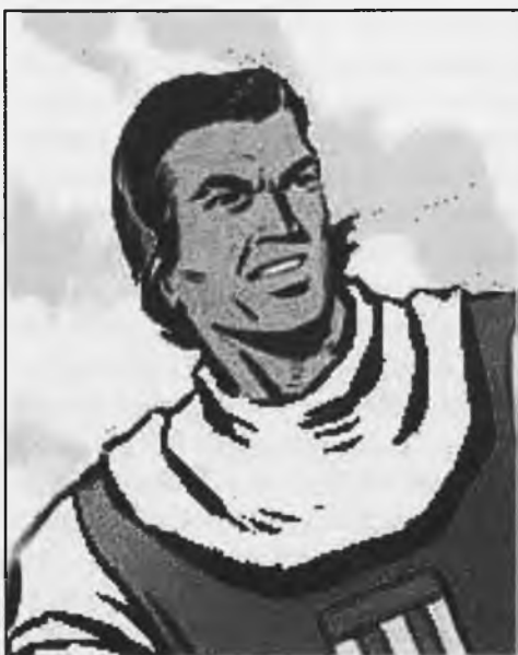
El Capitán Trueno, uno de los comic más leídos en España