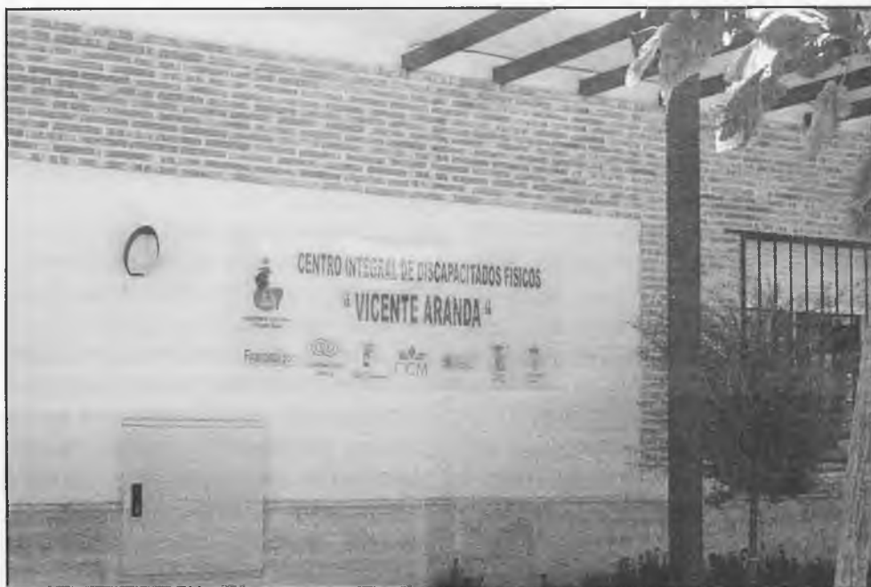
Se ha aprobado un plan para la eliminación de barreras urbanísticas

La Comisión de Gobierno del Ayuntamiento de Daimiel ha aprobado un plan para la eliminación de barreras urbanísti-