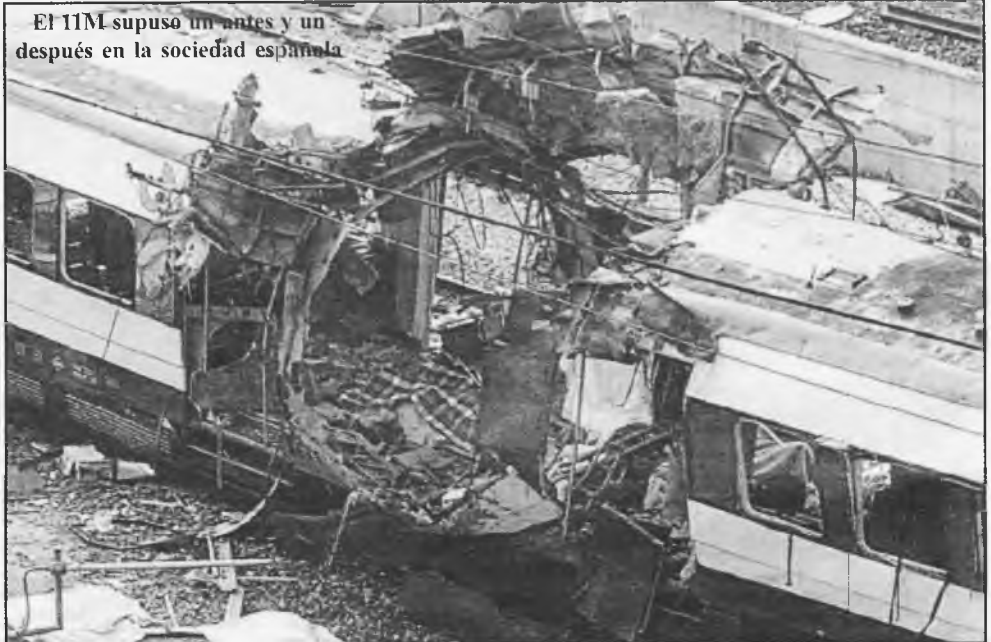
El 11M supuso un antes y un después en la sociedad española

No me separé de ella ni un solo momento. Media cara izquierda era la calavera, totalmente en el hueso, sin ojo, ni piel, ni músculo. Algo horrible, pero, al menos, estaba viva.