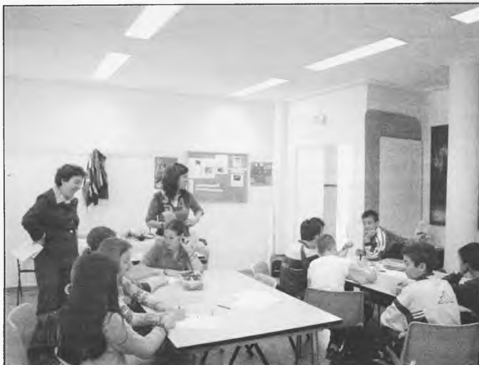
La Concejal de Infancia y componentes del taller "Ventana de Ocio"

La Delegación de Juventud ha puesto a la venta entradas para asistir a las obras