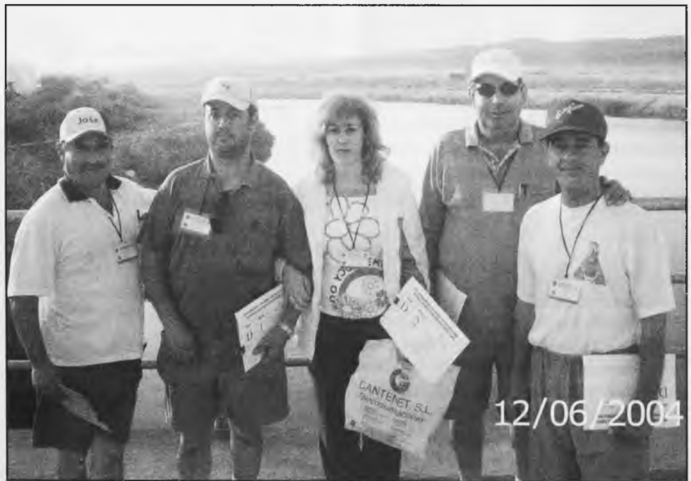
Miembros del Club de Pesca Deportiva "Virgen de las Cruces" que actuaron como jurado en el campeonato