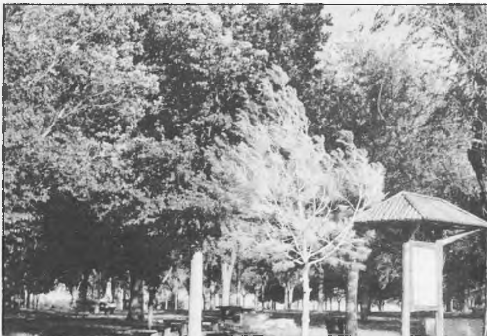
La Ruta de Don Quijote 2005, pasará por el Santuario de las Cruces

Por sexto año consecutivo, el Instituto de Educación Secundaria Juan D'Opazo llevará a cabo el Programa de Garantía Social, en este caso para el curso 2004-2005, de iniciación profesional de electromecánica del automóvil, modalidad automoción, equiparado con la modalidad profesional de ayudante de reparación de vehículos. Dicho curso cuenta con 15 plazas, destinadas a jóvenes entre los 16 y los 21 años carentes de titulación académica, y permite acceder, una vez aprobado, a Ciclos de Formación Profesional de Grado Medio en todas las ramas. Para