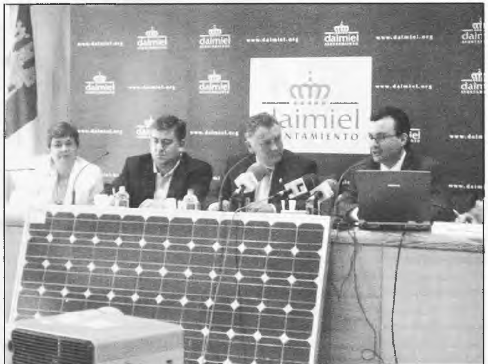
Daimiel ha sido elegido para la ubicación de una Central Solar

Solares del Mediterráneo-, para ubicar en su flamante Polígono Industrial Sur- la instalación de una Central Solar, constituida por ciento veinticuatro instalaciones de entre cinco y veinticinco KW. Ocupará una extensión de quince mil metros cuadrados, con una inversión total de unos cinco millones de euros.