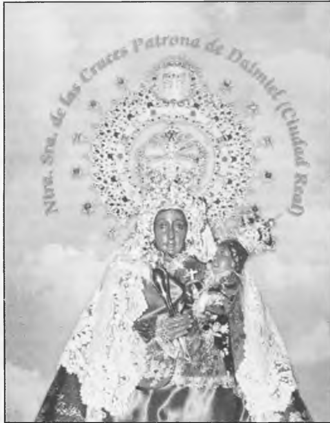
Ntra. Sra. Virgen de las Cruces