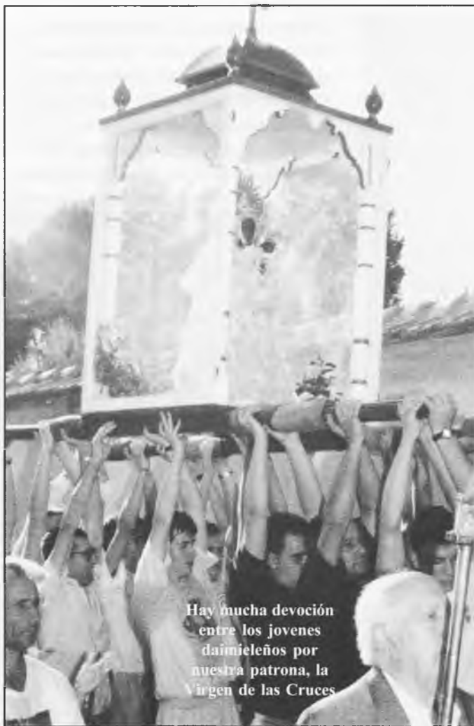
Hay mucha devoción entre los jóvenes daimieleños por nuestra patrona, la Virgen de las Cruces