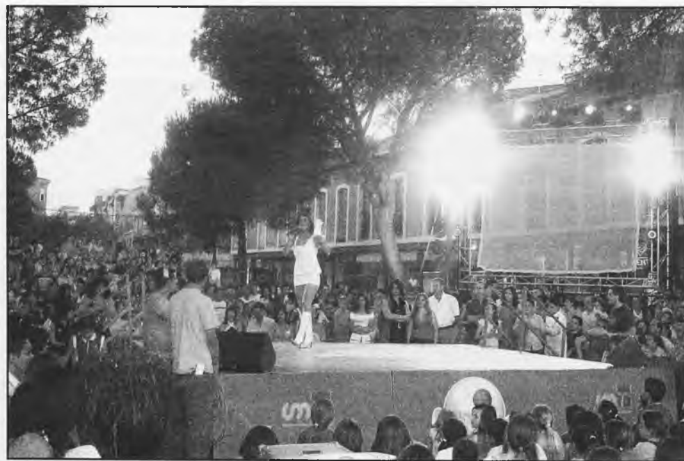
La grabación del popular programa de la televisión regional "Arrasando", levantó mucha expectación.