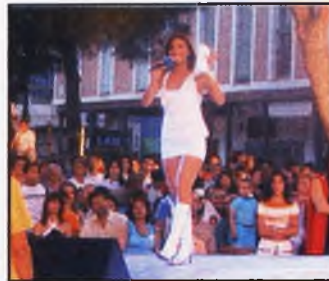
Grabación de "Arrasando" en Daimiel (Pág. 10)