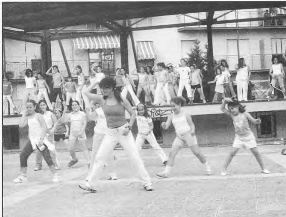
Exhibición de aerobio, en la plaza María Cristina