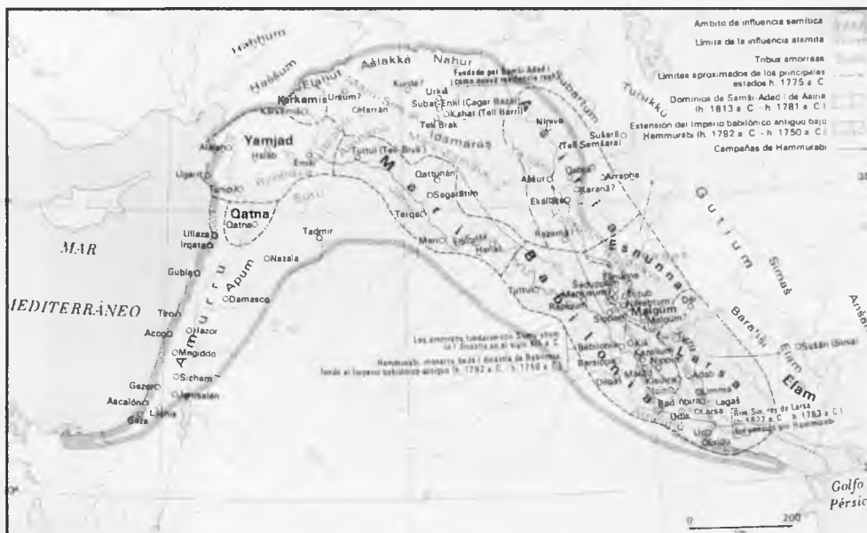
Mapa de Mesopotamia

tón. Se siguen respetando poco los badenes de entrada de vehículos a las casas, antes no se podía exigir a un burro o a un mulo que saltase de la calle a la acera sin rebaje. Pero ahora, un vehículo lo hace eso sin esfuer-