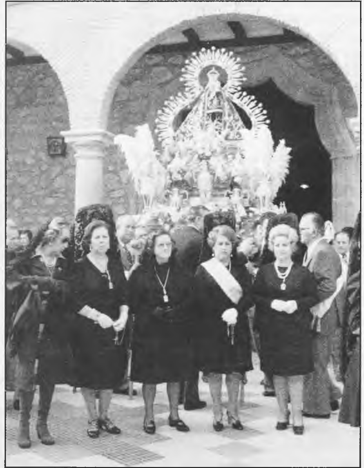
La Virgen de la Cabeza, a la salida de Santa María en Daimiel

Esta Junta, se congratula por las felicitaciones recibidas, y agradece públicamente, el sentir del magnífico acompañamiento a que hemos hecho referencia, y se compromete a seguir en la línea de dar mayor esplendor y realce a los cultos de nuestra imagen titular.