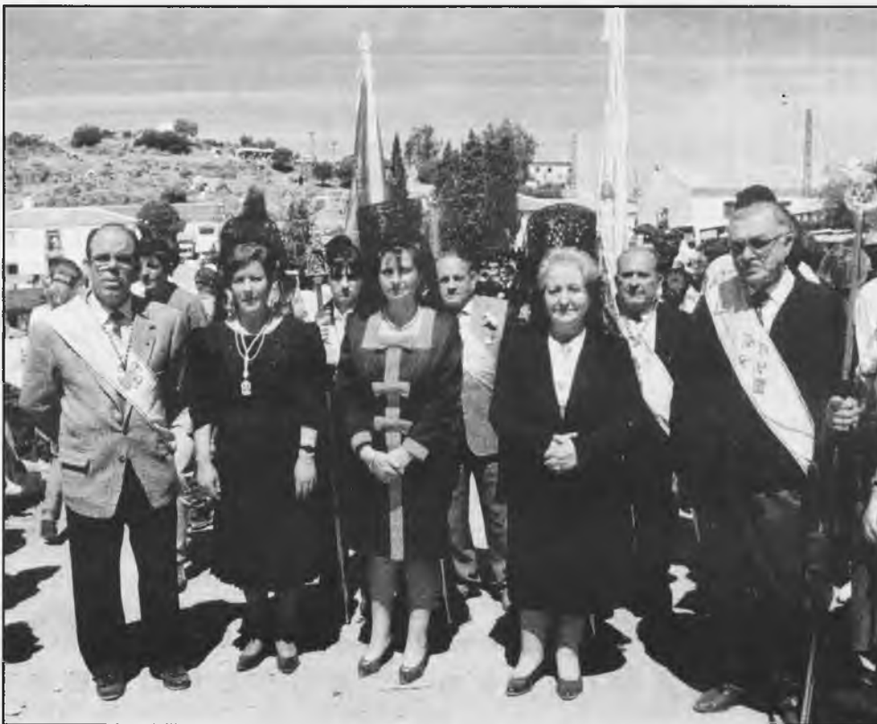
Miembros de la Junta de Daimiel, visitan Andujar

Somos conscientes de que, los comentarios tan favorables que hacen las personas que nos honran con su presencia, son fruto del esfuerzo de todos los miembros de la Junta, y este tipo de apoyo, proporciona gran satisfacción a los que componemos o somos miembros de esta Real Cofradía, orgullo que entendemos, deben compartir todos los daimieleños, por lo que de bueno tiene. Vamos a poner todo nuestro empeño, en mejorar, en la medida de lo posible, todo lo que hemos organizado, para que el próximo año, veamos todos que hemos superado el listón.