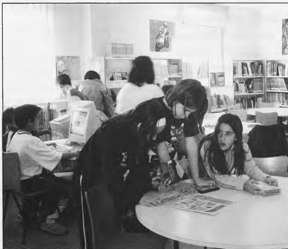
Esperemos que este II Concurso de Lectura, tenga igual o más éxito que el del pasado año

Deberán leer una serie de libros obligatorios, englobados en una lista, y después rellenar una ficha con los datos del