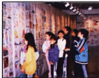
Premios del Concurso de Pintura Juan D'Opazo (Pág. 23)