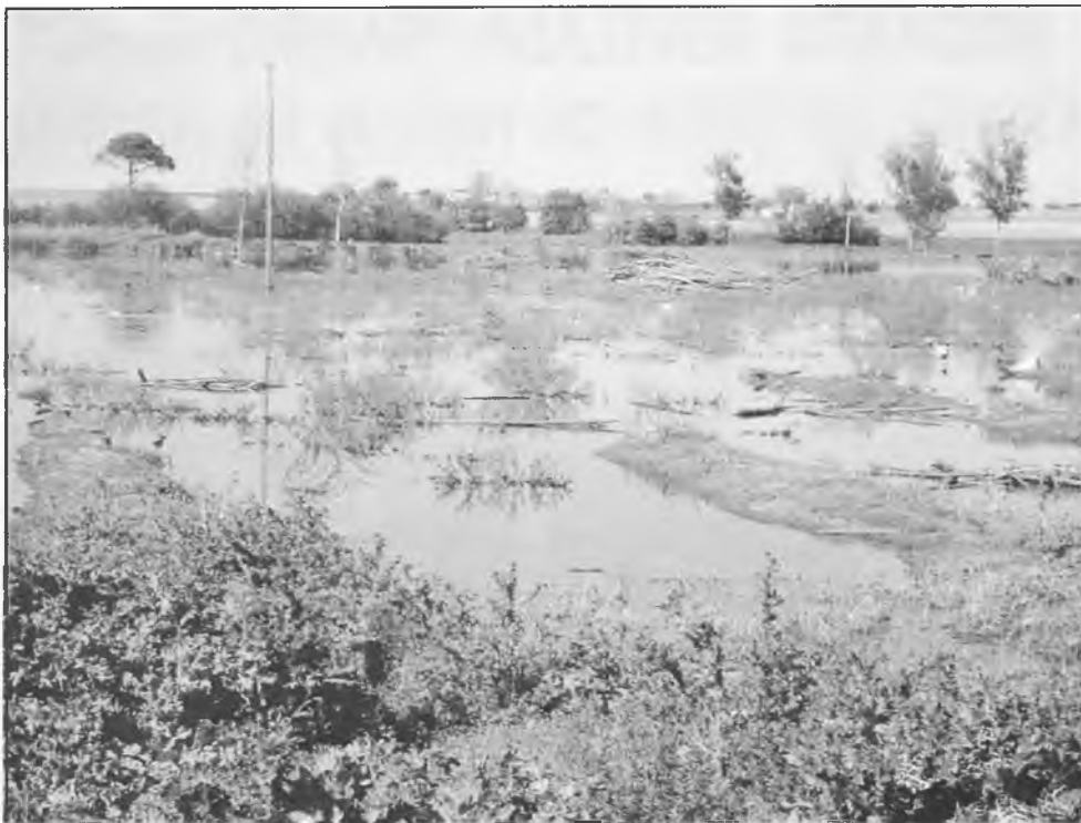
Laguna de Navaseca