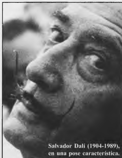
Salvador Dalí (1904-1989), en una pose característica.

Dalí, Dalí, sólo Dalí, genial como su surrealismo. Cuerdo como ilustre loco.