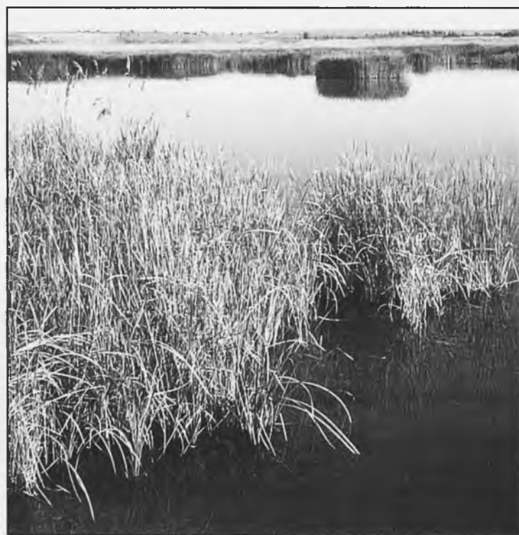
Las Tablas de Daimiel, visitadas por ilustres y famosos personajes a lo largo de su historia