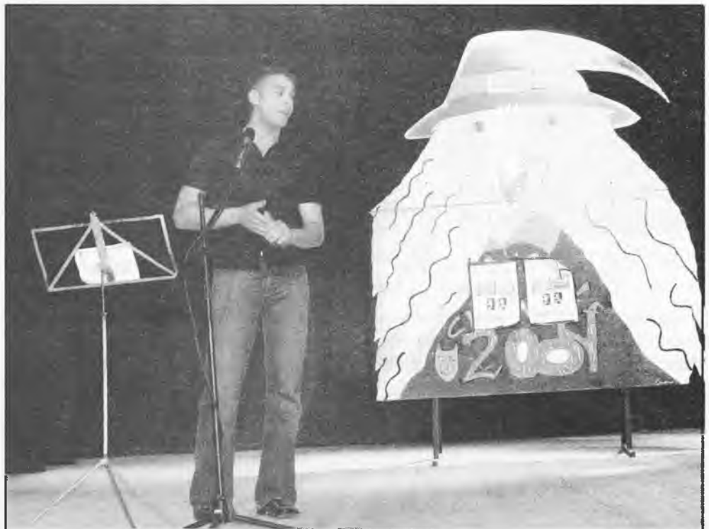
Ganador del concurso de chistes

- Puede comprobarse que el olmo bicentenario, que intenta sobrevivir, está creciendo muy bien. Tiene unos brotes de unos 50 centímetros y está pidiendo que se le proteja, por su prodigiosa vitalidad. Este vigor actual evidencia que le ha llegado agua, tan necesaria para esta especie y si nadie lo ha regado, se debe a las abundantes lluvias de esta temporada. Me refiero, al árbol que hay antes de llegar a la entrada de Maderas Fa-