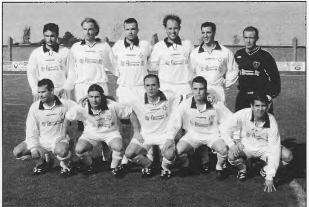
Equipo titular del Daimiel C.F., en el último partido jugado contra los Yébenes, en el que conseguimos el deseado ascenso

cionados respondieron a la fiesta, acudiendo más de dos mil personas al campo. Se consiguió el merecido ascenso, porque la unión entre todos hizo que los jugadores se esforzaran aun más para conseguir lo que la afición quería, después de ocho años, la fiesta que se vivió en el campo fue tan grande, que se tardará en olvidar en mucho tiempo. Fiesta por todo lo alto, la afición estuvo siempre con el equipo y el equipo siempre estuvo con su afición.