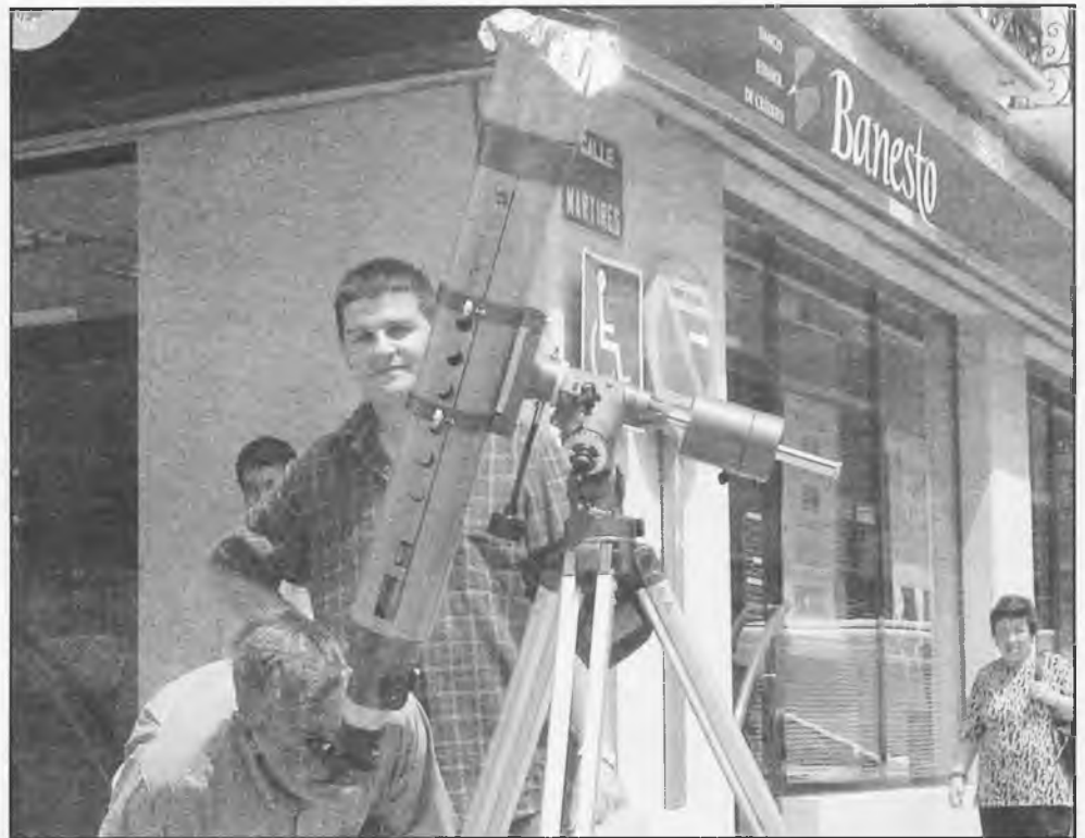
La Asociación Daimieleña de Astronomía, puso a disposición del público este telescopio, para observar el tránsito de Venus, que no podrá verse del mismo modo hasta dentro de 113 años.