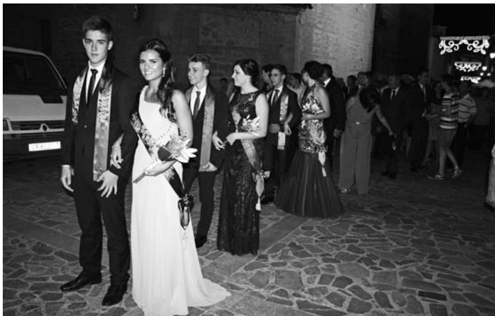
Desfile de Damas y Caballeros por la calle Mayor

Las actividades previstas con motivo de la Feria y Fiestas se prologaron hasta el 30 de agosto, con actividades culturales, lúdicas y deportivas dirigidas a todos los colectivos.