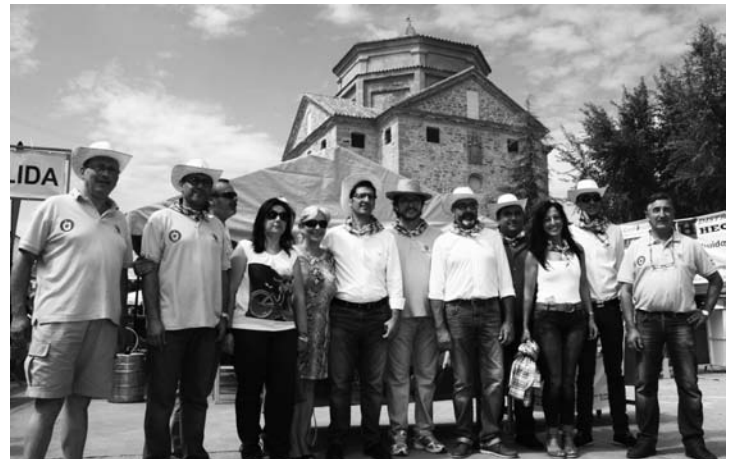
El presidente de la Diputación, José Manuel Caballero, junto a autoridades locales y representantes de Turinfa

La degustación del pisto manchego fue una de las actividades principales de las XIII Jornadas del Pimiento celebrada el domingo 6 de septiembre. Desde poco antes de las 8 de la mañana, 10 cocineros y un numeroso grupo de voluntarios trabajaron en la elaboración del "pisto más grande del mundo" para el que se han utilizado 2.500 kilos de pimientos, 800 kilos de tomates, 350 kilos de carne, 120 litros de aceite de oliva, 26 kilos de sal y 4 ó 5 de azúcar que son donados por agricultores, cooperativas y firmas de la comarca. Un día antes, cerca de 350 personas participaron en la "cortá" del pimiento. El Alcalde señaló que el próximo año se buscará la financiación necesaria para poder registrar el plato en el libro Guinness de los Récords y batir la marca del pisto de 250 raciones que existe en la actualidad.