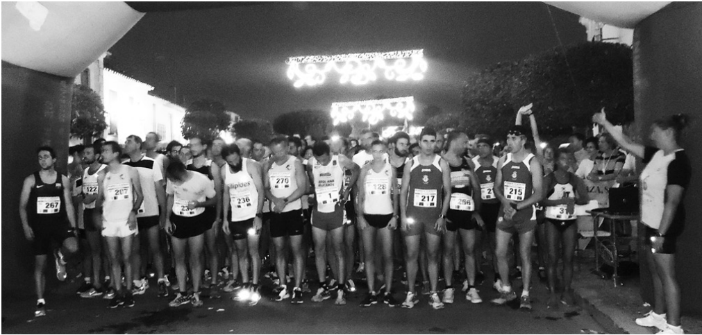
Salida la Carrera de las Antorchas