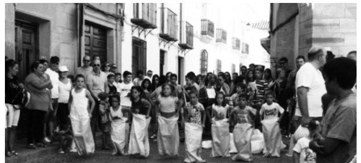
Actividades para los más pequeños en "La Plaza es tuya"