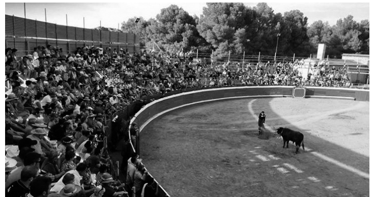
Festival Taurino en el Santuario de Ntra. Sra. de la Antigua