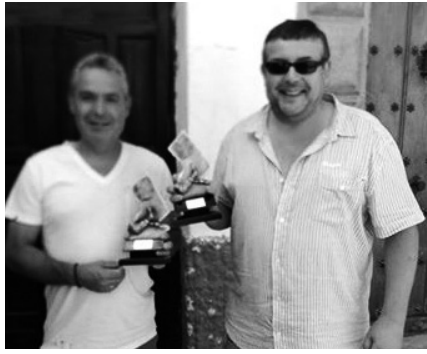
Ganadores del Campeonato de Truque.

Los de la ciudad de las navajas ganaron el torneo con comodidad, demostrando tener un equipazo, con buenos jugadores y venciendo a sus rivales en los dos partidos. Segundos fueron los súper jóvenes chicos de la cantera del At. Madrid que perdieron en su debut con los albaceteños por 1 a 3, pero lograron vencer a los chicos de Salcedo, que demostraron que con tantas novedades, aún tienen el equipo por hacer. Dos derrotas se llevaron los locales, pero era la primera prueba de toque y se puede hacer un buen equipo para afrontar la ilusionante campaña 2015-2016, con un grupo muy atractivo en la segunda autonómica.