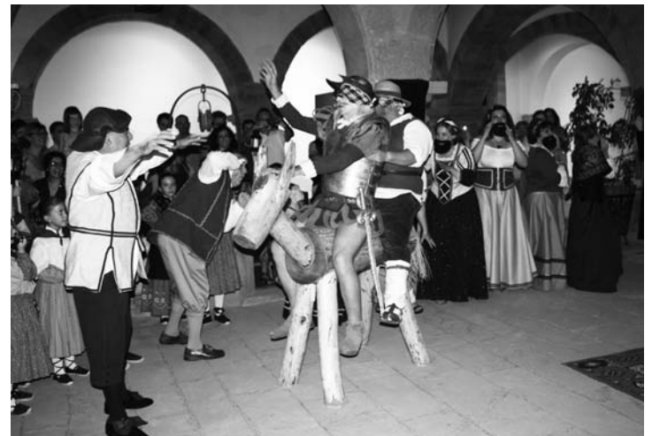
Aventura de Don Quijote y Sancho a lomos de Clavileño

Durante todo el recorrido la Rondalla de la Asociación Cruz de Santiago acompañó el "Paseo por el Quijote", con música y canciones populares del Campo de Montiel.