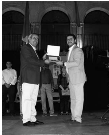
Cáritas, Premio Institucional

Entre las novedades de este año, visitas turísticas teatralizadas a cargo de la compañía Teastrero y autobuses gratuitos el domingo, desde los distintos pueblos de la comarca, subvencionados por la Diputación Provincial. Y todo ello, en un marco incomparable, decorado para la ocasión con guirnaldas y escudos de los Ayuntamientos de Campo de Montiel.