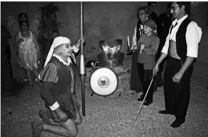
Don Quijote es investido Caballero