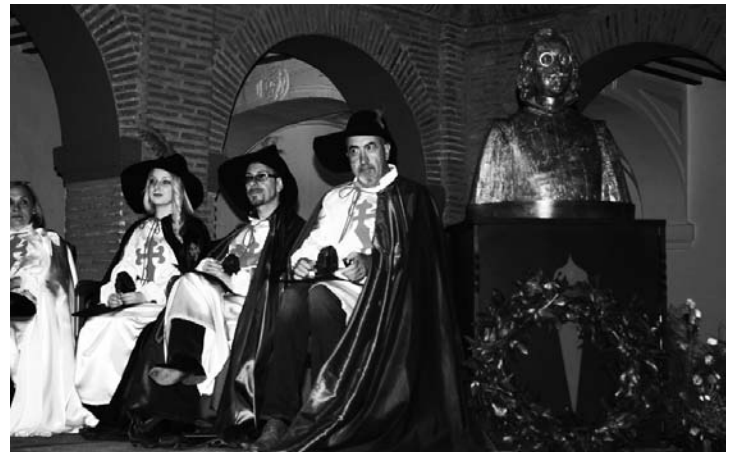
Premiados en el XXXV Certamen Internacional de Poesía