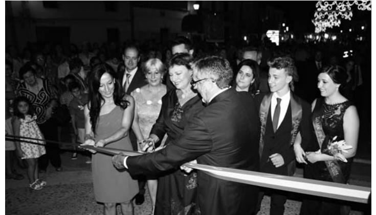
Corte inaugural de cinta en el Recinto Ferial

patrimonio y fomentar la cultura que emana de estas piedras que fueron testigo de los últimos días de Quevedo y que acompañaron los pasos de Miguel de Cervantes".