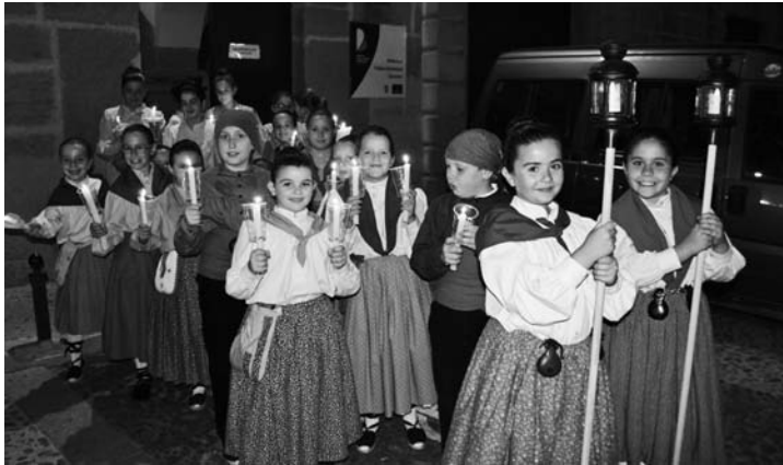
Rogativas por el grupo infantil de la Asociación Cruz de Santiago

El viernes, 4 de septiembre, tras los actos inaugurales de las XIII Jornadas del Pimiento y XII Mercado Cervantino la Asociación de Folclore y Tradición Cruz de Santiago inició la primera Jornada de Folclore con la Muestra Comarcal, que este año estaba dedicada de manera especial a las canciones religiosas antiguas: rogativas a Santa Rita de Fuenllana y el Rosario de la Aurora recogido en Infantes. Piezas del repertorio de música y baile fueron la jota de quintería de Infantes, nana de Fuenllana, torrás de La Solana, malagueñas del Bonillo, seguidillas de Tomelloso, fandango de Villarrubia y jota de Torija, entre otras.