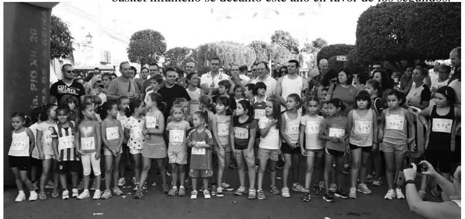
Participación de los más pequeños en la Carrera de las Antorchas

En Masculino, el clásico entre C.B.- Infantes y Veteranos del basket infanteño se decantó este año en favor de los segundos.