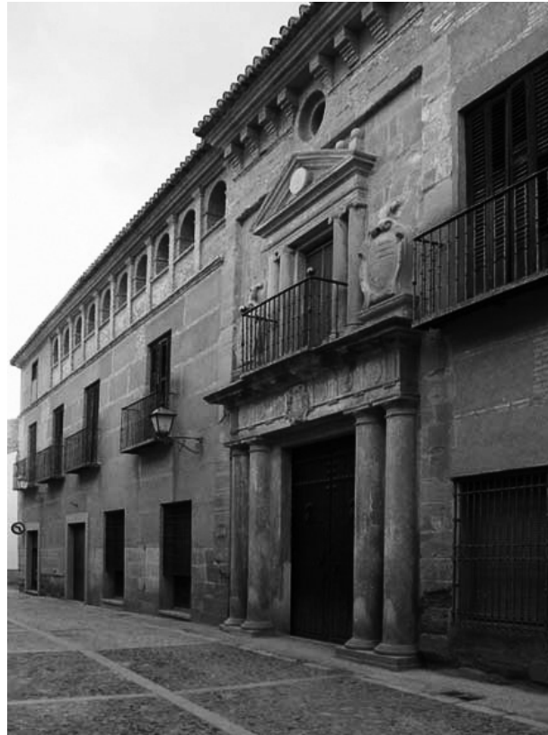
Palacio de los Ballesteros en Villanueva de los Infantes

Una vez analizado el espacio el autor se adentra en la visión de los hidalgos en el Quijote y los hidalgos del Campo de Montiel . A fines del S. XVI, hidalgo es el que tiene solar y linaje conocido. Para acceder a esta clase social existían dos vías: el linaje (hidalgo de ejecutoria y/o de privilegio por concesión real) o la fortuna (hidalguía de privilegio por compra), con el paso del tiempo la forma de acceder se fue ampliando. Sin olvidar que el término de linaje y nobleza se refiere a la honra, respeto y estimación que gozaba una persona o familia determinada por la forma de ser y actuar en un pueblo. El héroe de la novela es un miembro de este grupo social y Cervantes trata la hidalguía y el mundo de los hidalgos de manera auténtica. No es casualidad ni mera descripción literaria lo que dice o pone en boca de sus personajes, está escrito intencionadamente. Campos muestra a través del Quijote las situaciones y escenarios en los que Cervantes refleja la condición de hidalgo. Los cuales fuera por conveniencia literaria o por razones personales fija el comienzo del