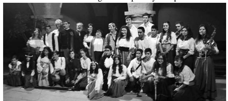
Grupo de actores y músicos que amenizaron el Mercado Cervantino