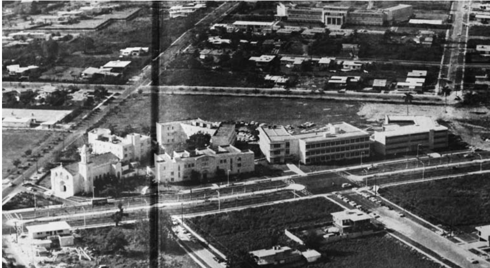
Vista aérea de la Universidad

En 1950 el Congreso de la República aprobaba con la ley número 15, la personalidad jurídica y académica de las universidades y centros de altos estudios privados 33 . El nuevo código instaura la personalidad jurídica de esta Universidad y abre una nueva etapa en la vida académica del país. Ahora se podían diseñar planes