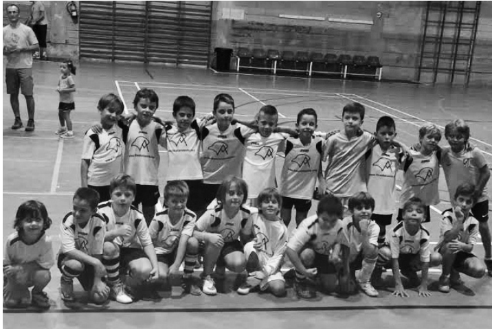
Equipo sub-8 Finca La Cuesta

>>> Nos quedábamos al cierre de la pasada edición con el Maratón Infantil Mixto de Fútbol Sala, disputado los días 13 y 14 de Agosto , y que en esta ocasión contó con 21 equipos distribuidos en las 3 categorías: Sub-8 (5 conjuntos); los Sub-11 (7) y la categoría Sub-14 (con 9).