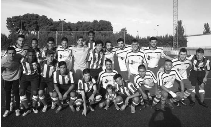
C.F. Infantes con el Atlético de Madrid Juvenil

>>> Las Pruebas de Natación también tuvieron su cabida en la Piscina Municipal como ya es costumbre todas las ferias.