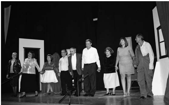
Grupo de Teatro del Centro Día "Casa de Don Manolito"