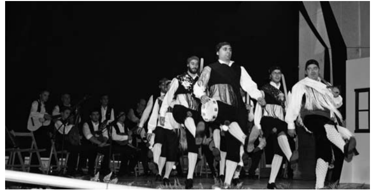
Danza de las Espadas

A continuación los diferentes grupos participantes en la Muestra procedieron al intercambio de regalos: Grupo de Coros y Danzas "Villa Seca" de La Seca, Valladolid, Asociación Folclórico Musical "El Lagar" de Socuéllamos, Asociación Cultural Folclórica Recreativa "Manuel de Falla", de Villacañas, y el grupo anfitrión, Asociación de Folclore y Tradición "Cruz de Santiago", que actuó en primer lugar presentando una seleccionada muestra de su repertorio.