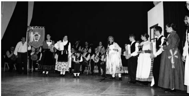
Intercambio de obsequios entre los grupos participantes en la Muestra

Habló así mismo de nuestro patrimonio inmaterial, vivo y relevante donde se han mantenido y conservado en consonancia, ritos ancestrales junto a otros de reciente creación. Por ello aún es posible contemplar al recorrer el Campo de Montiel diferentes fiestas donde la presencia de músicos y danzantes es algo muy relevante, como en la obra del Quijote.