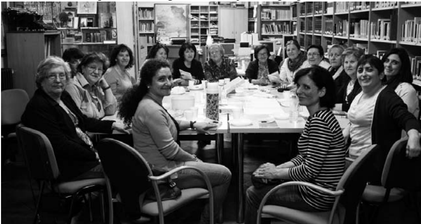
Taller de Lectura de personas adultas

Días antes concluyó el Taller de Lectura dirigido a personas adultas en su edición 2013 que ha conseguido los objetivos propuestos.