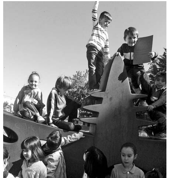
Alumnos en la escultura "El Barco de Rubén Darío"

Finalizando el proyecto relizaron talleres de modelaje con plastilina de las distintas esculturas observadas.