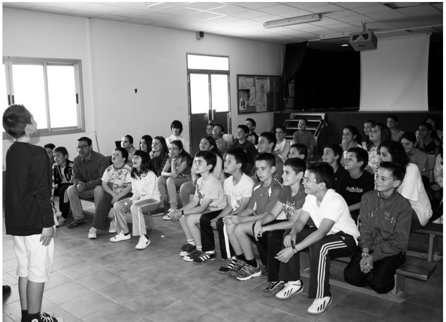
Alumnos participantes en uno de los talleres

El objetivo de esta iniciativa, que va dirigida a escolares de 4º, 5º y 6º de educación primaria, es que todos los conceptos que se aprendan se trasladen a los entornos más inmediatos como la familia y los amigos. Los talleres llevan detrás un trabajo pedagógico en el que el profesorado es una parte fundamental. Con el teatro se consigue que los valores se adquieran de una forma amena y divertida.