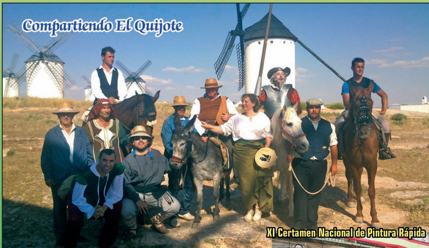
Compartiendo El Quijote

GRUPO DE PRENSA "BALCÓN DE INFANTES" Periódico Local. - D.L. C.R. 463/92 - III Época - Año XXI - Nº 250 - JUNIO 2013