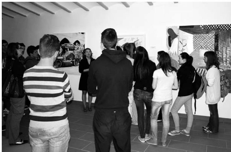
Uno de los grupos visitantes de la exposición

'El Mercado' ofrece visitas guiadas concertadas para grupos a través del teléfono 926 361 321.