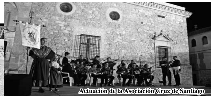
Actuación de la Asociación Cruz de Santiago