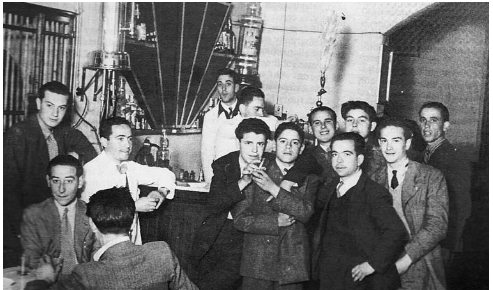
Bar Cervantes o de Cascales

El bar estaba casi siempre en penumbra, pues el local era estrecho y largo y la única luz diurna entraba tamizada por la puerta de cristales que daba a la calle y una pequeña ventana a su lado.