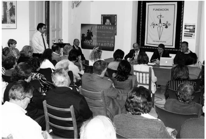
Acto de presentación del Festival Internacional de Música Clásica 2013

El espacio de La Alhóndiga acogerá un total de seis conciertos que contarán con artistas de la talla de Manuel Blanco (trompeta solista de la Orquesta Nacional de España), Antonio Serrano (armónica) o la Orquesta Filarmónica de La Mancha en su versión