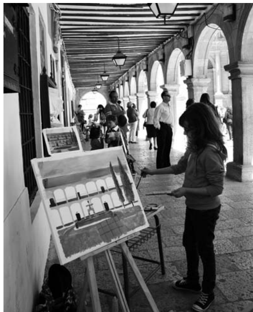
Participantes en el Certamen Infantil

Los participantes se dispusieron por los más variados rincones del municipio para transferir a sus lienzos los parajes, rincones, monumentos, patios y calles que merecían ser immortalizadas. La Plaza Mayor “presunta cómplice”, posó majestuosa como siempre, gozando del protagonismo de ser recreada desde todas las perspectivas.