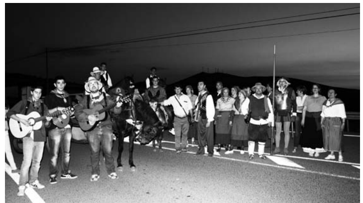
Atardecer de la primera jornada en Alhambra