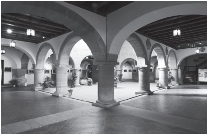
Pósito o Alhóndiga