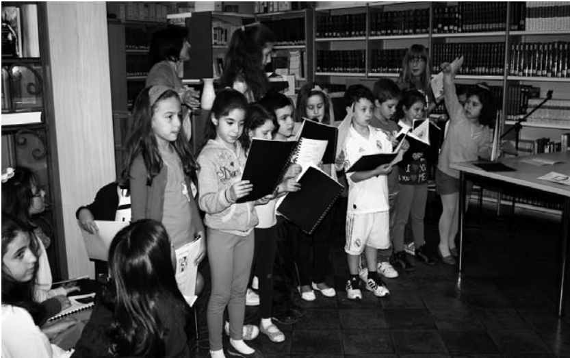
Uno de los grupos de escolares integrantes de los Talleres de lectura

Una tarde de cuentos donde los escolares de primaria integrantes de los talleres de lectura de la Biblioteca Municipal "Quevedo" de Villanueva de los Infantes, hicieron disfrutar al público con lecturas dramatizadas de cuentos, fábulas y clásicos de la literatura universal como Los tres cerditos, Caperucita, La Cenicienta, Las mil y una noches, Mujercitas, Los tres mosqueteros, Romeo y Julieta, Moby Dick, Rinconete y Cortadillo, Lazarillo de Tormes o El fantasma de Canterville, entre otros.