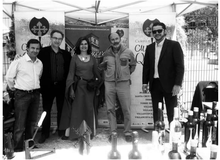
Los alcaldes de ambos municipios junto a representantes de Turinfa en el stand que dispuso Villanueva de los Infantes en el festival medieval de Les Pennes Mirabeau

Por su parte, el Cónsul General de Marsella, Rafael Valle Garagorri, se ha ofrecido como interlocutor para facilitar intercambios comerciales entre ambos países, poniendo a disposición de las dos