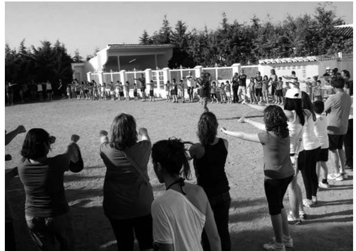
Padres y alumnos del García Bellido disfrutaron de las actividades programadas por el AMPA

Por último, el mismo domingo 16, el AMPA invitó a sus asociados a una comida en el albergue de las Siervas de Jesús, lugar en el que también se estaba desarrollando el campamento. En torno a 200 personas asociadas pudieron compartir la comida, así como una degustación de postres que elaboraron las familias participantes. Posteriormente se desarrollaron diferentes juegos y actividades en los que participaron las familias conjuntamente, a pesar de la jornada de intenso calor que fue atenuado con un refrescante baño en la piscina.