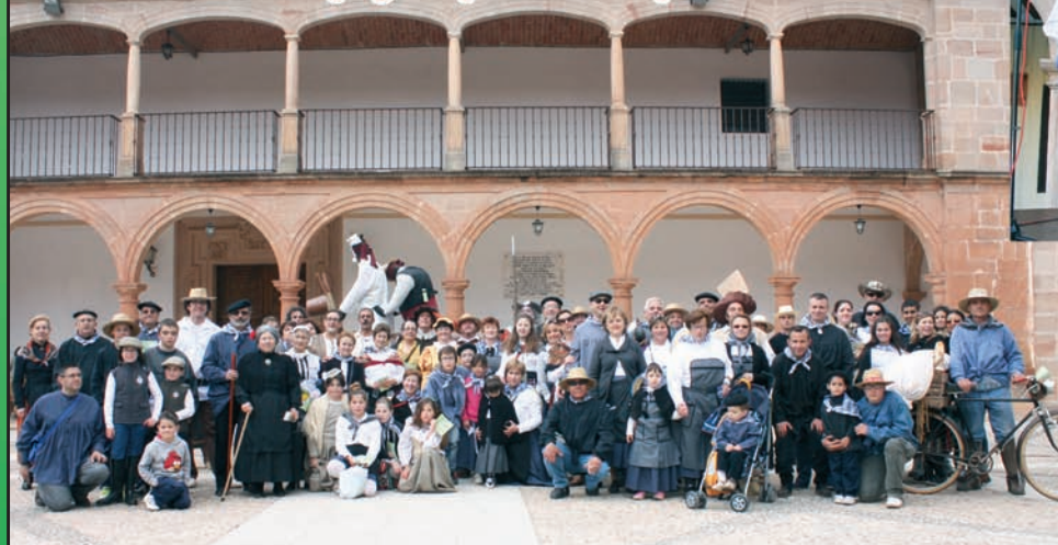
IX Ruta "Don Quijote por el Campo de Montiel"