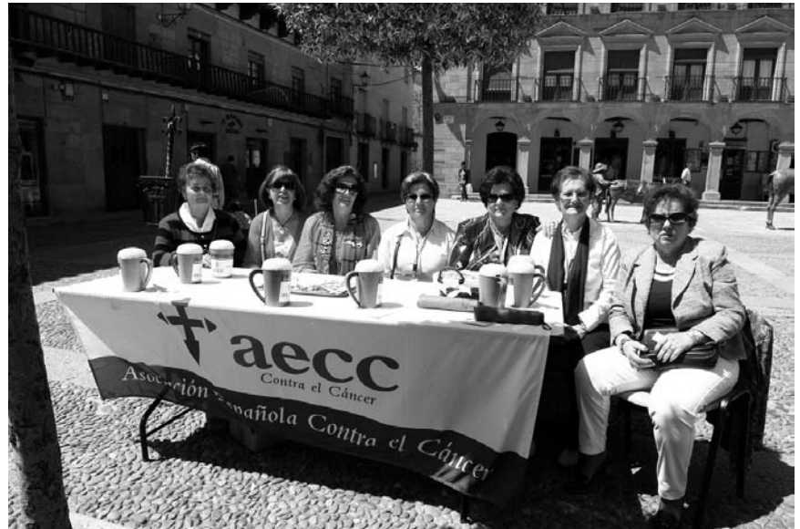
Mesa para la cuestación situada en la Plaza Mayor

La Junta local quiere agradecer a todos los infanteños e infanteñas su colaboración, así como a las entidades y cofradías que también realizan sus aportaciones, sin olvidar al medio centenar de voluntarias que cada año dedican parte de su tiempo a esta causa solidaria.