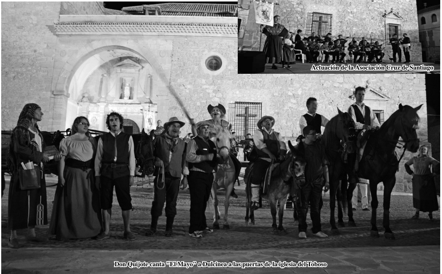
Don Quijote canta “El Mayo” a Dulcinea a las puertas de la iglesia del Toboso