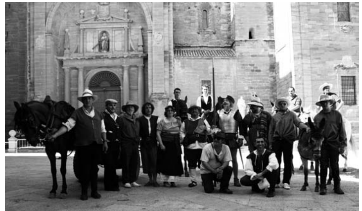
Comitiva a la salida en la Plaza Mayor