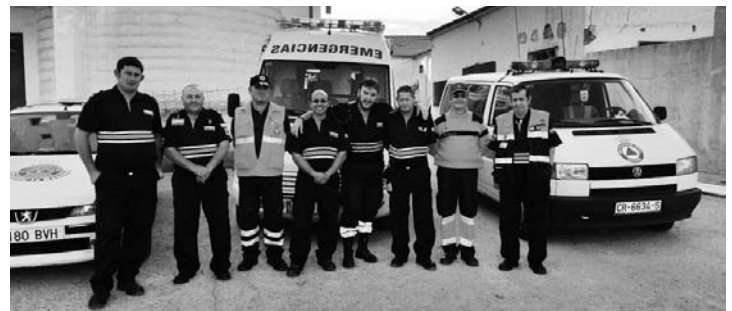
Grupo de Protección Civil que siguió con gran eficacia la Ruta de Patios y Carruajes

Todas estas propuestas forman parte del total de 58 citas que desarrollan el saber alrededor de la tierra de El Quijote, impulsadas por la Plataforma Campo de Montiel hasta el 24 de octubre, en este proyecto patrocinado por la Diputación Provincial, y con implicación de los 23 municipios, de la comarca histórica, con sus ayuntamientos y asociaciones: Albaladejo, Alcubillas, Alhambra, Almedina, Carrizosa, Castellar de Santiago, Cózar, Fuenllana, La Solana, Membrilla, Montiel, Ossa de Montiel, Puebla del Príncipe, Ruidera, San Carlos del Valle, Santa Cruz de los Cañamos, Terrinches, Torre de Juan Abad, Torrenueva, Villahermosa, Villamanrique, Villanueva de la Fuente y Villanueva de los Infantes.