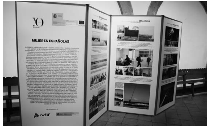
Uno de los paneles que componen la exposición