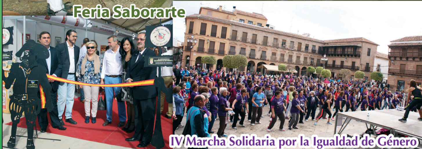
IV Marcha Solidaria por la Igualdad de Género