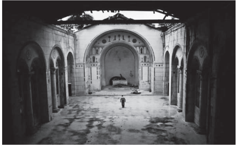
Estado actual ruinoso de la capilla