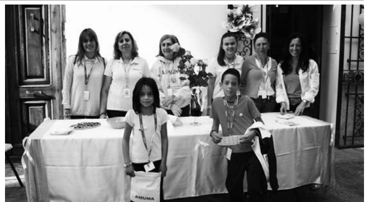
Mesa Petitoria en beneficio de la lucha contra el cáncer de mama

AMUMA, Asociación de Cáncer de Mama y Ginecológico de Castilla la Mancha, se fundó en 1997 y en sus objetivos está aumentar la calidad de vida de las mujeres afectadas, defender sus derechos sociales y sanitarios, conseguir dentro de la sanidad pública los medios técnicos de última generación y un mejor diagnóstico. Entre los servicios que presta se realizan talleres, atención psicológica, terapias, etc.