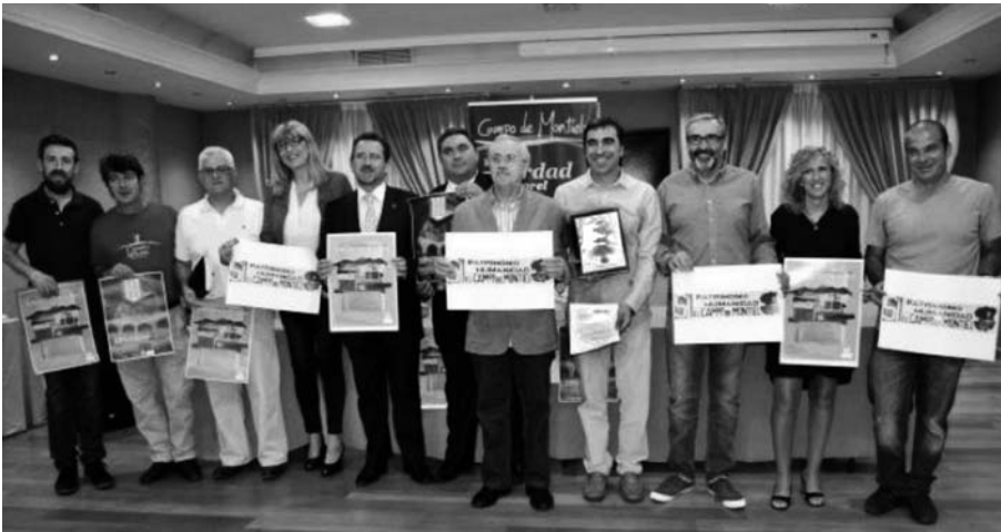
Representantes de la Plataforma y Autoridades tras la rueda de prensa

Para la Plataforma merece la pena destacar y preservar un territorio de paso clave entre Levante, Castilla y Andalucía, en el que se fijaron escritores de fama universal como Jorge Manrique, Cervantes, Quevedo o Lope de Vega, donde nacieron históricos personajes como el gramático Bartolomé Jiménez Patón, el pintor Fernando Yáñez de la Almedina o Santo Tomás de Villanueva, o donde empezaron a recorrer sus aventuras personajes de ficción tan universales como Don Quijote y Sancho.