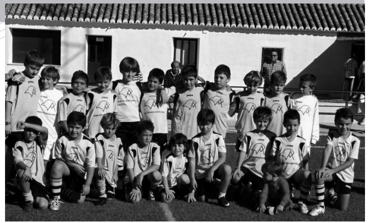
Benjamines de los equipos de La Cuesta A y B

En Copa Plata, el Carmen Daimiel “A” venció en los penaltis al equipo solanero de Informática Alhambra en la final, mientras