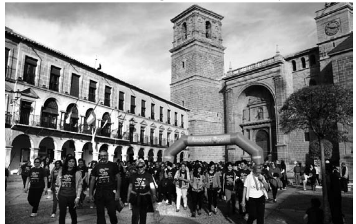
IV Marcha Solidaria por la Igualdad de las Mujeres