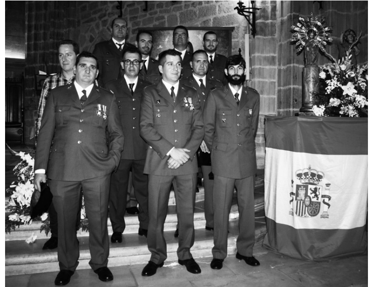
Miembros del acuartelamiento de la Guardia Civil en el día de su patrona

Esta mañana, y como viene siendo habitual cada 12 de octubre, la Guardia Civil de Villanueva de los Infantes ha celebrado el día de su patrona, la Virgen del Pilar. Una jornada que comenzaba con la celebración de la Santa Misa en la Iglesia Parroquial de San Andrés Apóstol. A continuación, los miembros de la Guardia Civil, acompañados de autoridades, familiares y amigos, se trasladaban a la Alhóndiga para conmemorar la festividad con un pequeño aperitivo.