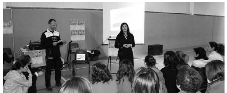
Taller "Beneficios del deporte en la salud de las mujeres"

Entre los patrocinadores se encuentran también el Instituto de la Mujer de CLM, la Cooperativa Ntra. Sra. de la Antigua y Santo Tomás de Villanueva, Deportes Cronos y Atmósfera Sport.