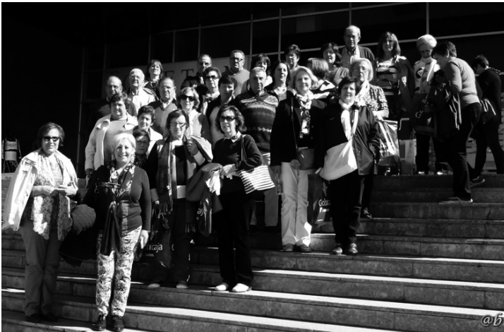
Foto del grupo a las puertas de FARCAMA