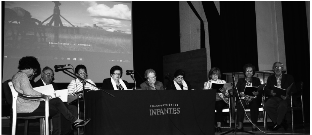
Grupo de intérpretes del Recital de Lecturas Dramatizadas

Con un excelente montaje de imágenes y música a cargo de Calambur Experience, que colaboró así con el acto, se dramatizaron nueve pasajes del Quijote: desde "El Hidalgo de la Mancha. Nombramiento de Don Quijote" hasta "Los juicios del Gobernador Sancho Panza", pasando por "¿Molinos o gigantes?", "Don Quijote en conversación con Vivaldo. Dibujo de Dulcinea", "De vuelta a casa. Sancho conversando con Teresa Panza", "El Caballero del Verde Gabán", o las "Bodas de Camacho".