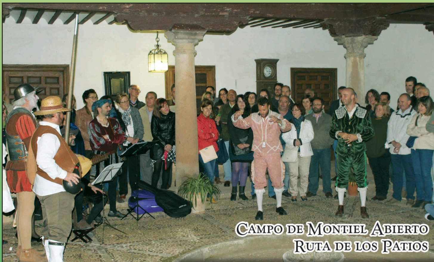
CAMPO DE MONTIEL ABIERTO RUTA DE LOS PATIOS

GRUPO DE PRENSA "BALCÓN DE INFANTES" Periódico Local. - D.L. C.R. 463/92 - III Época - Año XXIII - Nº 278 - OCTUBRE 2015