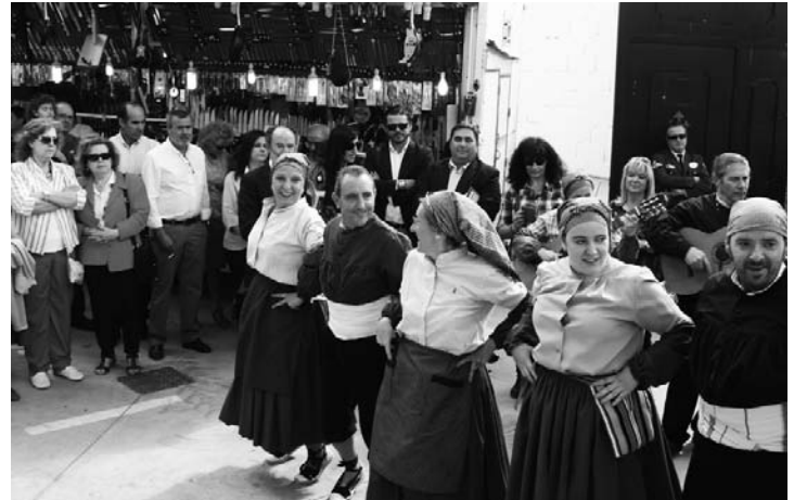
La Asociación Cruz de Santiago también participó en la jornada de inauguración de la Feria

Durante los días de la feria se han programado actividades teatrales, talleres artesanos, animación infantil, degustaciones de productos gastronómicos y cocina en vivo, sorteos y catas comentadas que han hecho las delicias de los visitantes, sin olvidar el acompañamiento musical folclórico de la Asociación Cruz de Santiago o la actuación del trío musical del domingo por la noche.