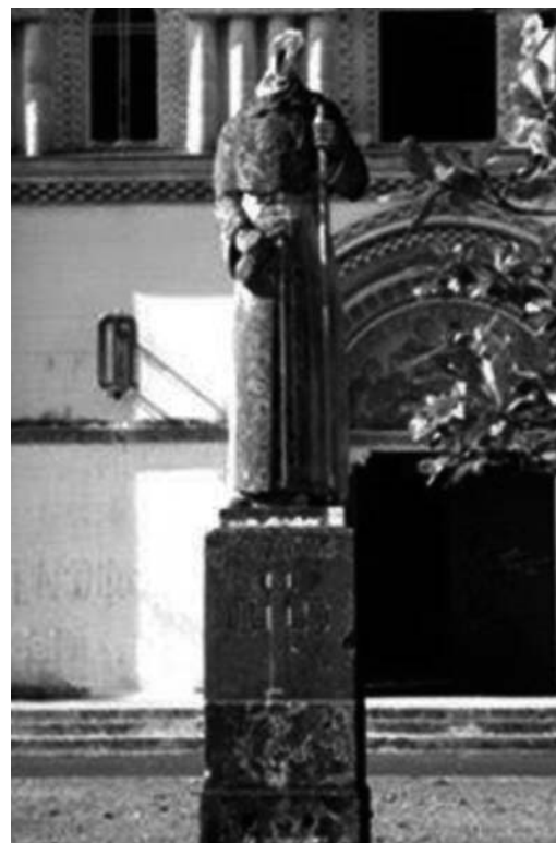
Estatua de Sto. Tomás parcialmente destruida

garante de la más rica concurrencia de escuelas de pensamiento en Cuba; para otros, es altar y símbolo del martirologio contemporáneo. Recibió el estertor rectorado, el obispo monseñor Eduardo Boza Masvidal -camagüeyano de nacimiento-, quien a posteriori e involuntariamente, fue incluido en una relación de 131 sacerdotes condenados a presuroso destierro, una fatídica noche que anunciaba la proximidad de un huracán, el domingo 17 de septiembre de