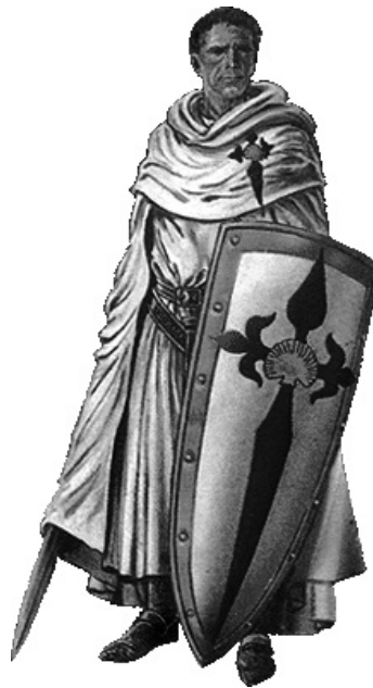
Caballero de la Orden de Santiago

El maestre don Enrique fue también un caballero enamorado, al que no resultó fácil casar con la infanta Catalina. Un matrimonio sin fisuras, roto por la muerte de ella cuando después de años de espera alumbró a un niño, que nació muerto. El marqués de Santillana utiliza también el recurso de la tristeza amorosa ante el enorme dolor de don Enrique.