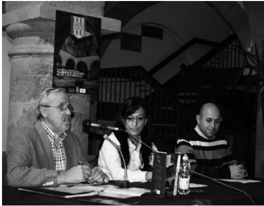
Presentación de la Ruta de los Patios

La 3ª Ruta de Patios en Villanueva de los Infantes, organizada por la Plataforma del Campo de Montiel, alcanzó niveles de afluencia de público al que no se había llegado en ediciones anteriores, y resultó un éxito sin precedentes.