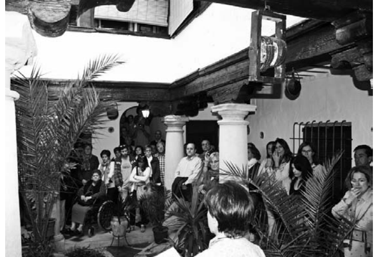
Patio de la Casa de la Pirra, uno de los patios abiertos

El mismo día y por la noche, con la asistencia de su alcalde, se efectuó una visita por las calles de La Solana, con importante afluencia de gente. Desde su monumental Plaza Mayor se visitó