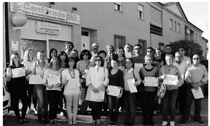
Alumnos de los cursos acompañados de autoridades

El Alcalde también se manifestó del lado de la formación, quien demanda más formación en materia de turismo y aseguró que "uno de los ejes de nuestro futuro está en el turismo". "Ne-