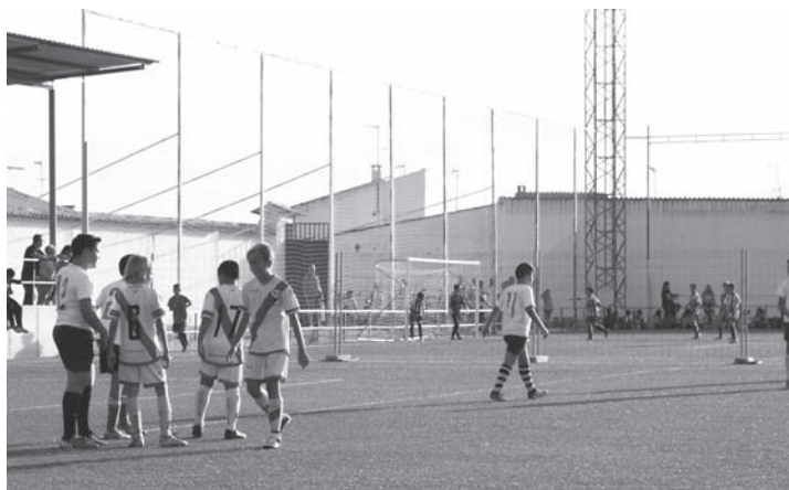
Uno de los partidos del Torneo disputado el pasado mes de Septiembre

Las ligas locales de pádel y fútbol sala están próximas a comenzar y ya informaremos del desarrollo de las mismas, que significan una gran alternativa deportiva para los muchos practicantes invernales de la localidad.