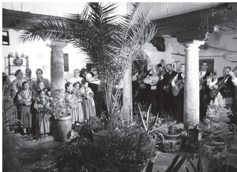
Actuación de la Cruz de Santiago en la Casa de la Pirra