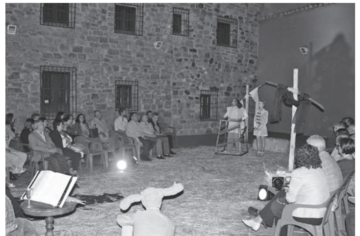
Auto de fe sobre Quevedo en Torre de Juan Abad

Al día siguiente la ruta Torre del Castillo, en Puebla del Príncipe, yacimientos de la Ontavia y Villa Romana del Calvario, en Terrinches, Villa Romana de Puente de la Olmilla en Albaladejo, tramo de la Vía Augusta en Sta. Cruz de los Cañamos para finalizar con la visita al yacimiento de Mentesa Oretana en Villanueva de la Fuente.