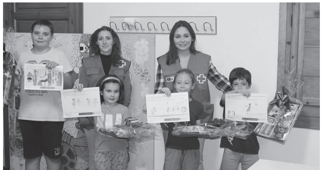
Ganadores del concurso de dibujo acompañados de miembros de Cruz Roja

Desde la Asamblea de Cruz Roja local, situada en la calle Don Tomás el Médico, 48, han señalado que el número de actividades va en aumento por lo que hacen un llamamiento a la población para que participe y colabore como voluntarios, consiguiendo llegar así a más personas. Las personas interesadas pueden contactar en los teléfonos 926 378 118 o 926 312 237.