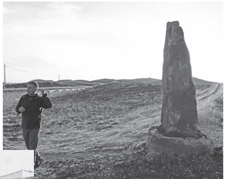
Monolito que indicará la dirección hacia el Suspiro de Sancho

La jornada finalizó al atardecer en el "Suspiro de Sancho", en las Cabezas de Fuenllana, señalado con la instalación de un monolito, y un recital de música en el punto geodésico a cargo de Trovalleros, clausurando así el Programa Campo de Montiel Abierto 2016.