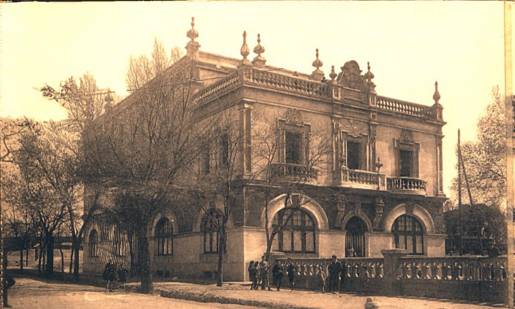
Biblioteca Virtual de Castilla-La Mancha. Libros, 1920 - Serie de postales de Ciudad Real