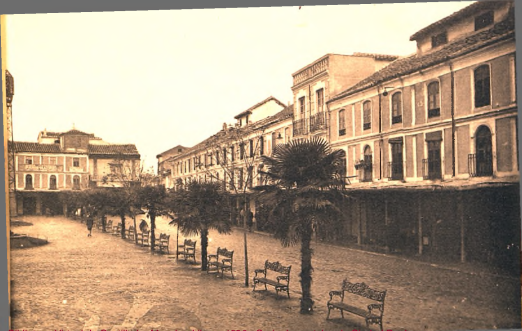
Biblioteca Virtual de Castilla-La Mancha. Libros, 1920 - Serie de postales de Ciudad Real