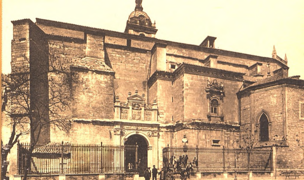
Biblioteca Virtual de Castilla-La Mancha. Libros, 1920. Serie de postales de Ciudad Real