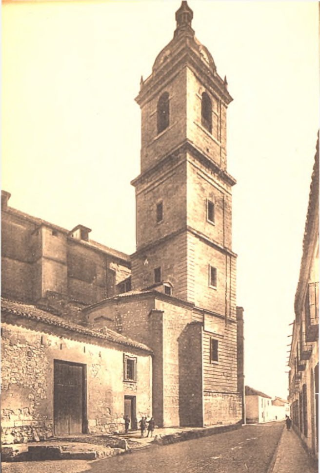
Biblioteca Virtual de Castilla-La Mancha. Libros, 1920 - Serie de postales