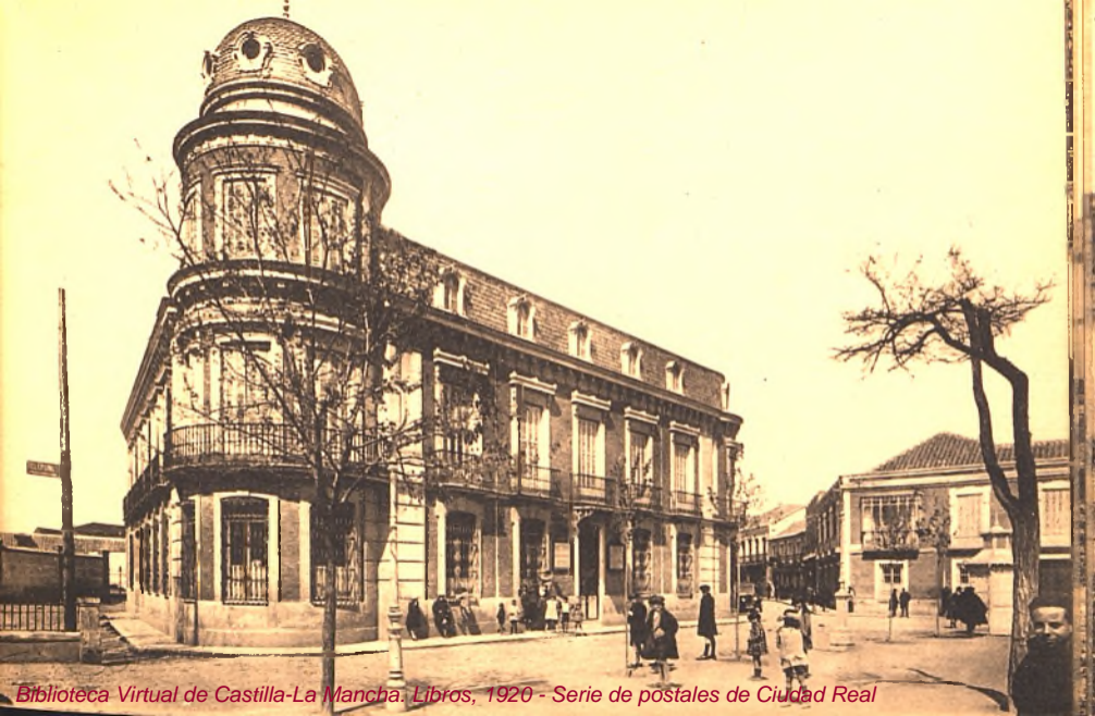
Biblioteca Virtual de Castilla-La Mancha. Libros, 1920 - Serie de postales de Ciudad Real