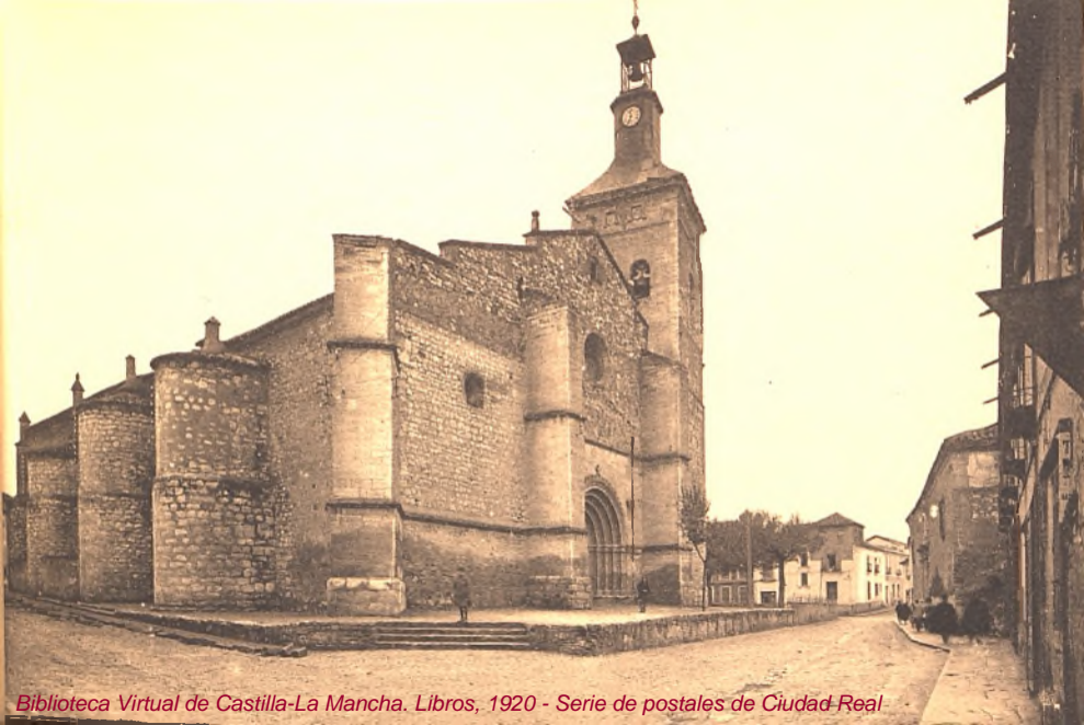
Biblioteca Virtual de Castilla-La Mancha. Libros, 1920 - Serie de postales de Ciudad Real