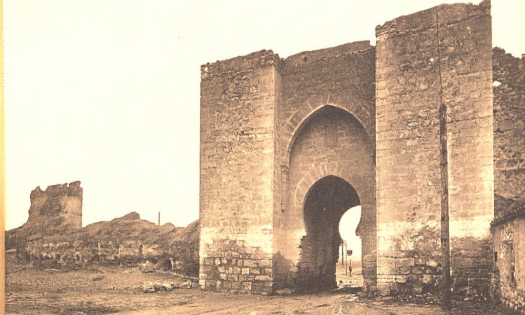
Biblioteca Virtual de Castilla-La Mancha. Libros, 1920 - Serie de postales de Ciudad Real