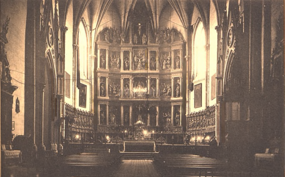
Biblioteca Virtual de Castilla-La Mancha. Libros, 1920 - Serie de postales de Ciudad Real