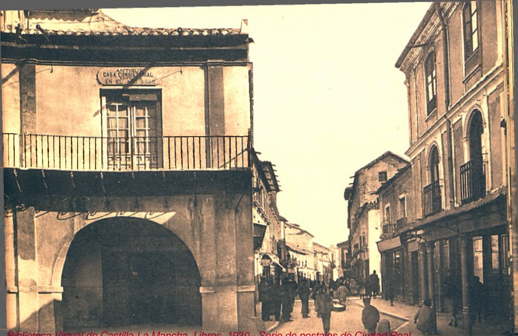
Biblioteca Virtual de Castilla-La Mancha. Libros, 1920 - Serie de postales de Ciudad Real