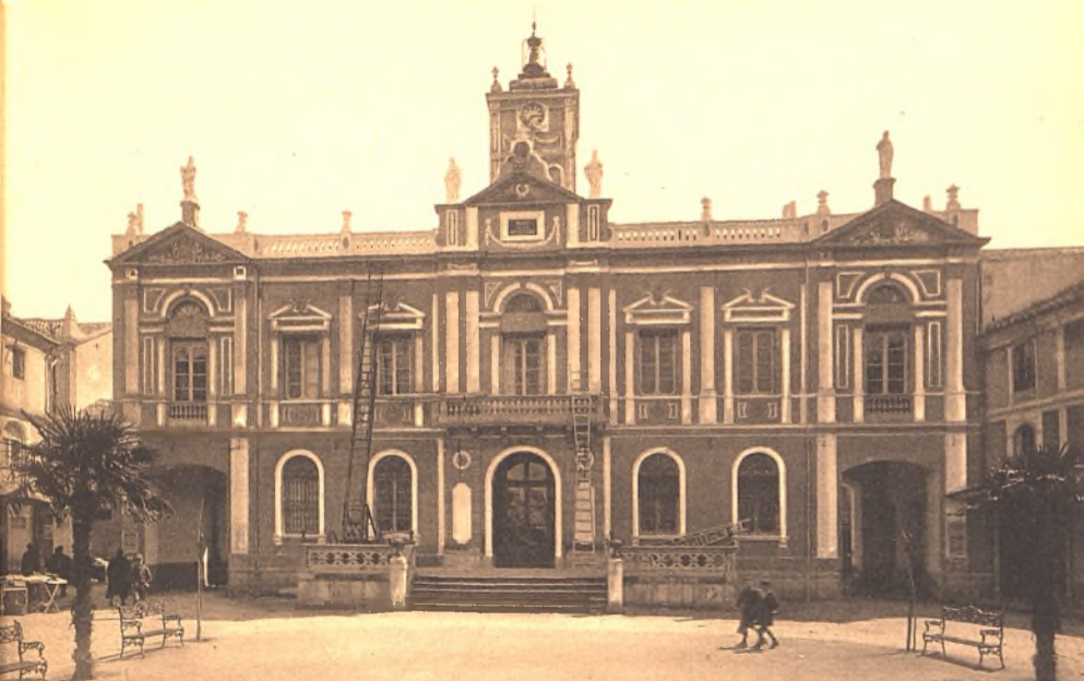
Biblioteca Virtual de Castilla-La Mancha. Libros, 1920 - Serie de postales de Ciudad Real