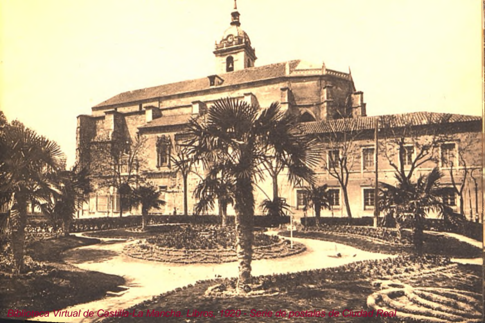
Biblioteca Virtual de Castilla-La Mancha. Libros. 1920 - Serie de postales de Ciudad Real