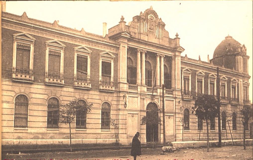
Biblioteca Virtual de Castilla-La Mancha. Libros, 1920 - Serie de postales de Ciudad Real