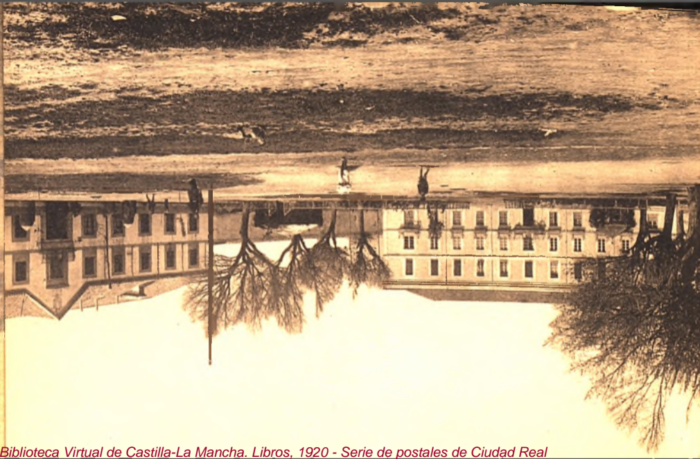
Biblioteca Virtual de Castilla-La Mancha. Libros, 1920 - Serie de postales de Ciudad Real