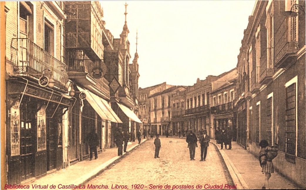
Biblioteca Virtual de Castilla-La Mancha. Libros, 1920 - Serie de postales de Ciudad Real