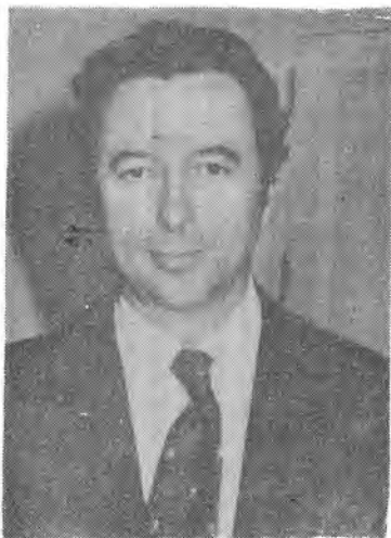
D. Alberto Oliart Saussol, nuevo Ministro de Sanidad