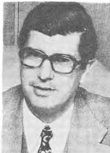
D. Juan Rovira Tarazona, que ha sido relevado de su cargo

Alberto Oliart Saussol toma las riendas de este difícil Ministerio de Sanidad por el que los sanitarios veníamos luchando desde tiempo inmemorial por su creación y, sería lamentable que la opinión se generalice en el sentido de añorar al Ministerio de Trabajo. La realidad que ese tomar tierra de los diferentes equipos dirigentes, imposibilita la obtención de resultados y la resolución de la problemática existente y, los que tenemos responsabilidades representativas vemos como se deteriora la credibilidad de nuestros representados, como consecuencia del paso del tiempo sin resultados tangibles o evidentes.