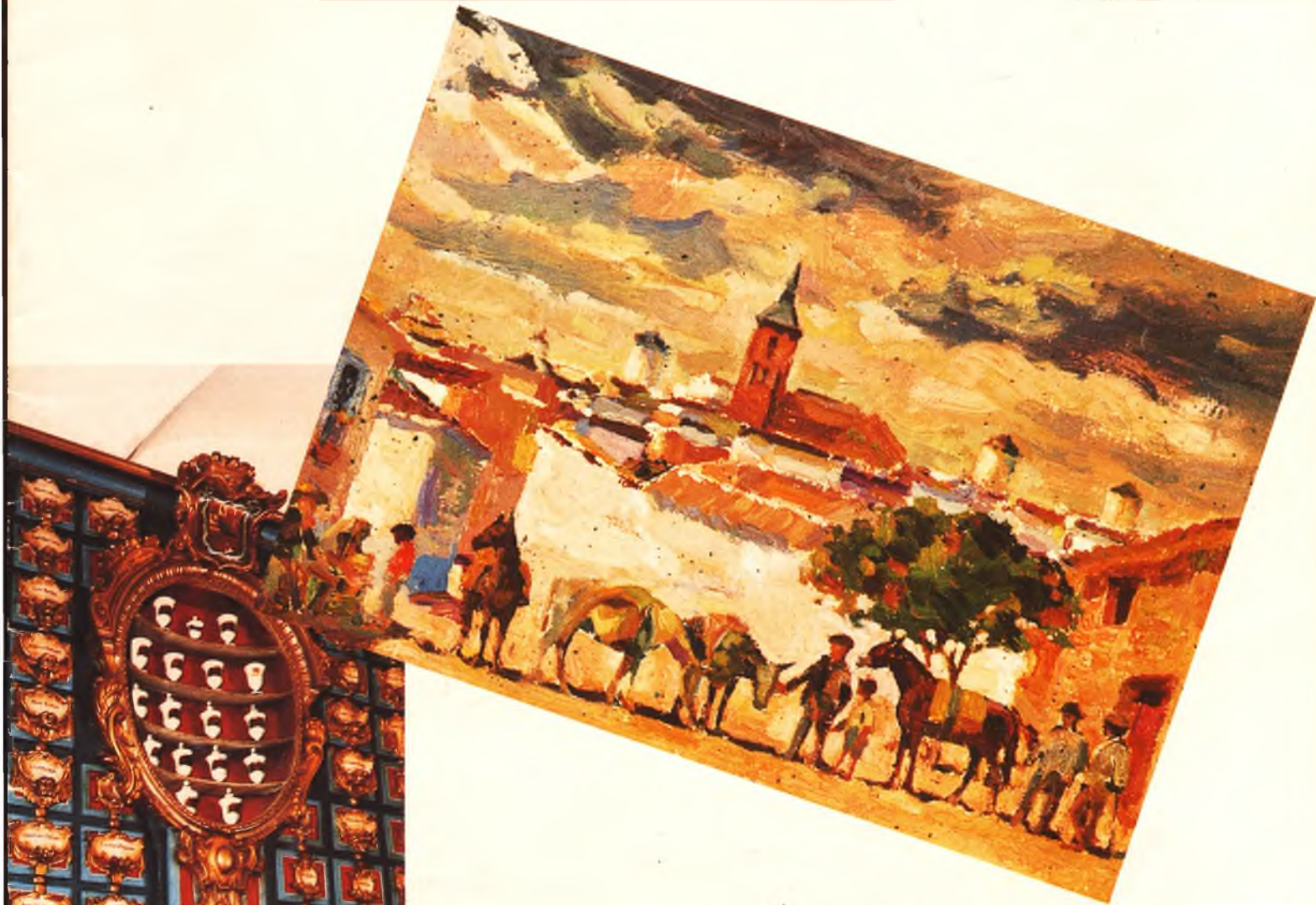
▲ Arrieros de la Tercia. Campo de Criptana. Oleo de Isidro Antequera

BOLETIN DEL COLEGIO OFICIAL DE MEDICOS DE LA PROVINCIA DE CIUDAD REAL • N.º 143 - MAYO-JUNIO 1989