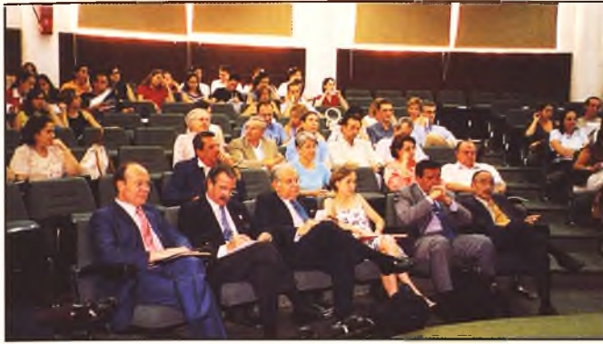
Ponentes y alumnos en el acto de inauguración