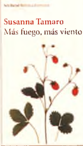
Susanna Tamaro Más fuego, más viento