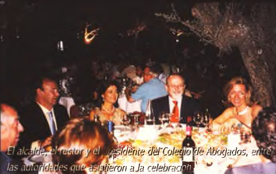
El alcalde, el rector y el presidente del Colegio de Abogados, entre las autoridades que asistieron a la celebración.