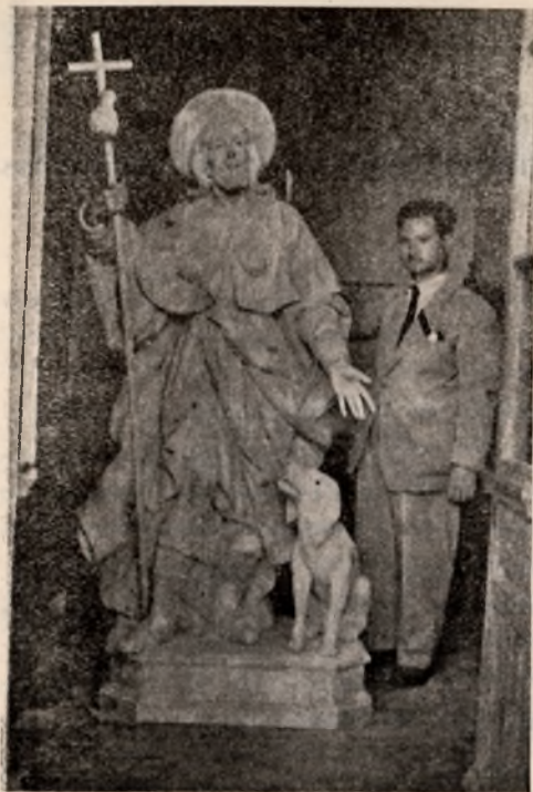
El escultor y su obra.