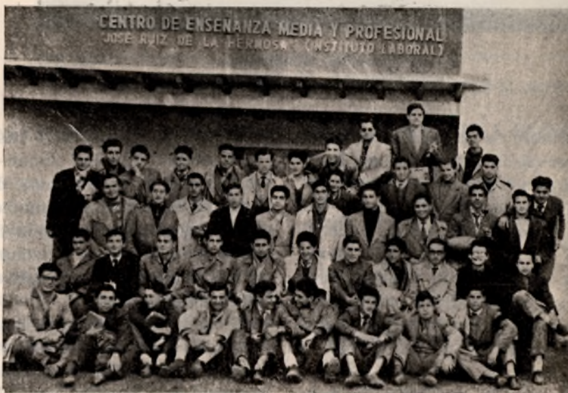
Grupo de alumnos del Primer Curso de Perfeccionamiento del Bachillerato Laboral.

aunque no se olvida el aspecto «práctico» en la mayoría de ellas. Y así, de acuerdo con normas de la superioridad, tienen un horario apretado y completo, a base de cuatro asignaturas diarias (clases de 3/4 de hora), que son las siguientes: Matemáticas, Física y Químicas aplicadas, Idioma moderno, Geografía (Geopolítica y Geografía de las grandes potencias