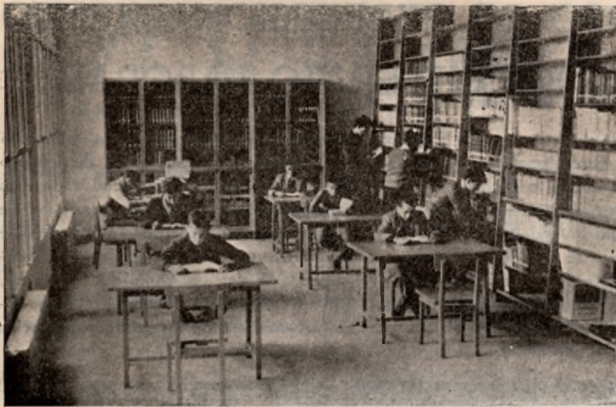
Aspecto general de la Biblioteca.

Al fondo, la vitrina cerrada con cristales y destinada a obras selectas