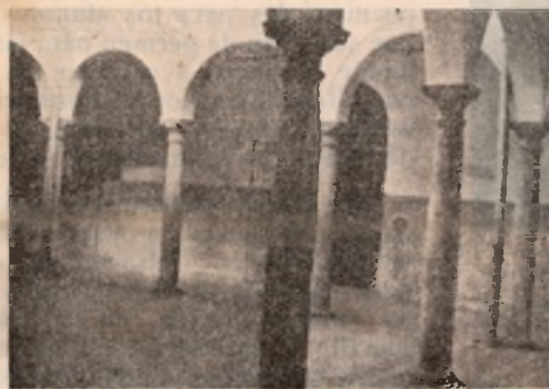
Patio del edificio en el que está instalado provisionalmente el Instituto Laboral de Manzanares.

Cincuenta alumnos se han matriculado en el primer curso