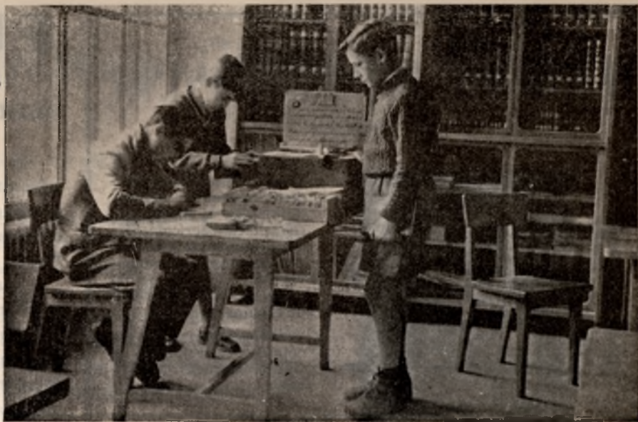
Los alumnos de cuarto y quinto cursos saben manejar los ficheros y colaboran en el servicio de préstamo de libros.