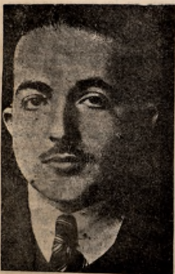
Excmo. Sr. D. Jesús Rubio Ministro de Educación Nacional

P OR disposición de la Jefatura del Estado ha sido designado titular del Ministerio de Educación Nacional, el excelentísimo Sr. D. Jesús Rubio García-Mina, caedrático de Derecho Mercantil de la Universidad Central y ex-Subsecretario de dicho departamento, en una larga y fecunda etapa de mando.