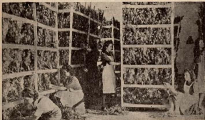
Camaradas de la Sección Femenina dedicadas a su labor en el Centro de Sericicultura, de Ciudad Real.

Merced a una campaña dirigida por la Falange femenina en las distintas zonas de la provincia, se ha logrado que varios Ayuntamientos se interesen por la plantación de moreras en sus respectivos términos municipales. Actualmente se gestiona la instalación de un vivero propio, con el fin de paliar las dificultades que surgen año tras año en la alimentación de los gusanos de seda, toda vez que cada temporada aumenta el número de personas interesadas en esta labor.