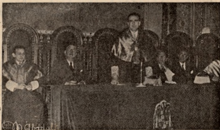
El Ministro de Educación Nacional, Excmo. Sr. D. Joaquín Ruiz-Giménez, pronuncia unas palabras en la clausura del Congreso

Se consideró del mayor interés el establecimiento de Organismos, análogos al de la Institución de Formación del Profesorado, en otras modalidades de la Enseñanza Media.