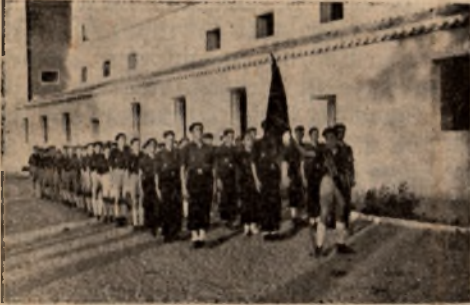
La Centuria «Manuel Carmona», del Instituto Laboral de Daimiel.