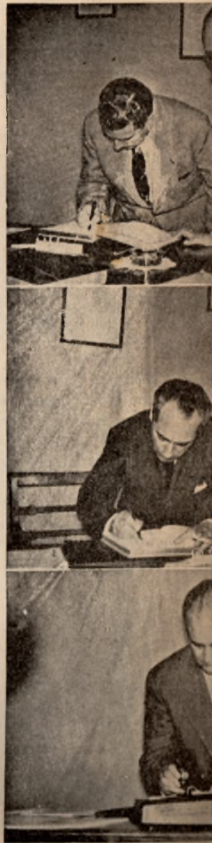
El ministro de Educación de rectoros Generales de Enseñanza estampan sus firmas en el