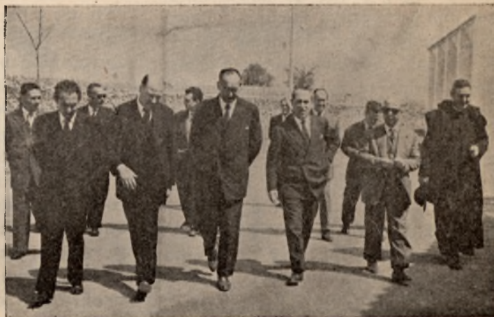
El Director General, con el Profesorado del Instituto, recorren el solar donde se harían posibles ampliaciones.