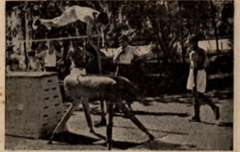
Uno de los ejercicios de Gimnasia Educativa: «Salto del tigre».

Con motivo del XVI aniversario de la liberación de Ciudad Real, la Delegación Provincial del Frente de Juventudes celebró dicha fecha con una magna concen-