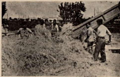
Los alumnos del Instituto Laboral alimentando la trilladora de la Granja-Escuela.