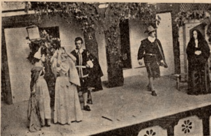
El deseo expuesto por el autor de este artículo, ha tenido cumplida realidad con la reciente representación en el Corral de Comedias de la obra de Lope de Vega «El acero de Madrid», por los alumnos de la Escuela Superior de Arte Dramático.

Extinguido ya el arrastrado sonsonete de los consonantes, yo me pregunto —y ello me preocupa— cómo podrá conservarse sin desdoro ese precioso teatrillo lugareño que constituye en sí todo un museo de nuestra escena. Sería una verdadera lástima que camiones o tinajas acabaran desahuciándolo y malograsen