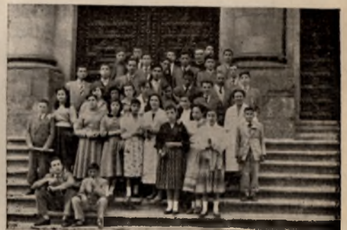
Un grupo de alumnos de ambos sexos de los Cursos de Extensión Cultural y Economía Doméstica, en la escalinata de la Iglesia de San Ildefonso, de Toledo.

Visitaron los monumentos artísticos más importantes de la Imperial ciudad, así como las gloriosas ruinas del Alcázar y otros centros relacionados con sus estudios y profesiones.