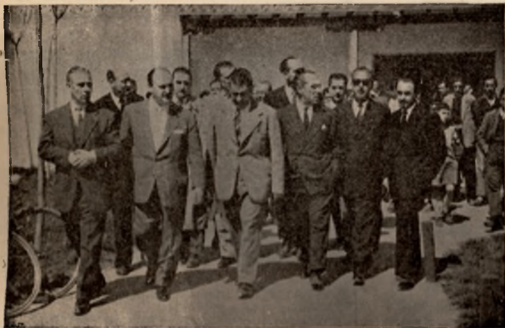
El ministro de Chile y acompañantes al salir del Gimnasio