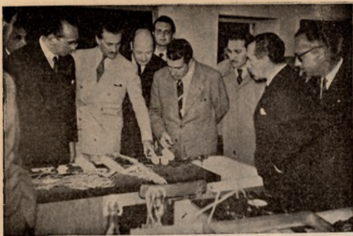
En el Laboratorio

E SCONDIDA entre el cúmulo de noticias de la sección «Vida del Centro», aparece en todos los números de GUADIANA una relación de señores visitantes, que se desplazan hasta Daimiel con casi la finalidad exclusiva de recorrer las distintas dependencias de su Instituto Laboral.