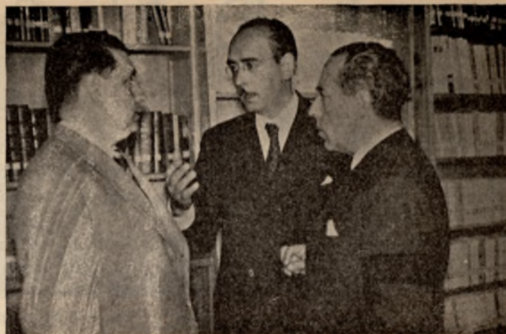
En la Biblioteca.

—Deseamos la creación de un Instituto Laboral en nuestro pueblo y, antes de realizar la oportuna gestión, hemos querido ver este de Daimiel, del que tanto y tan bien oímos hablar.