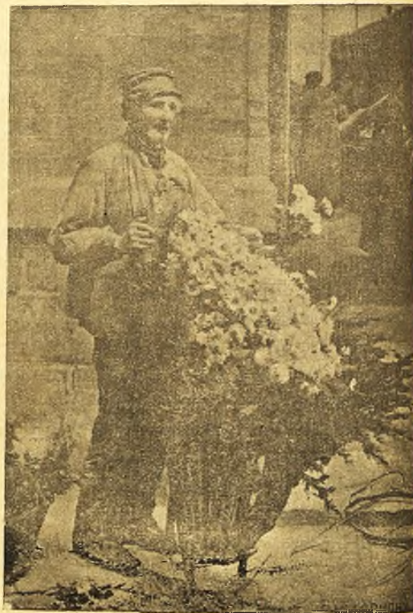
Vendedor de flores

Dificilillo es de hallar solución al problema que me planteas; pero á cambio de darte la que sólo tú debes escoger, te contaré en des-