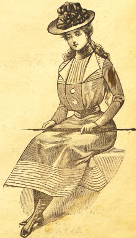
Traje para niña de 11 á 13 años.—De paño color tórtola. Una ancha cenefa plegada de raso color hueso, guarnece el bajo de la falda. Cuerpo blusa. Los delanteros están cerrados bajo un ancho plastrón, adornado con dos botones de nácar.

Esta Sección está á cargo de la elegante Revista La Ultima Moda.