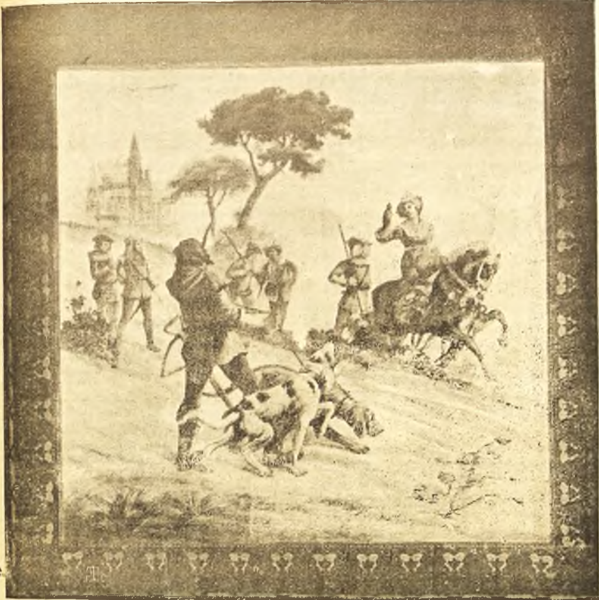
UNA MONTERÍA.—Tapiz de H D'Oliveiro.