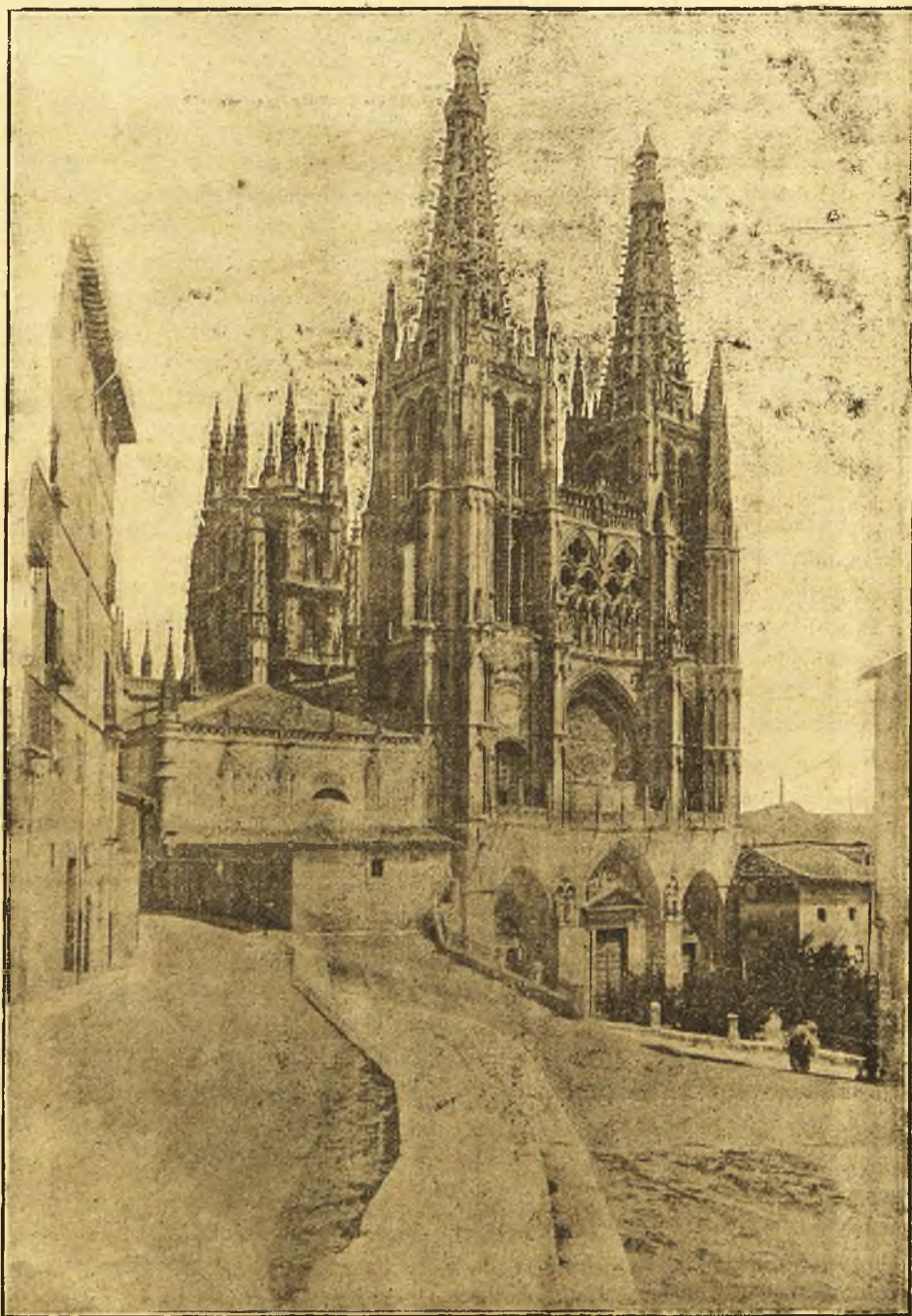
LA CATEDRAL DE BURGOS