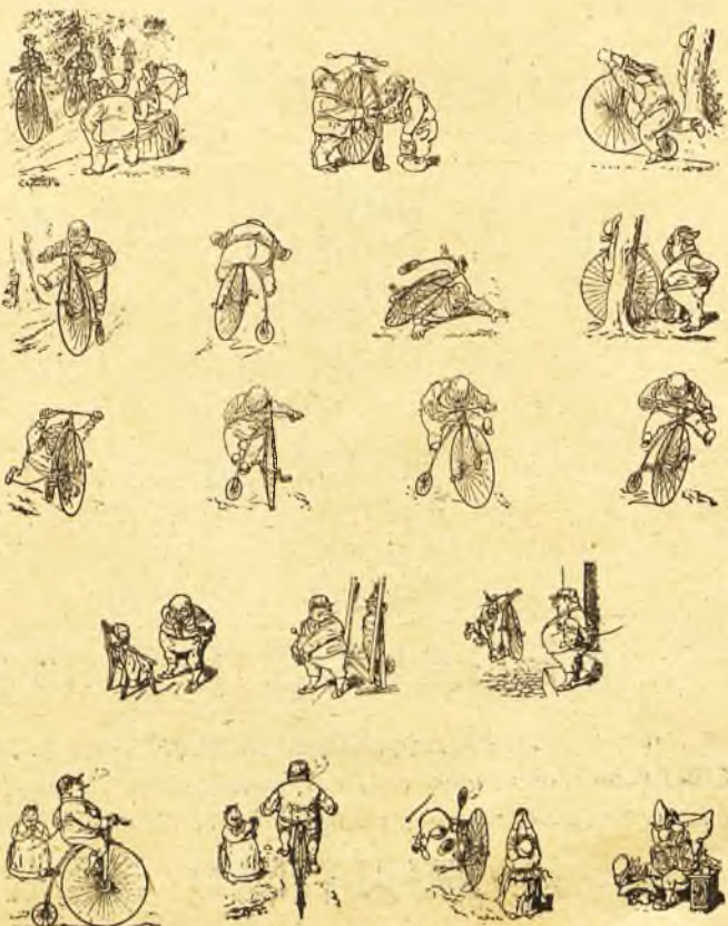
SPORT CICLISTA.—Historieta muda.

Con la quietud de los mares lucha el furor de los vientos; las alegrías del alma con los dolores acerbos; las miserias de la tierra