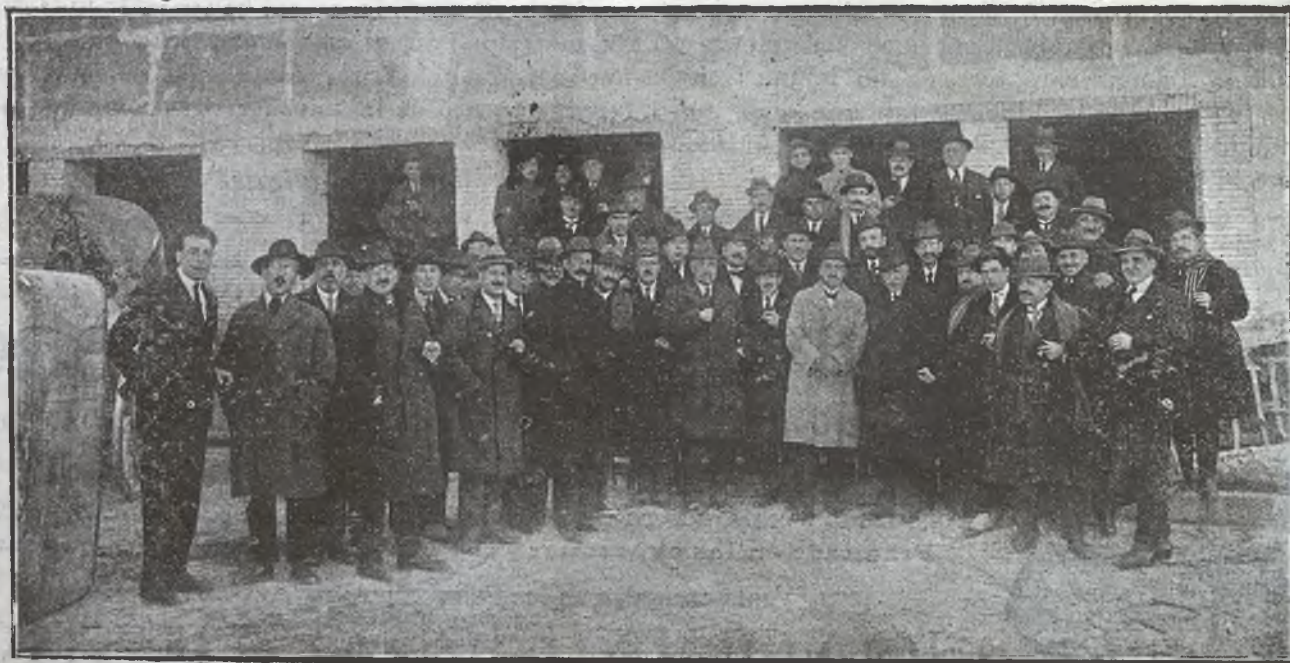
Fotografía tomada por nuestro Redactor gráfico Sr. Maján, de los asistentes al homenaje de D. Federico Escobar.