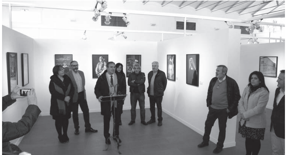
Acto de inauguración de la exposición "El Alma de Cervantes"

La Expo 'El Alma de Cervantes' logró reunir a nueve fotógrafos españoles en busca del alma de Cervantes entre los que se encuentran Premios Nacionales de Fotografía como Cristina García Rodero, Alberto García Alix, Juan Manuel Castro Prieto e Isabel Muñoz. A ellos se han sumado Chema Conesa, César Lucas, Juan Manuel Díaz Burgos, Jose Manuel Navia y Vicente López Tofiño, cada uno de los cuales nos muestra su