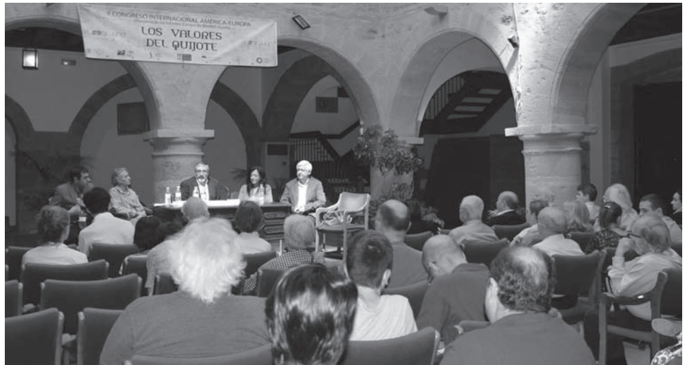
Un momento del Congreso en la Alhóndiga