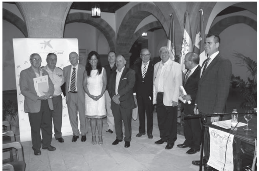
Homenajeados en el acto de Reconocimientos