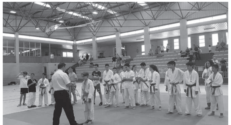
Entrega de medallas a los participantes del torneo

Desde la organización se envía el más sincero agradecimiento a todos los clubes participantes en este evento, así como a los familiares de los jóvenes deportistas, por su entrega y dedicación hacia ellos.