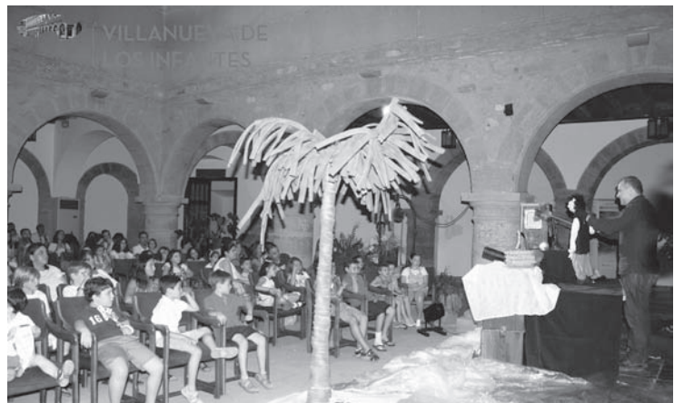
Una imagen de la escena en la Alhóndiga

La función forma parte de la programación de la Red de Artes Escénicas y Musicales de la Primavera 2017 en Castilla-La Mancha a través del Teatro de la Sensación.