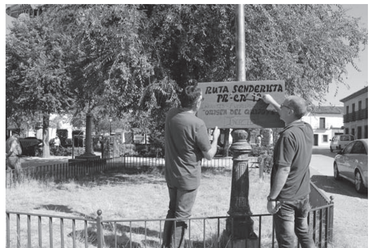
Señalización de la Ruta Senderista en la Fuente Vieja

caciones para realizar la ruta están recogidas en un folleto que se facilita en la Oficina de Turismo o en soporte electrónico que puede descargarse de la web www.villanuevadelosinfantes.es