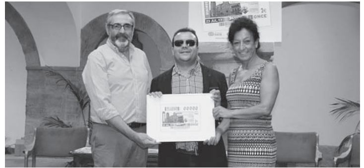
Acto de presentación del cupón de la ONCE en la Alhóndiga

Estas localidades se integran en la Asociación de los Pueblos