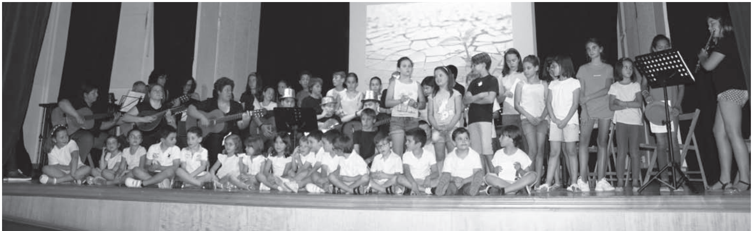
Alumnos de la Escuela de Municipal de música en el concierto de clausura

Alumnado de la Escuela Municipal de Música 'Campo de Montiel' clausuraron a finales del mes de junio las actividades anuales con el Festival 'Siento, luego existo. Descubriendo nuestras emociones'.