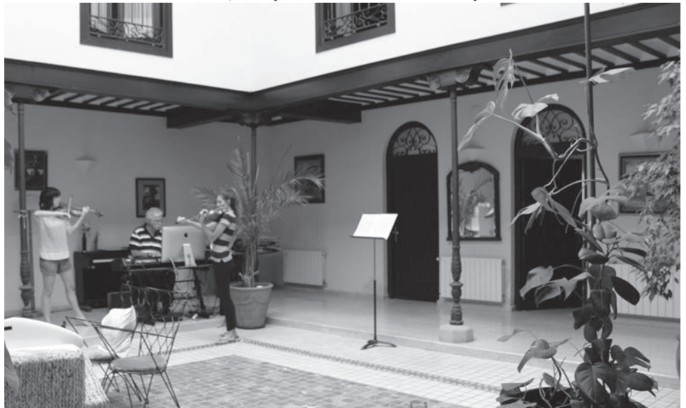
Patio de la familia Hatch, uno de los escenarios