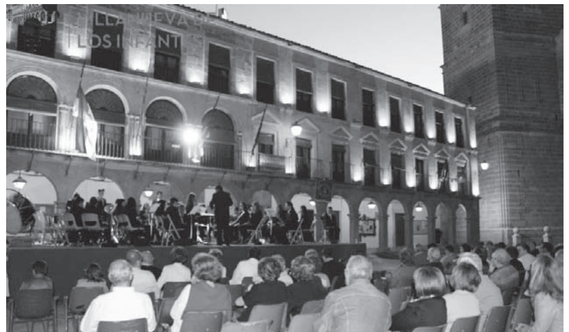
Público asistente al concierto en la Plaza Mayor