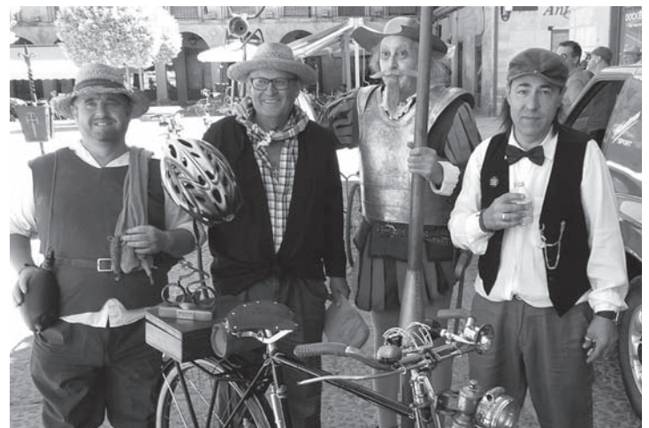
Un momento del encuentro en la Plaza Mayor

La principal intención de este encuentro fue de carácter solidario, con el fin de recaudar fondos para la asociación Actúa.