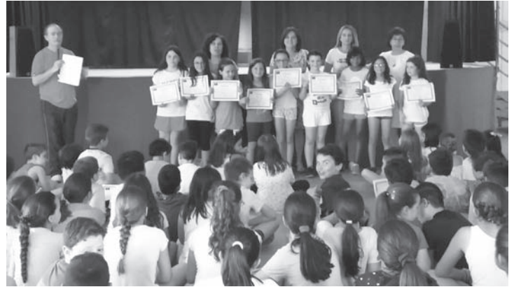
Entrega de diplomas a los alumnos

indicaciones de los agentes. La verdad es que se comportaron como conductores ejemplares.