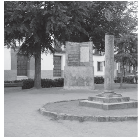
Monolito al Quijote en la Fuente Vieja

En él se muestra la Ruta científica del Quijote con sus distintos recorridos, según los estudios realizados siguiendo la Teoría General de Sistemas, y que demostrarían que Villanueva de los Infantes es “el Lugar de La Mancha” desde el que comienza sus andanzas el Caballero de la Triste Figura y de cuyo nombre no quiso acordarse D. Miguel de Cervantes.