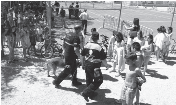
Demostración canina a los alumnos y profesores del colegio

Se iniciaba la mañana con una clase práctica de Seguridad Vial en bicicleta y patinete en circuito, dirigido por Policía Local y Protección Civil, poniendo así en práctica lo aprendido el curso anterior en las sesiones teóricas impartidas por la Policía. Los alumnos y alumnas, organizados por niveles, inundaban la pista del colegio con sus vehículos respetando las señales y las