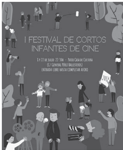
Cartel anunciador del festival de Cortos

Antes de las mismas, se repartirán entre todos los espectadores papeletas para que puedan votar por el que les haya parecido el mejor cortometraje. Los resultados de las votaciones se remitirán a CortoEspaña, y se sumarán a los obtenidos por cada cortometraje en el resto de localidades participantes de este espectáculo. De esta manera se decidirá finalmente, según una puntuación ya de ámbito nacional, cuál será el cortometraje ganador