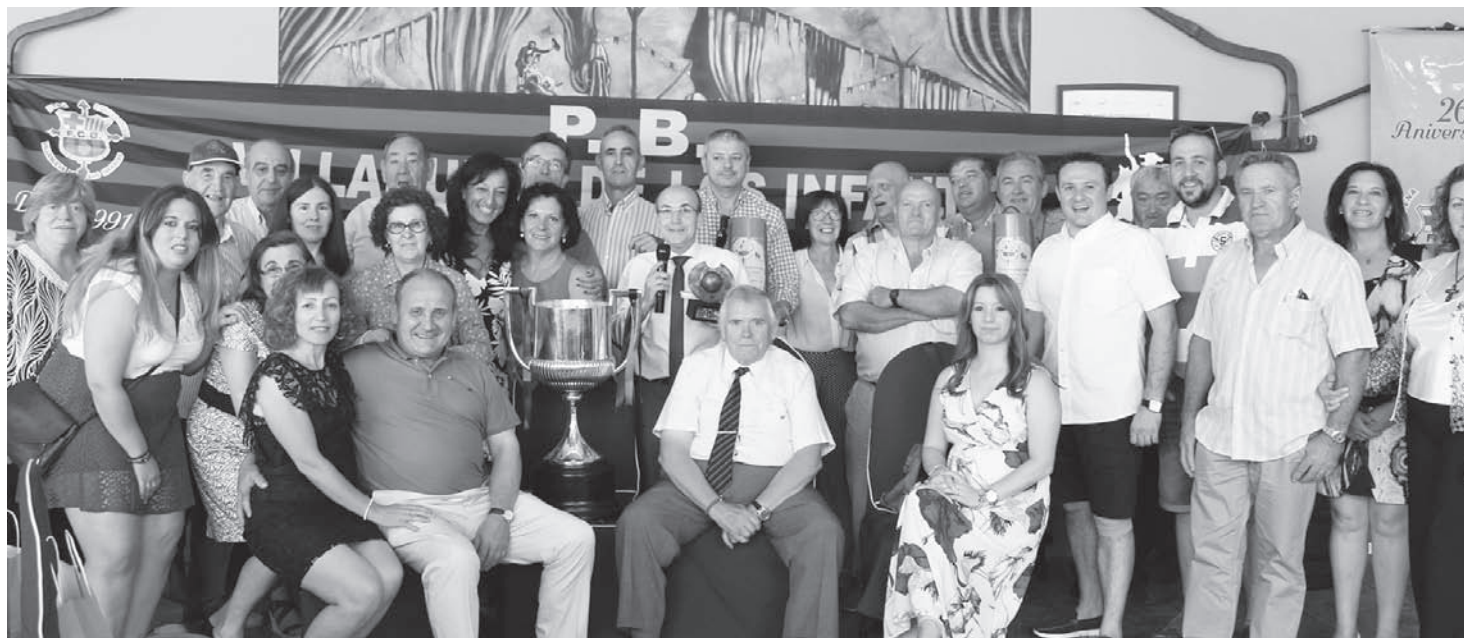
Miembros de la Peña Barcelonista de nuestra localidad acompañados de representantes del Ayuntamiento