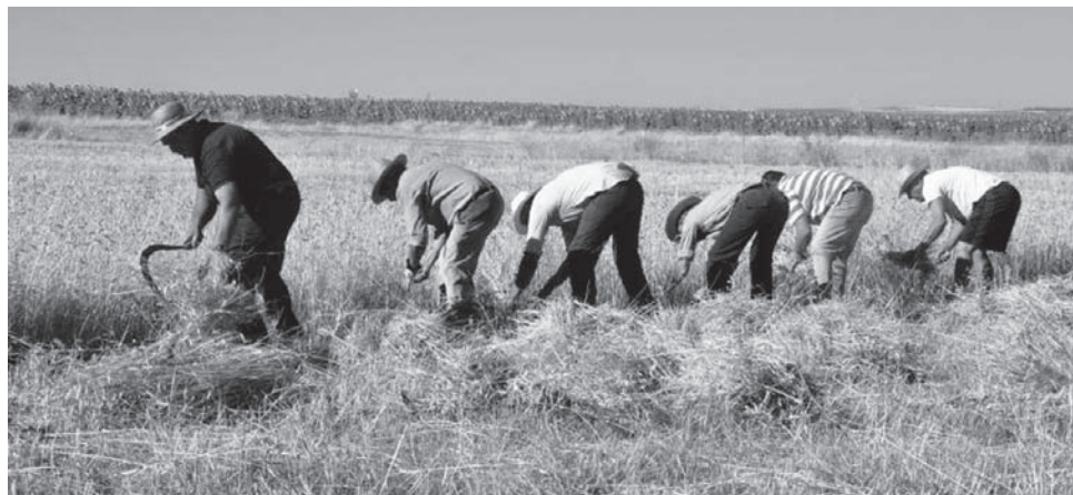
La siega tradicional era una de las tareas agrícolas más duras, debido a las condiciones en las que se realizaba