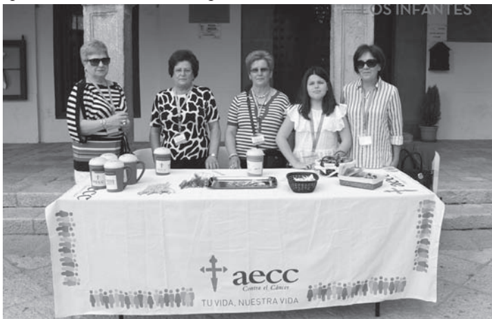
Una de las mesas de recogida de donativos contra el cáncer

La Junta local quiere agradecer a todos los infanteñ@s y visitantes su colaboración, además de a las entidades y cofradías que también realizan sus aportaciones.