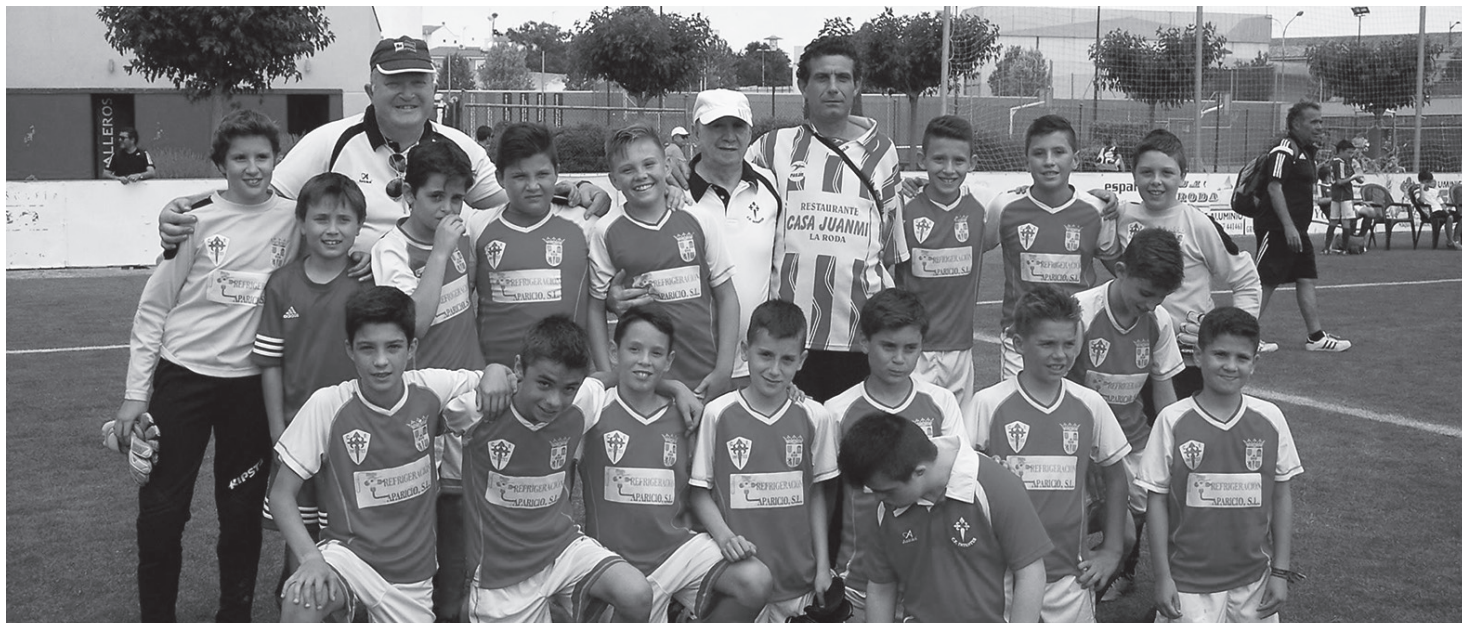
C.F Infantes alevín acompañado del cuerpo técnico

El Club de Fútbol Infantes de categoría alevín participa en el XXIII Torneo Nacional de Fútbol-8 de La Roda, junto a otros 31 equipos. Tras quedar primeros de su grupo y a las puertas de la semifinal tras vencer a equipos como Elche o Rayo Vallecano, finalmente se tuvo que conformar con el trofeo al equipo más deportivo al no perder ningún partido. ¡Enhorabuena a estas jóvenes promesas del fútbol!