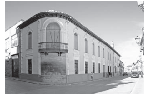
Exteriores del colegio Trilema Sagrado Corazón