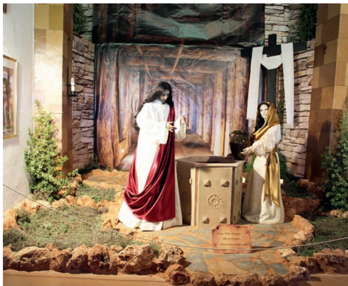
Cruz Ermita Jesús en Pie

NOTA DE LA REDACCIÓN: Como en alguna otra ocasión, hoy traemos aquí estas dos Cruces. La primera porque se omitió la inclusión en su momento a la hora de maquetar las páginas del Extra Cruces de Mayo. La segunda porque fue enviada posteriormente al cierre de ese mismo número.