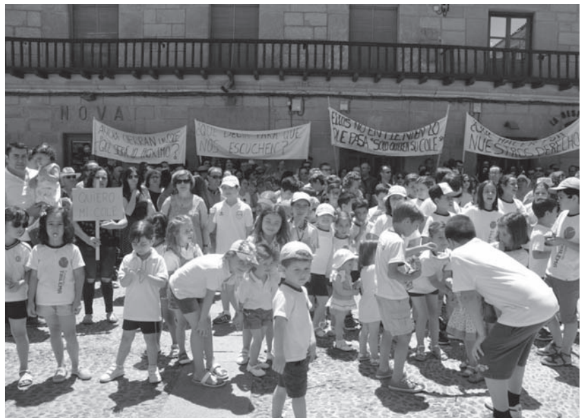
Manifestación en la Plaza Mayor en contra del cierre del Colegio

Antes las reacciones del fin de semana, el AMPA del Colegio Trilema Sagrado Corazón pide que se deje de utilizar el colegio como arma arrojadiza entre partidos políticos.