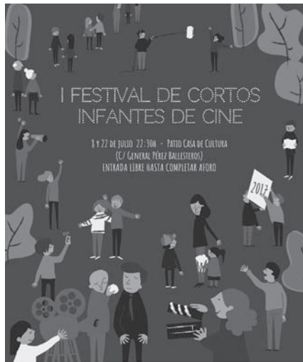
Cartel anunciador del I Festival de Cortos

En cada una de las sesiones, que darán comienzo a las 22.30 horas, con entrada libre hasta completar aforo, se repartirán papeletas entre los espectadores para votar el mejor corto. Los resultados de este jurado popular se enviarán a CortoEspaña y se sumarán a los obtenidos por cada uno de los cortometrajes en el resto de ciudades participantes, obteniéndose finalmente una puntuación de ámbito nacional que determinará el corto ganador.