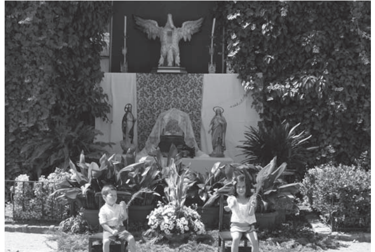
Uno de los altares situados durante el recorrido procesional