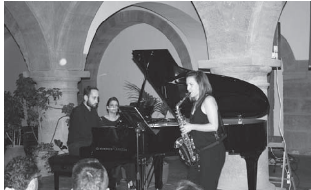
Momento de la Presentación celebrada en la Alhóndiga