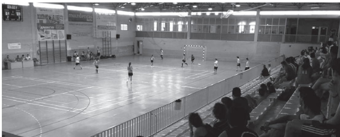
Panorámica del Pabellón Cubierto en uno de los maratones de verano