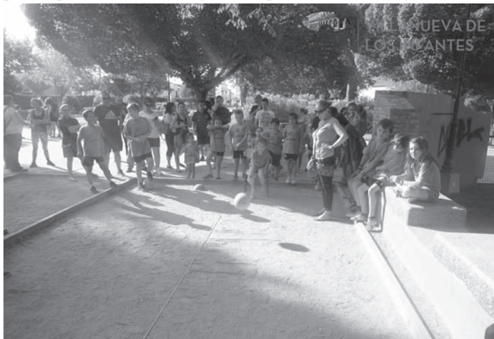
Un momento de las actividades celebradas en el Parque de la Constitución

Una jornada lúdico-deportiva en la que grandes y pequeños disfrutaron del buen tiempo y de un refrigerio a mitad de la tarde, para reponer fuerzas y seguir compitiendo.