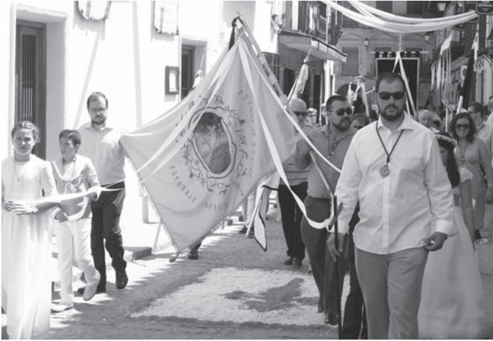
Procesión del Corpus por las calles de nuestro pueblo

El pasado domingo día 18, las calles de Villanueva de los Infantes se han despertado engalanadas con alfombras de serrín tinto. La elaboración de las alfombras ha mantenido trabajando, hasta casi rayar el alba, a muchos voluntarios y voluntarias, que han querido engrandecer la procesión del Corpus Christi, cuyo recorrido transcurre por algunas de las arterias principales de la ciudad.