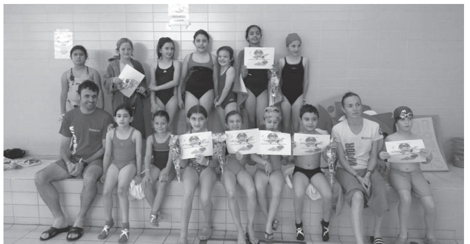
Participantes en los cursos de Natación junto a sus monitores

Se ofertan las modalidades de iniciación, medio-bajo, medio-alto y perfeccionamiento, en horarios de mañana y tarde. Las pruebas de nivel e inscripciones para el primer turno tendrán lugar el día 21 de junio de 19.30 a 20.30 horas y el 22 de junio de 11 a 19.30 horas. Los horarios se adjudicarán por riguroso orden de inscripción. El precio es de 30 euros por curso, existiendo descuentos del 25% para las familias numerosas.