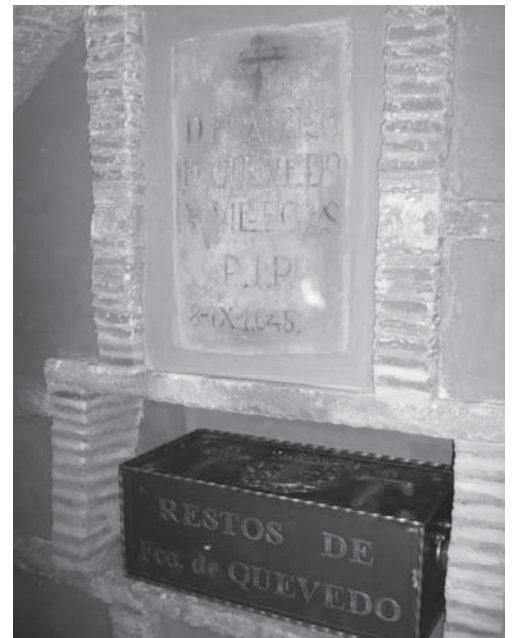
Restos de Fco. de Quevedo en la Iglesia Parroquial de San Andrés Apóstol

Y que mejor que preparar el centenario de la beatificación de nuestro Santo Patrón a celebrar el próximo año 2018, leyendo esta obra de D. Francisco de Quevedo el Epítome a la vida de Fray Tomás de Villanueva”, déjenme recordar un pequeño trozo del final, escribe Quevedo “Oh monstruo de santidad que supiste merecer los cargos y despreciarlos y servirlos; a quien fue martirio la mitra, afán el arzobispado, la renta necesidad, los pobres hijos, y la grandeza y dignidades mortificación; tan santo que supiste fortalecer la ciencia y doctrina de humildad; tan docto, que bastaste a asegurar la doctrina y estudios con los tesoros de la misericordia, tan rico que socorriste todos los pobres; tan pobre, que tu desnudez, ni parientes no participaron de tu riqueza porque acudiste antes a la parentela del Padre Soberano...”