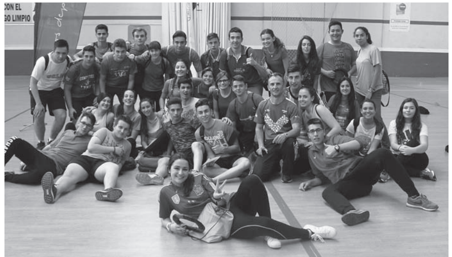
Alumnos del IES Fco. de Quevedo en el Pabellón La Molineta de Valdepeñas

A lo largo de la mañana del día 29 de mayo, más de 200 alumnos se desplazaron a las instalaciones deportivas de La Molineta para culminar un proyecto educativo de un nuevo modelo metodológico, el MED, en el que los alumnos pasan a ser gestores propios de su aprendizaje por medio de la creación de equipos deportivos, con el objetivo final de aprender a jugar al Ringo, un deporte alternativo de cancha dividida, de muy fácil aprendizaje. Los objetivos que los docentes pretendemos conseguir con esta actividad son: Responsabilizar al alumnos de su aprendizaje con capacidad de iniciativa y autonomía, enseñarles a organizar eventos deportivos, sentir la importancia de participar en equipo y sentido de pertenencia, darles herramientas para poder ocupar su tiempo de ocio con actividades motrices, formarlos como espectadores cultos, desarrollar la empatía con la labor de arbitral y como