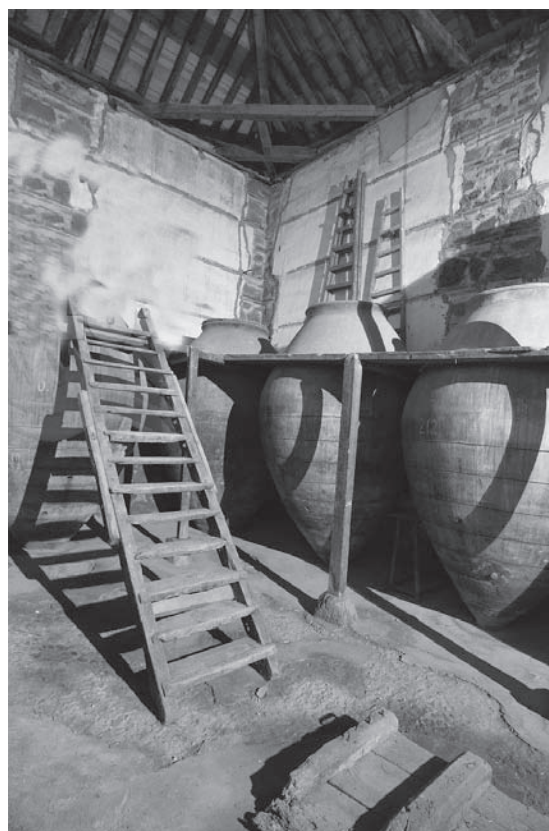
Antigua Bodega

La Alcaldía comunicó a los fotógrafos de la ciudad que remitieran al Ayuntamiento fotografías artísticas de la ciudad para enviarlas a una exposición que se celebraría en Manzanares.