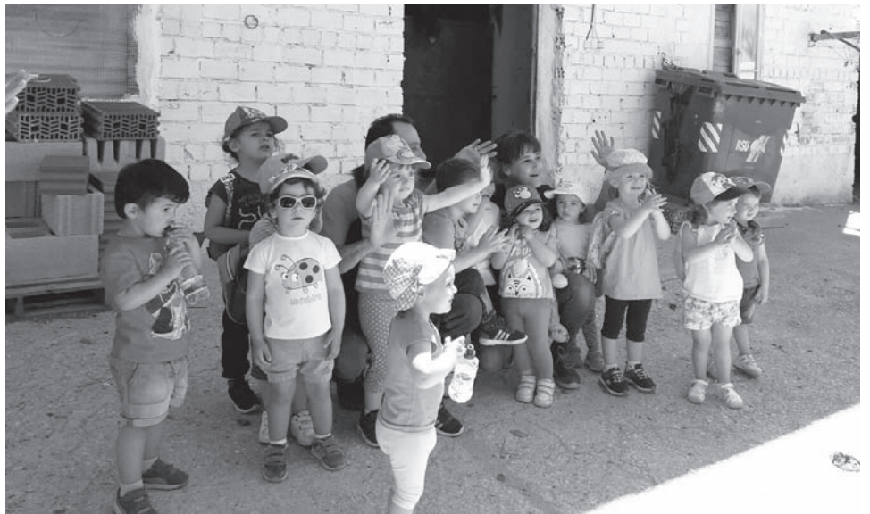
Alumnos de la Escuela Infantil acompañados de los propietarios de la Granja-huerta

También queremos recordar a los nuevos papás y mamás que estamos a su disposición para atender a sus pequeños y pequeñas