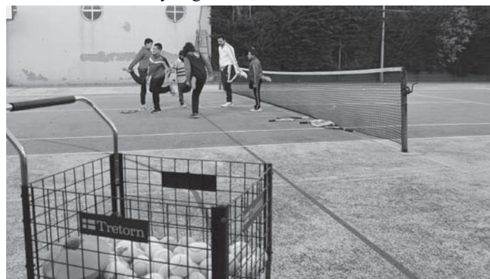
EMD de tenis en un entrenamiento en la pista anexa del Pabellón Cubierto

Por último, los escolares de Educación Primaria de categorías inferiores a alevín han participado, como viene siendo habitual en estos últimos años, en las Olimpiadas Rurales del Campo de Montiel organizadas por la Diputación Provincial, enfrentándose a niños y niñas de otras localidades de la comarca en deportes como Bádminton, Baloncesto, Balonmano, Campo a Través, Fútbol, Fútbol-Sala y Jugando al Atletismo.