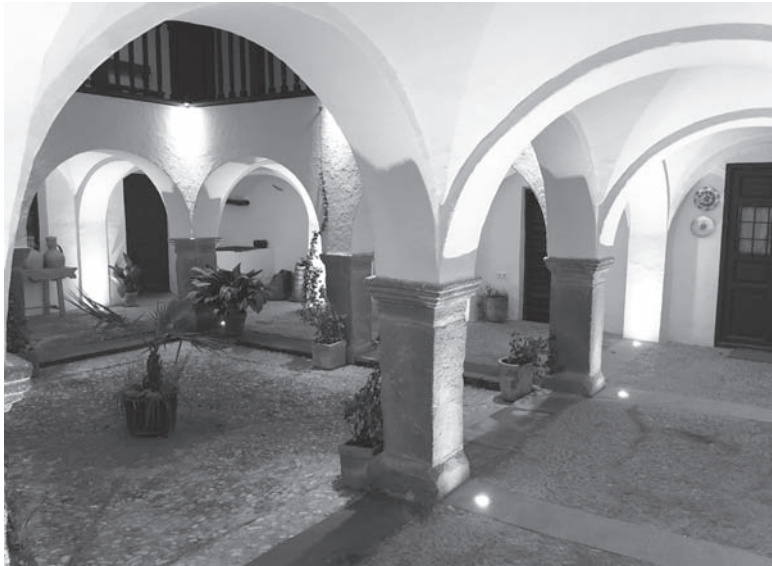
Casa de los Estudios