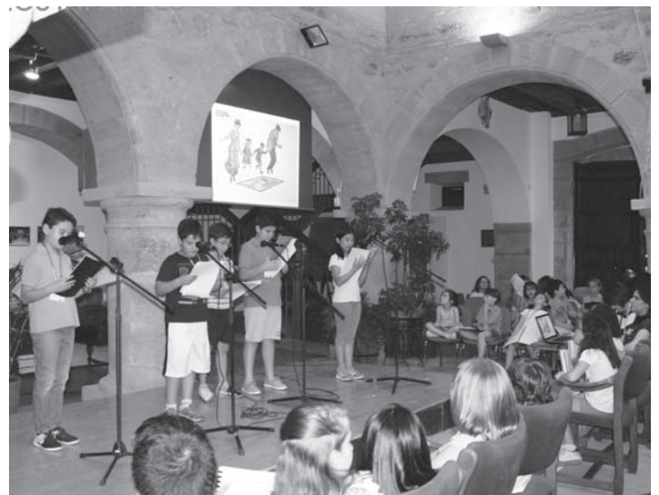
Clausura de las actividades de animación a la lectura en la Alhóndiga