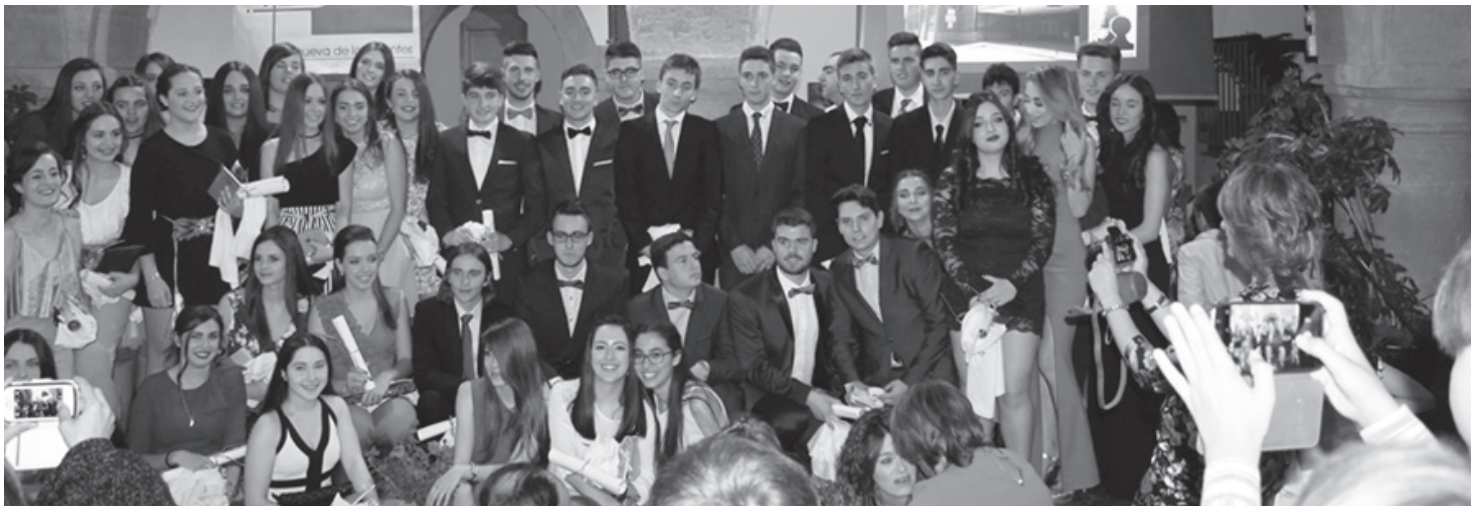
Alumnos del IES Ramón Giraldo en el acto de graduación celebrado en la Alhóndiga

En definitiva, un acto lleno de sonrisas, lágrimas y emociones. Un acto de incertidumbres y anhelos, de esperanza en el futuro y cerrado con el firme propósito de ser repetido los años venideros con las futuras generaciones que en el IES Ramón Giraldo finalicen sus estudios.