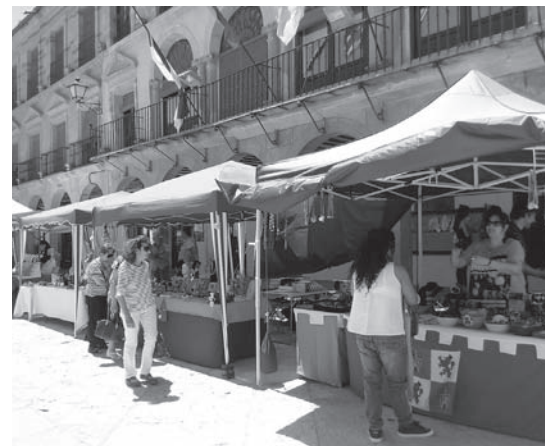
Imagen de la Feria situada en la Plaza Mayor

El programa REDMUR, que se ha implementado en seis Comunidades Autónomas gracias al Ministerio de Sanidad, Servicios Sociales e Igualdad, va a desarrollar en Castilla-La Mancha itinerarios de inserción socio-laboral en diferentes comarcas, como el Campo de Montiel.