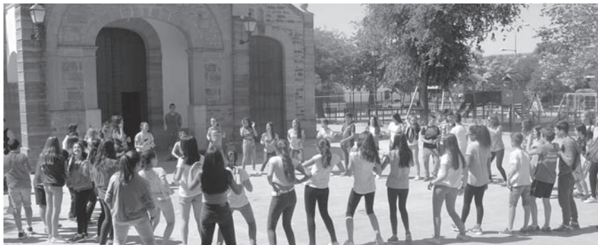
Alumnos del IES Fco. de Quevedo durante el transcurso de la actividad

El pasado día 1 de junio, los alumnos del IES Francisco de Quevedo han participado en las actividades programadas para celebrar el día de la educación física en la calle, enmarcadas en el “Programa actividades complementarias” del Proyecto Escolar Saludable de nuestro centro. Una nueva actuación que pretende concienciar sobre la importancia de la práctica continuada y saludable de la actividad física.